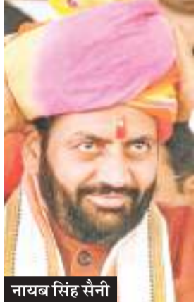
नायाब सिंह सैनी

हरियाणा विधानसभा चुनाव 2024 के नतीजे सामने हैं। भाजपा ने सभी एग्जिट पोल के अनुमानों को गलत साबित करते हुए 52 साल का रिकॉर्ड भी तोड़ दिया है। अब पार्टी राज्य में तीसरी बार सरकार बनाने के लिए तैयार है। वहीं, कांग्रेस को ओवर कॉन्फिडेंस का खामियाज भुगतना पड़ा। ज्यादातर एग्जिट पोल में कांग्रेस को बंपर बहुमत मिलता दिखाया गया था। लेकिन कांग्रेस यहां 37 सीटें ही जीत पाई।