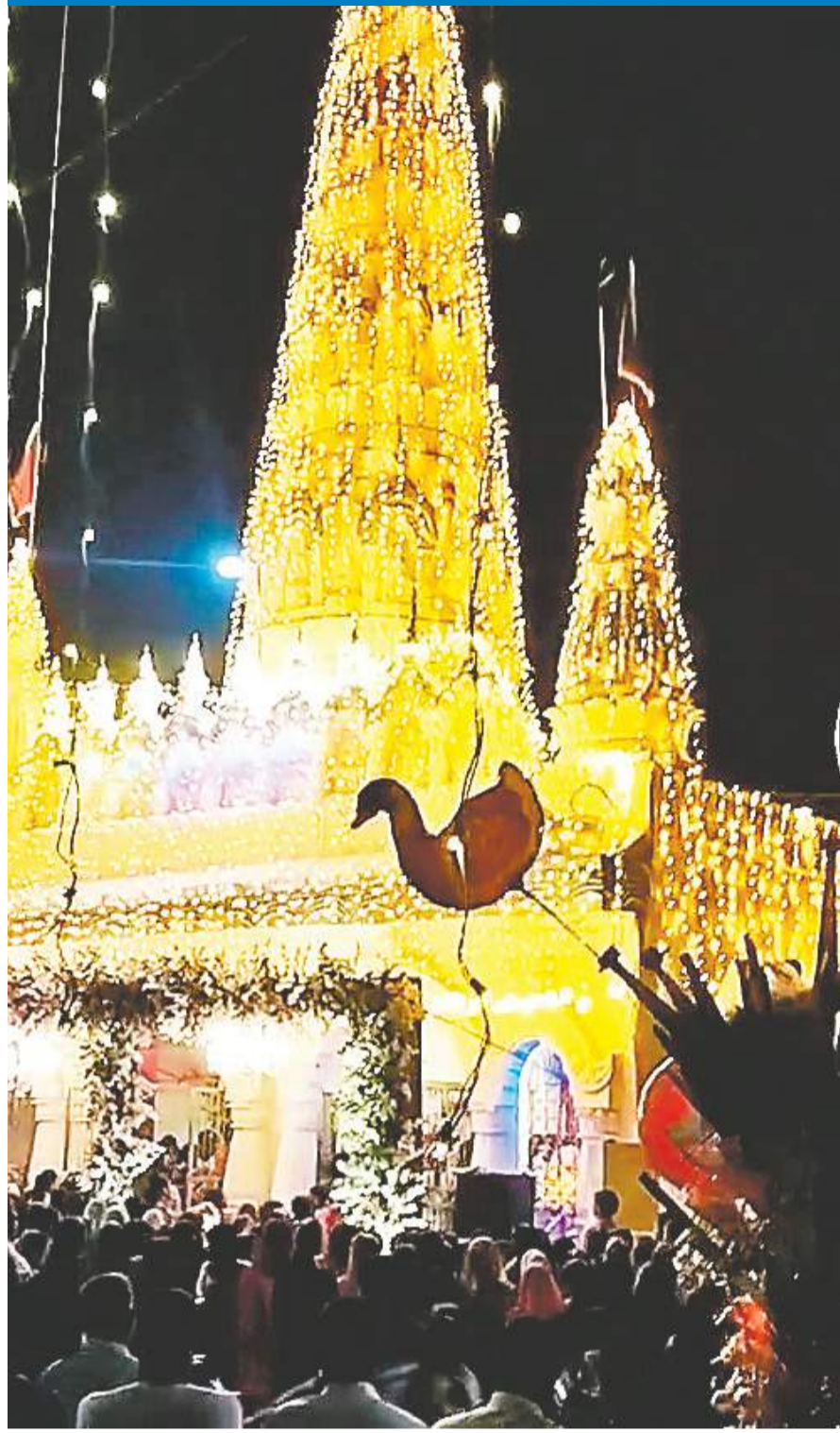
दुर्गा पूजा को लेकर चतरा में रंग-बिरंगी रोशनी में नहाया एक पंडाल मांग जाइके के भक्तों को आकर्षित कर रहा है। इसी तरह जिले के अन्य कई स्थानों पर भी विभिन्न पूजा समितियों द्वारा दुर्गा पूजा पंडाल का निर्माण किया गया है।