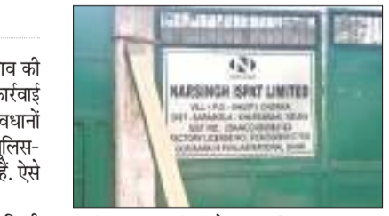
नरसिंह इस्पात लिमिटेड कंपनी.

नरसिंह इस्पात कंपनी में बार-बार गैस रिसाव की घटना होने के बावजूद भी कंपनी के खिलाफ कार्रवाई नहीं होना चिंताजनक है। यहां सरकार के प्रावधानों के विपरीत मजदूरों से काम लिया जा रहा। पुलिस-प्रशासन के अफसर हाथ पर हाथ धरे बैठे हैं। ऐसे ही कई सवाल और बातें क्षेत्र में चल रही हैं।