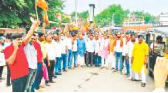
जश्न मनाते भाजपा नेता व कार्यकर्ता