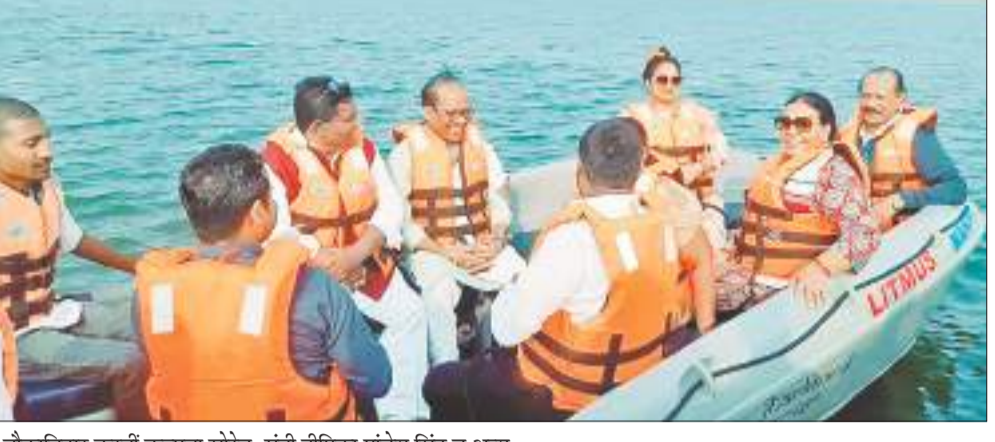
नौकाविहार करती कल्पना सोरेन, मंत्री दीपिका पांडेय सिंह व अन्य.