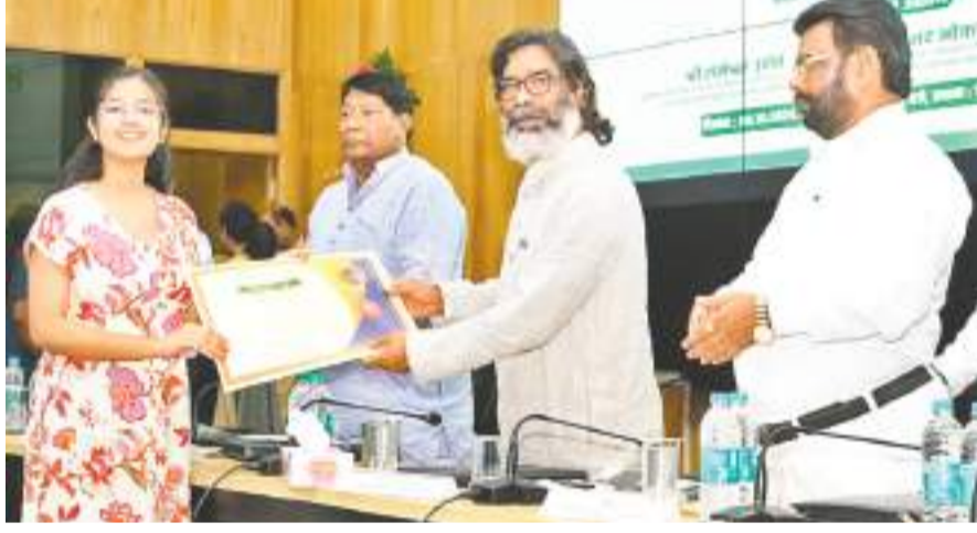
प्रोजेक्ट भवन में महिला अभ्यर्थी को नियुक्ति पत्र प्रदान करते और छात्रा को प्रशस्ति पत्र देते सीएम हेमंत सोरेन।