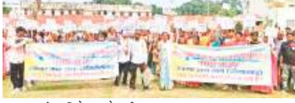
जन सुनवाई का विरोध करते ग्रामीण.