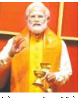
चंद्रशेखर आजाद दुर्गा पूजा समिति के पंडाल में लगी पीएम मोदी की मूर्ति।

करते दिखाया गया है। यह पंडाल काशी विश्वनाथ के दशाश्वमेध घाट की थीम पर बनाया गया है। वहीं, रातू रोड स्थित आरआर स्पोर्टिंग क्लब के