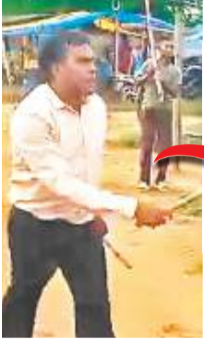
वायरल वीडियो में पुलिस पर डंडे से हमला कर रहा युवक।

पुलिस ने मौके पर पहुंच कर मामले की जांच की, तो पता चला कि घटना के बाद मारपीट करने वाला आरोपी गांव के जम्हार बाजार गया है। इसके बाद पुलिस बाजार पहुंची, तो आरोपी वहां आराम से बैठ कर शराब पी रहा था। पुलिस ने आरोपी को पकड़ लिया और उसे अपने साथ थाने ले जाने लगी। इसी बीच आरोपी का भाई वहां पहुंच गया और उसने जोर-जोर से चिल्लाना शुरू कर दिया कि पुलिस एक आदिवासी युवक को मार रही है।