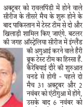
अक्टूबर को रावलपिंडी में होने वाले सीरीज के तीसरे मैच के शुरू होने के बाद पाकिस्तान में टेस्ट टीम से दो और खिलाड़ी शामिल किए जाएंगे। बटलर की जगह ऑस्ट्रेलिया सीरीज में इंग्लैंड की अगुआई करने वाले हेरी ब्रूक टेस्ट टीम का हिस्सा हैं। ऑस्ट्रेलिया के लिए भी शुरुआत वनडे से होगी - पहले दो मैच 31 अक्टूबर और 2 नवंबर को एंटीगुआ में होंगे, उसके बाद 6 नवंबर को तीसरे मैच के लिए बारबाडोस जाएंगे। पांच टी20 मैच 9 से 17 नवंबर के बीच खेले जाएंगे।

वेस्टइंडीज के आगामी दौर के लिए नियमित सीमित ओवरों के कप्तान जोस बटलर की इंग्लैंड की टीम में वापसी होगी। इंग्लिश टीम वेस्टइंडीज दौरे पर इस साल अक्टूबर-नवंबर में तीन टी20 और पांच वनडे खेलेगी। बटलर हाल ही में ऑस्ट्रेलिया के खिलाफ टी20 और वनडे मैचों में नहीं खेल पाए थे क्योंकि वे पिंडली की चोट से उबर रहे थे। इंग्लैंड ने लातारतार दो गेम जीतकर वापसी की और पहला सेट जीतकर रखा। हालांकि, विष्णु ने पहला सेट जीतने के लिए अपने अनुभव का इस्तेमाल किया। दूसरे सेट में कड़ी टक्कर देखने को मिली, स्कोर 5-5 से बराबर था, लेकिन भिक्की ने अपने खेल को बेहतर बनाते हुए अगले दो गेम जीतकर मैच को बराबर कर दिया। अंतिम सेट में विष्णु ने दबदबा बनाते हुए 6-2 से जीत दर्ज की।