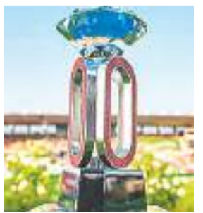
प्रतियोगिता संयुक्त राज्य अमेरिका में आयोजित की जाएगी, जहां जुलाई में ओरेगन के यूजीन में प्रोफ्रोंटेन कन्वेंशन का आयोजन किया जाएगा। मोनाको, लंदन, सिलेसिया, लोजेन और ब्रुसेल्स जुलाई और अगस्त में मुकाबलों की मेजबानी करेगी।

है। शंघाई/सूज़ी से एक हफ्ते पहले 26 अप्रैल को जियामेन उद्घाटन कार्यक्रम की मेजबानी करेगा। जून में रोम में होने वाली पहली यूरोपीय मीट से पहले मई में दोहा और रबात में मीटिंग निर्धारित है। ओसलो, स्टॉकहोम और पेरिस में होने वाले आयोजनों के बाद,