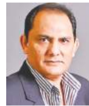
ईडी ने कांग्रेस नेता को यह पहला समन जारी किया है

प्रवर्तन निदेशालय (ईडी) ने हैदराबाद क्रिकेट एसोसिएशन (एचसीए) के वित्तीय घोचाले से जुड़े मनी लॉन्ड्रिंग मामले में पूर्व क्रिकेटर और कांग्रेस नेता मोहम्मद अजरुहदीन को तलब किया है। ईडी ने उन्हें गुरुवार को पूछताछ के लिए बुलाया है। वे एचसीए के अध्यक्ष रह चुके हैं।