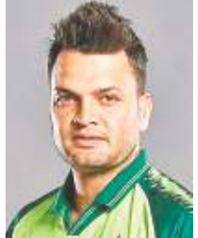
भी हिस्सा नहीं लेंगे। यहां दिलचस्प बात ये है कि उस्मान कादिर ने अपने सोशल मीडिया पोस्ट में कहीं इंटरनेशनल क्रिकेट को अलविदा कहने की बात नहीं लिखी है।

पाकिस्तान के फैंस अभी बाबर आजम के कप्तानी पद छोड़ने के झटके से उबर भी नहीं थे कि अब उन्हें एक और बड़ा झटका लगा है। दरअसल पाकिस्तान के एक बेहतरीन गेंदबाज ने अचानक अपने ही देश के क्रिकेट से नाता तोड़ दिया है।