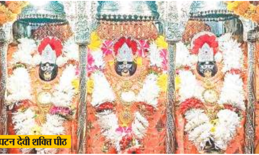
पटन देवी शक्ति पीठ

अररिया । फारबिसगंज थाना क्षेत्र के अंतर्गत फारबिसगंज अररिया मुख्य सड़क मार्ग एनएच 57 फोरलेन सड़क के किनारे गुरुवार की सुबह एक अज्ञात व्यक्ति का सिर कटा शव मिला. स्थानीय लोगों ने सड़क के किनारे सिर कटा शव देख फारबिसगंज थाना पुलिस को इसकी सूचना दी. जिसके बाद मौके पर पहुंची पुलिस ने शव को अपने कब्जे में लिया और पोस्टमार्टम के लिए अररिया सदर अस्पताल भिजा दिया. शव को देखने से युवक की उम्र 20 से 25 वर्ष के आसपास लग रही है. मृतक काला फूल पेंट और भगवा कलर का सांडों गंजी पहना हुआ है.