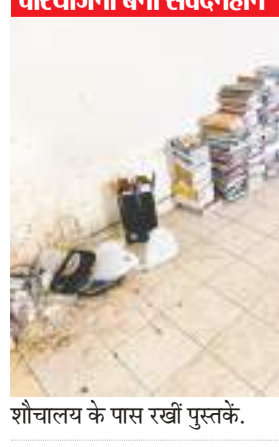
शौचालय के पास रखी पुस्तकें.