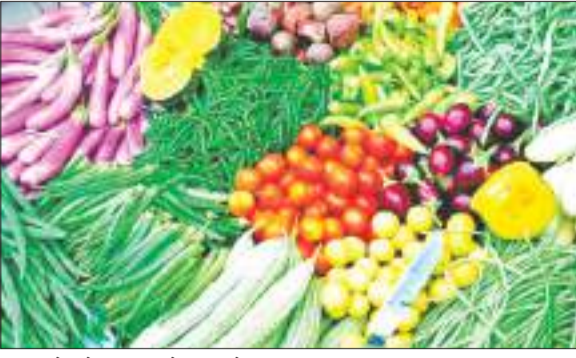
भंडरा क्षेत्र के बाजारों में विक्री के लिए उपलब्ध सब्जियां।

रसोई पर पड़ रही महंगाई की मार : सब्जियों के बढ़े हुए रेट ने