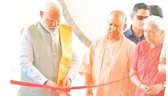
पीएम मोदी काशी में योजनाओं का उद्घाटन करते हुए।

पीएम ने काशी समेत देश को दिया हजारों करोड़ का दिवाली गिफ्ट