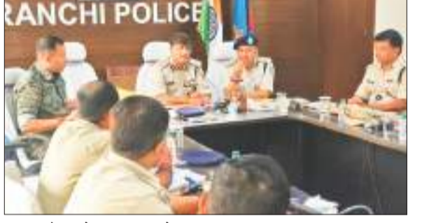
समीक्षा बैठक में रणनीति बनाते पुलिस अधिकारी.

संवाददाता। रांची विधानसभा चुनाव में सुरक्षा व्यवस्था को लेकर डीआईजी अनूप बिरथरे ने समीक्षा बैठक की. वरिय पुलिस अधीक्षक कार्यालय के सभागार में विधानसभा चुनाव 2024 को लेकर सुरक्षा व्यवस्था पर समीक्षा बैठक की. इस मौके पर डीआईजी ने चुनाव को लेकर जिले में सुरक्षा को लेकर पुलिस की तैयारी की जानकारी ली. डीआईजी ने जिले के उपवाद प्रभावित इलाकों में सुरक्षा बलों को पूरी तरह एहतियात बरतते