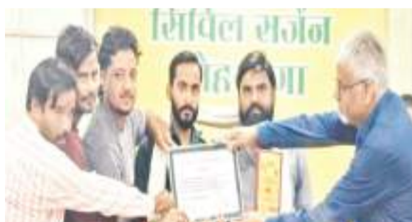
सदर अस्पताल में सम्मानित होते मुस्लिम यूथ की टीम