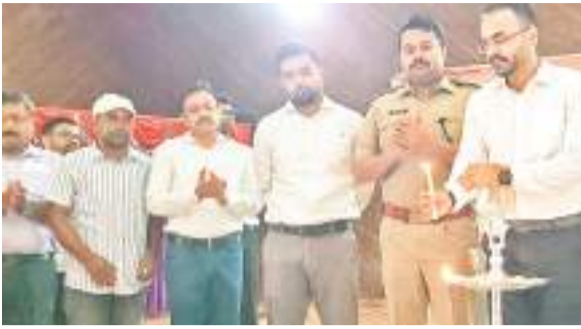
कार्यक्रम का दीप प्रज्वलित कर शुभारंभ करते डीसी और एसपी