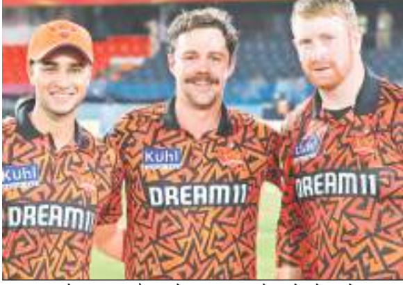
सनराइजर्स के जल्द ही ट्रैविस हेड और नितीश कुमार रेड्डी को भी रिटेन करने की संभावना है। आईपीएल ने इस साल के अंत में होने वाली मेगा नीलामी से पहले रिटेंशन के लिए 31 अक्टूबर की समय सीमा तय की है। कर्मिस, जिन्होंने पिछले सीजन में सनराइजर्स को फाइनल तक पहुंचाया

फ्रैंचाइजी ने दो अन्य रिटेंशन डील को भी अंतिम रूप दिया है, जो ऑस्ट्रेलियाई ऑलराउंडर पैट कर्मिस (18 करोड़ रुपये), जो 2024 में सनराइजर्स के कप्तान थे, और भारत के ऑलराउंडर अभिषेक शर्मा (14 करोड़ रुपये) हैं। समझा जाता है कि