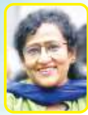
संगीता कुजारा टाक

हम सभी जानते हैं, भारत त्योहारों का देश है। भारत वर्ष में बारह महीने में, बारह चौथ के व्रत विधान है। सभी चौथ के व्रतों की अलग-अलग कहानियां और विधियां हैं। सभी चौथ व्रतों में, कार्तिक की करवा चौथ का बहुत महत्व है। शाम होते ही सभी सुहागिन खूब सज-धज कर एक नियत समय पर, एक नियत स्थान पर इकट्ठी होती हैं। बीच में करवा देवी की स्थापना कर, उसके चारों ओर गोल घेरे में बैठकर अपनी पूजा की थाली एक-दूसरे के साथ घुमाती हुई सुहागिनें, पूरे मनोरंजन से करवा के गीत गाती हैं। आह! क्या दृश्य होता है! सुहागिनें लाल साड़ियों में, माथे पर लाल बिंदी लगाकर, लाल-हरी चूड़ियों वाली कलाइयों की खन-खन के साथ, मेहंदी लगे हाथों में करवा और पूजा की थाली और पूजा की थाली में सासू के लिए मिठाई, मेवे, आटे के दीपक की नारंगी लौ और मन में पति के लिए प्रार्थनाएं करते हुए, होंठों पर करवा के गीत और सुर्यस्त की लालिमा से ओतप्रोत सांझ की बेला! इस नजारे से मला कौन आकर्षित नहीं होगा?