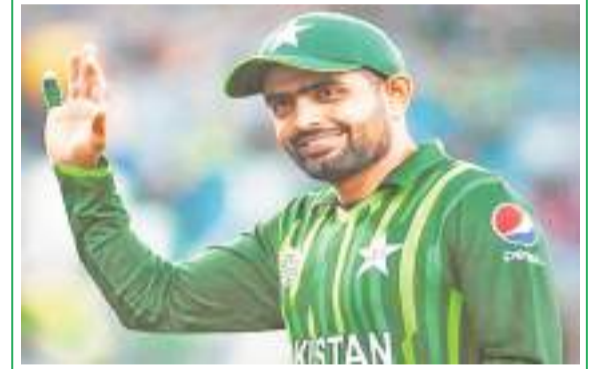
बाबर आजम ने एक्स पर पोस्ट शेयर कर लिखा कि मैं आज आपके साथ कुछ समाचार साझा कर रहा हूँ। मैंने पिछले महीने पीसीबी और टीम प्रबंधन को दी गयी नोटिफिकेशन के अनुसार पाकिस्तान पुरुष क्रिकेट टीम के कप्तान के रूप में इस्तीफा देने का फैसला किया है। इस टीम का नेतृत्व करना मेरे लिए सम्मान की बात है, लेकिन अब समय आ गया है कि मैं पद छोड़ दूँ और अपने खेल पर पूरा ध्यान लगाऊँ। उन्होंने आगे लिखा कि कप्तानी एक रिवॉइंग एक्सपीरियंस रहा, लेकिन इसने काम का बोझ भी बढ़ा दिया। मैं अपने प्रदर्शन को प्राथमिकता देना चाहता हूँ, अपनी बल्लेबाजी का आनंद लेना चाहता हूँ और अपने परिवार के साथ क्वालिटी टाइम बिताना चाहता हूँ, जिससे मुझे खुशी मिलती है।