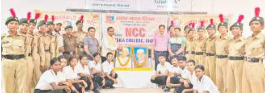
महात्मा गांधी व लाल बहादुर शास्त्री को तस्वीर पर पुष्प अर्पित करने के बाद खड़े प्रचार्य व एनसीसी कैडेट्स।