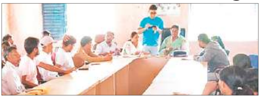
पंचायत नावाडीह में बुधवार को आयोजित विशेष ग्राम सभा में मौजूद लोग।

गांधी जयंती के अवसर पर बुधवार को ग्राम पंचायत नावाडीह में विशेष ग्राम सभा का आयोजन किया गया। इस दौरान राष्ट्रपिता महात्मा गांधी और लालबहादुर शास्त्री के चित्र पर पुष्पांजलि अर्पित करते हुए विभिन्न महत्वपूर्ण मुद्दों पर चर्चा की गई। कार्यक्रम की शुरुआत ग्रामीणों में राष्ट्र प्रेम और संविधान के प्रति जागरूकता की भावना को प्रोत्साहित करने के उद्देश्य से राष्ट्रपान, राष्ट्रीय प्रतिज्ञा और संविधान की प्रस्तावना के साथ हुई। इसके पश्चात, पंचायत प्लानिंग के अंतर्गत एक वीडियो प्रस्तुत किया गया, जिसमें पंचायत की योजनाओं और ग्रामीण