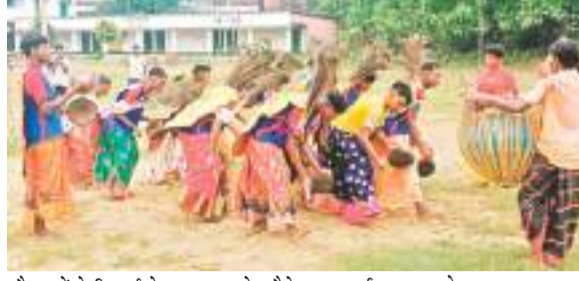
चौका में देवी दुर्गा के आवाहन के मौके पर दर्शनाच करते कलाकार।

बांसुरी, करतल आदि वाद्य यंत्रों के साथ गीत गाते हुए नृत्य करते हैं। चौका मोड़ स्थित नवदुर्गा मंदिर प्रांगण में बुधवार को महालया के अवसर पर आसपास के दर्शनाच के पहले स्वरूप मां शैलपुत्री की पूजा के लिए कलश यात्रा निकाली जाएगी। सुबह आठ बजे कलश स्थापना के बाद पूजा-अर्चना