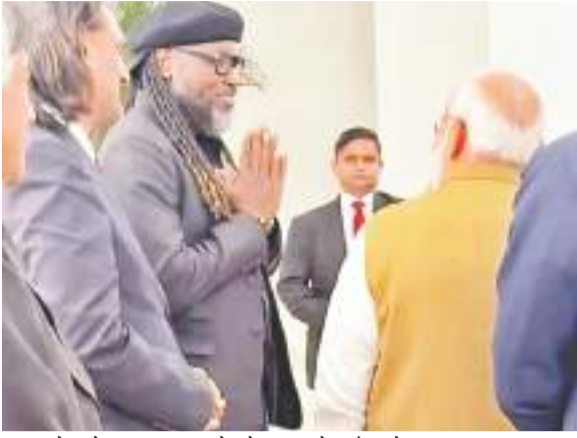
पीएम मोदी से मुलाकात की। होलनेस सोमवार को ऐतिहासिक चार दिवसीय यात्रा पर नई दिल्ली पहुंचे, जो जर्मका के क्रिस लीडर की भारत की पहली द्विपक्षीय यात्रा है, जर्मका के प्रधानमंत्री की यह यात्रा 3

वेस्टइंडीज के पूर्व दिग्गज क्रिकेटर क्रिस गेल ने पीएम मोदी से मुलाकात का वीडियो शेयर किया है। इस दौरान 'यूनिवर्स बॉस' काफी खुश दिखे और उन्होंने मुलाकात के दौरान हाथ जोड़कर पीएम मोदी का अभिवादन किया। गेल ने यह वीडियो सोशल मीडिया पर शेयर किया और कैप्शन में, लिखा, "भारत के प्रधानमंत्री नरेंद्र मोदी से मिलकर सम्मान की अनुभूति हुई, जैसा कि मैंने इंडिया में गेल को पीएम मोदी को 'नमस्ते' कहते हुए देखा जा सकता है। वेस्टइंडीज के महान क्रिकेटर क्रिस गेल ने जर्मका के प्रधानमंत्री एंड्रयू होलनेस की भारत की द्विपक्षीय यात्रा के दौरान