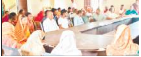
ग्राम सभा में मौजूद लोग।