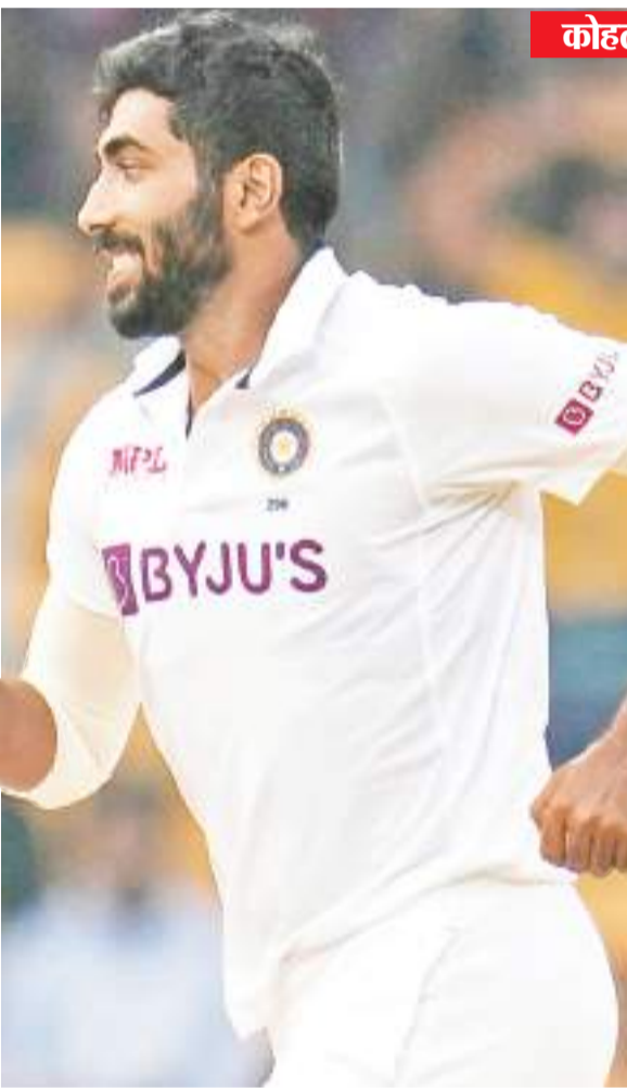
गेंदबाजों में सर्वोच्च रैंकिंग हासिल करने वाले इकलौते भारतीय गेंदबाज थे। वह दिसंबर, 1979 से फरवरी, 1980 के बीच दूसरे स्थान पर रहे थे। जायसवाल तीसरे स्थान पर पहुंचे: बांग्लादेश के खिलाफ दो मैचों की टेस्ट सीरीज में सर्वाधिक

पहले भी शीप पर काबिज हो चुके बुमराह : यह दूसरा मौका है जब बुमराह टेस्ट रैंकिंग में शीप पर पहुंचे हैं। इससे पहले इसी साल फरवरी में इंग्लैंड के खिलाफ सीरीज के बाद तेज गेंदबाज ने पहला स्थान हासिल किया था। तब उन्हें तीन स्थानों का फायदा हुआ था। वह शीप टेस्ट गेंदबाज बनने वाले पहले भारतीय तेज गेंदबाज बन गए थे। उनसे पहले पूर्व भारतीय कप्तान कपिल देव टेस्ट