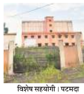
विशेष सहयोगी। पटमदा

पटमदा के बामनी में दो वर्ष से बनकर तैयार कोल्ड स्टोरेज का उद्घाटन 3 अक्टूबर को होगा। इसकी तैयारियां जहां पूरी हो गई हैं, वहीं कोल्ड स्टोरेज को लेकर किसानों में भ्रम की स्थिति है। वहां कौन-कौन से उत्पाद रखे जाएंगे, इसको लेकर किसान अनभिज्ञ हैं। रघुवर दास की सरकार में कोल्ड स्टोरेज के निर्माण की अनुशंसा हुई थी। लेकिन हेमंत सरकार ने इसका निर्माण कराया। 2022 में कोल्ड स्टोरेज का भवन बनकर तैयार हो गया। लेकिन तकनीकी कारणों से यह चालू नहीं हो पाया। जिसके कारण भवन के साथ-साथ वहां के उपस्कर कोल्ड स्टोरेज की क्षमता 5 हजार एमटी (मिट्रिक टन) है।