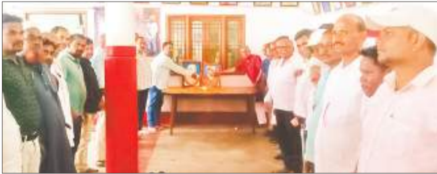
चौपारण प्रखंड कार्यालय में बुधवार को आयोजित कार्यक्रम में महात्मा गांधी और लाल बहादुर शास्त्री को श्रद्धांजलि दी गई।