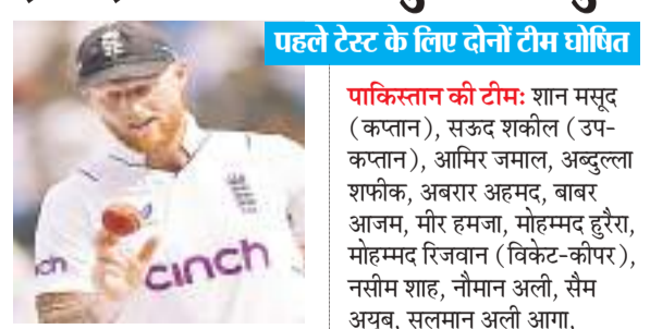
3-0 से जीत हासिल की थी। मुल्तान और रावलपिंडी में होने वाले आगामी टेस्ट मौजूदा विश्व टेस्ट चैंपियनशिप चक्र का हिस्सा हैं। इंग्लैंड 42.19 पॉइंट प्रतिशत के साथ डब्ल्यूटीसी में चौथे स्थान पर है, जबकि पाकिस्तान 19.05 पॉइंट प्रतिशत के साथ आठवें स्थान पर है। इंग्लैंड ने वेस्टइंडीज और श्रीलंका के खिलाफ घरेलू टेस्ट सीरीज जीती है।

इंग्लैंड की पुरुष टेस्ट टीम पाकिस्तान के खिलाफ तीन मैचों की सीरीज से पहले मुल्तान पहुंच गई है। इंग्लैंड मुल्तान में पहले दो टेस्ट खेलेगा, जो क्रमशः 7 और 15 अक्टूबर से शुरू होंगे, इसके बाद 24 अक्टूबर से रावलपिंडी में एक मैच होगा। पाकिस्तान क्रिकेट बोर्ड (पीसीबी) ने बेन स्टोक्स की अगुवाई वाली टीम के देश में पहुंचने और होटल में चेक-इन करने के रास्ते में पारंपरिक स्वागत का एक वीडियो साझा किया। पीसीबी ने अपने एक्स अकाउंट पर लिखा, "इंग्लैंड की टेस्ट टीम का मुल्तान पहुंचने पर पारंपरिक स्वागत किया गया।" इंग्लैंड ने दिसंबर 2022 में देश में अपने पिछले दौरे पर पाकिस्तान पर