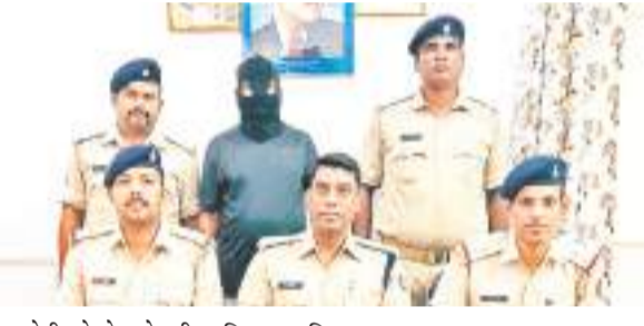
आरोपी को जेल भेजती आदित्यपुर पुलिस।