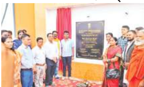
स्कूल का उद्घाटन के मौके पर उपस्थित विधायक व अन्य प्रतिनिधि।

● 17.50 करोड़ से विद्यालय का किया गया निर्माण