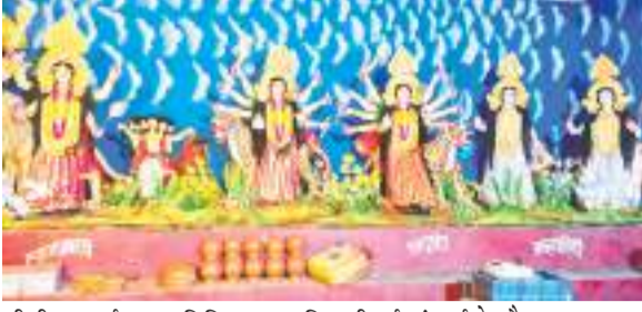
श्रीश्री नवदुर्गा पूजा समिति द्वारा स्थापित की गई मां दुर्गा के नौ रूप।

साल में इस नृत्य को 10 दिन ही किया जाता है। इसमें संताल समाज के पुरुष रंग-विरंगी साड़ियों को धोती जैसा पहनकर और बांह और माथे पर मोर का पंख लगाकर भुवांग, थाली,