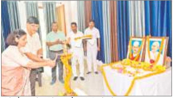
गांधी और शास्त्री जयंती पर उन्हें श्रद्धांजलि दी गई।