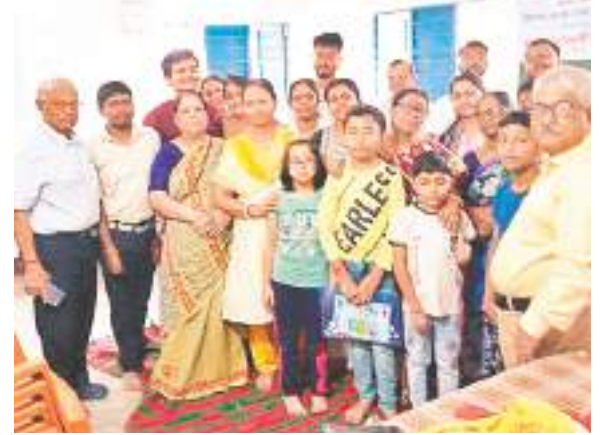
आपन जन के सदस्य एवं बांग्ला भाषा सीखने के इच्छुक बच्चे व महिलाएं.