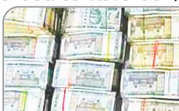
विरकुंडा में कार व बाइक से 4 लाख रुपए जब्त

झारखंड विधानसभा चुनाव को लेकर डीआईजी सुरेंद्र झा के निर्देश पर बोकारो और धनबाद में विशेष वाहन चेकिंग अभियान चलाया जा रहा है। इसी दौरान मंगलवार की देर रात पुलिस ने धनबाद-बोकारो सीमा पर एक इनोवा कार से 71.97 लाख नकद बरामद किया है। तेलमोचो दामोदर पुल के निर्मित अंतर्जिला चेक नाका के पास से यह कैश बरामद हुआ है। इनकम टैक्स (आईटी) की टीम भी मौके पर पहुंचकर जांच कर रही है। पुलिस बैरिकेडिंग लगाकर पकड़ा: इस संबंध में बताया जा रहा है कि मंगलवार की देर रात तेलमोचो स्थित अंतर्जिला चेकनाका पर सघन जांच अभियान चलाया जा रहा था। इसी दौरान बोकारो से धनबाद जा रही इनोवा कार (कार संख्या जे एच 10 बी वार्ड - 9655) जैसे ही तेलमोचो चेक नाका के समीप पहुंची, पुलिस को देखकर चालक ने कार घुमाकर भागने लगा। इनोवा को भागते देख पुलिस ने तत्काल बैरिकेडिंग लगाकर उसे पकड़ा। पुलिस ने कार कार की जांच की तो ड्रिक्की समेत अन्य जगहों से भारी मात्रा में कैश बरामद किया। कार्रवाई के दौरान पुलिस ने कार सवार लोगों