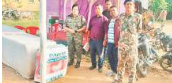
चेकपोस्ट के समीप बरामद गांजा के साथ एसडीपीओ व अन्य।