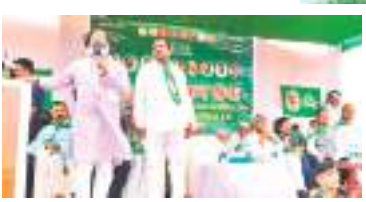
घाटशिला में चुनावी सभा को संबोधित करते सीएम हेमंत सोरेन।