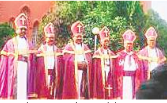
पास्टर्स रिफ्रेशर क्लास कम मिनिस्ट्रीयम मीटिंग में मौजूद पास्टर्स एवं बिशप.