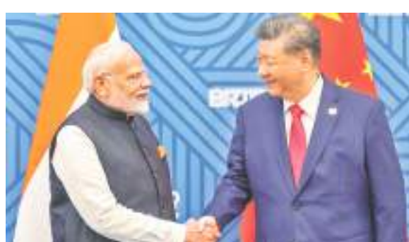
कजान में चीन के राष्ट्रपति शी जिनपिंग से मिलते पीएम नरेंद्र मोदी.

पीएम नरेंद्र मोदी और चीनी राष्ट्रपति शी जिनपिंग ने बुधवार को रूस में ब्रिक्स शिखर सम्मेलन के दौरान अपनी पहली द्विपक्षीय बैठक की, जो पिछले पांच सालों बाद हुई है। ये बैठक करीब 50 मिनट तक चली है। यह बैठक उस वक्त हुई है, जब भारत और चीन ने देवसांग मैदानी क्षेत्र और डोमचक क्षेत्र में एक-दूसरे को गश्त करने के अधिकार बहाल करने पर सहमति जताई है। यह पूर्वी लद्दाख में एलएसी के संघर्ष को सुलझाने की कोशिशों को दिखाता है। द्विपक्षीय बैठक के दौरान प्रधानमंत्री नरेंद्र मोदी ने कहा, वैश्विक शांति और स्थिरता के लिए हमारी बैठक अहम है। सीमा पर सहमति का स्वागत है। मुझे