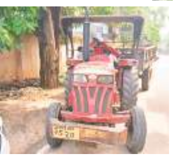
सफाई अभियान में गलियों के कचरे उटाने में लगा निगम का ट्रैक्टर.