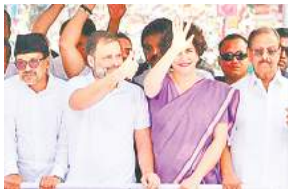
वायनाड में रोड-शो करती प्रियंका गांधी. साथ में राहुल गांधी भी मौजूद रहे.

यह मेरी नई शुरुआत है : प्रियंका गांधी ने एक जनसभा को संबोधित करते हुए कहा, मैं पहली बार 35 साल में अपने लिए सपोर्ट मांगने आई हूं। मुझे मौका दीजिए, मेरी जिम्मेदारी है। आपको पहचान दिलाने की। आपका मैं सभी ने आप का बहुत साथ दिया है। मैं आपके परिवार का सदस्य बनने आई हूं। मेरे भाई ने 8 हजार किलोमीटर पैदल यात्रा की है। ये