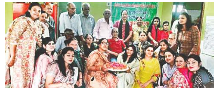
ओल्ड एज होम में दीपावली मिलन समारोह में शामिल सृजन शाखा की सदस्याएं.

दीपावली के उपलक्ष्य में अखिल भारतीय मारवाड़ी महिला सम्मेलन की सृजन शाखा की ओर से ओल्ड एज होम बुद्धश्रम बरियातु रोड में बुधवार को दीपावली मिलन समारोह का आयोजन किया गया। मौके पर सृजन शाखा की सभी बहनों ने एक पवित्र कार्य करते हुए वृद्ध आश्रम के सभी बड़े बुजुर्गों से आशीर्वाद लिया तथा अपने अपने घरों से लाया हुआ भोजन उनको परोसा तथा साथ में भोजन किया। साथ ही दिये जलाकर सबों के साथ रोशनी की खुशियां बिखेरीं। सृजन शाखा के सदस्यों ने कहा कि दिवाली के पावन पर्व से पहले यह अवसर हमारे लिए एक अतिमक सुख का अनुभव बन गया। हम सभी एक छोटी सी कोशिश से उन्हें एक अहसास