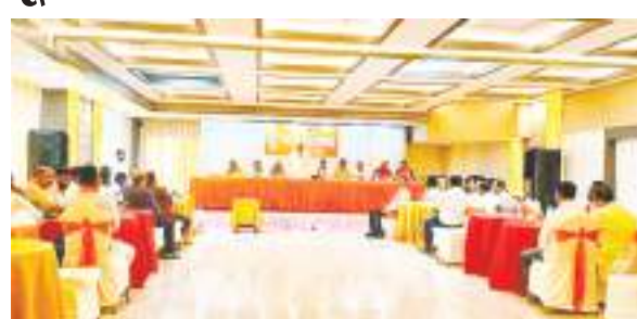
विहिप की झारखंड प्रांतीय कार्यकारिणी की बैठक में शामिल सदस्य.

विहप हिंदू परिषद की झारखण्ड प्रांत कार्यकारिणी की एक दिवसीय बैठक स्टेशन रोड स्थित होटल ग्रीन होरिजन में की आयोजित की गई। बैठक में विगत माहों में संपन्न हुए कार्यक्रमों की समीक्षा की गई। साथ ही आगामी कार्यक्रमों की योजना बनाई गई। बैठक में 9 नवंबर को गोपाष्टमी तथा 15 दिसंबर से 31 दिसंबर तक धर्मरक्षा दिवस कार्यक्रम करने का निर्णय लिया गया।