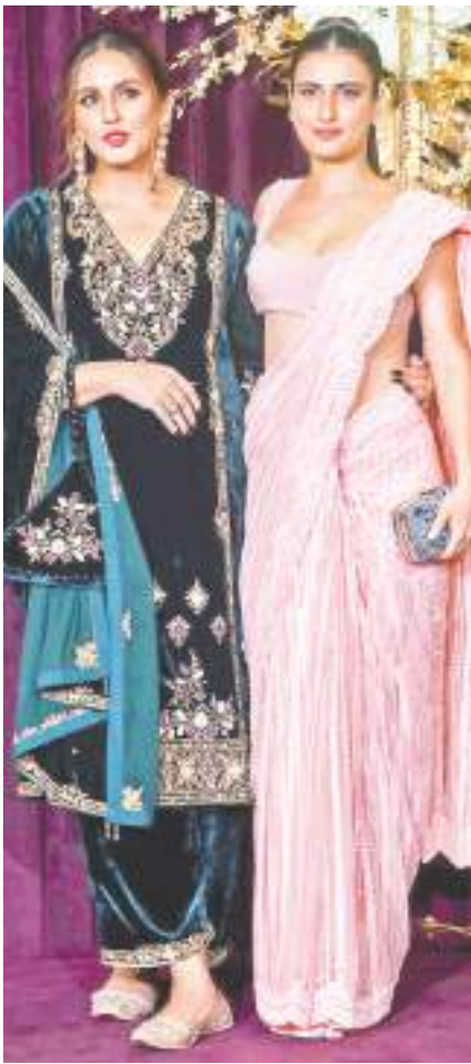
मुंबई में मशहूर डिजाइनर मनीष मल्होत्रा ने दीवाली की पार्टी दी थी। पार्टी में बड़े-बड़े सेलेब्रिटी शामिल हुए। शिल्पा शेट्टी बहन शमिता शेट्टी के साथ नजर आईं। वहीं हुमा कुरैशी और फातिमा सना शेख साथ नजर आईं।