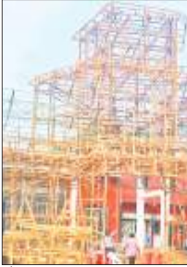
चौपारण का दुर्गा पूजा पंडाल