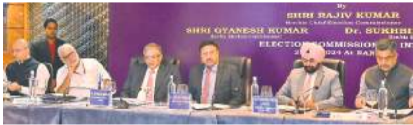
रांची के होटल रेडिशन ब्लू में पदाधिकारियों के साथ बैठक करती भारत निर्वाचन आयोग की टीम.

राजनीतिक दलों के मुद्दों पर आयोग ने किया आश्रय : सोमवार को राजनीतिक दलों ने जूटि रहित मतदाता सूची बनाने और स्वतंत्र एवं निष्पक्ष मतदान सुनिश्चित करने का अनुरोध किया था. साथ ही कई मुद्दों को भी उठाया था, जिसपर आयोग ने प्रतिनिधियों को आश्रय दिया कि उनके मुद्दों के साथ भात निर्वाचन आयोग राज्य में स्वतंत्र, निष्पक्ष, सहभागी, समावेशी, शांतिपूर्ण और प्रलोभनमुक्त चुनाव कराएगा. आयोग ने जिला निर्वाचन अधिकारियों को विशेष रूप से कहा है कि वे सभी राजनीतिक दलों के लिए समान रूप से सुलभ रहें तथा समग्र-समग्र पर बैठक कर नियमित रूप से उनसे मिलने के अलावा उनकी शिकायतों का शीघ्र समाधान सुनिश्चित करें.