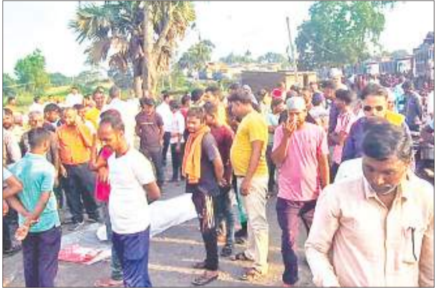
बाइक सवार युवक की हादसे में मौत के विरोध में सड़क जाम करते लोग।

जानकारी के अनुसार मृतक टीवीएस क्रेडिट नामक कंपनी में लोन रिक्वेर एजेंट का काम करता था। घटना के बाद आक्रोशित लोगों ने आप्रपाली एक नंबर गेट को जाम कर दिया, जिससे आप्रपाली से कोयले की लुलाई ठप हो गई। सड़क जाम कर रहे लोगों ने नो एंट्री, मृतक के आश्रित को 25 लाख मुआवजा, मृतक की पत्नी को नौकरी, इंटी गेट पर गार्ड की व्यवस्था एवं सीसीटीवी