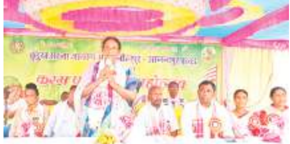
कार्यक्रम के दौरान संबोधित करती संसद जोबा माझी.