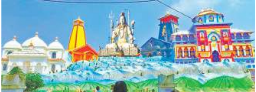
चक्रधरपुर के शीतला मंदिर दुर्गा पूजा कमेटी के पंडाल की ऐसी होगी आकृति.

शारदीय नवरात्र दुर्गा पूजा को लेकर तैयारियां शुरू कर दी गई हैं। चक्रधरपुर में धूमधाम के साथ दुर्गा पूजा का त्योहार मनाया जाता है। चक्रधरपुर में लगभग दो दर्जन स्थानों पर पंडाल का निर्माण कर माता दुर्गा की प्रतिमा स्थापित की जाती है। इसमें चक्रधरपुर शहर के शीतला मंदिर दुर्गा पूजा समिति की ओर से प्रत्येक वर्ष आकर्षक दुर्गा पूजा पंडाल का निर्माण कराया जाता है, जो पूरे जिले भर में विख्यात रहता है। इस वर्ष पर भी शीतला मंदिर दुर्गा पूजा समिति पूजा पंडाल का निर्माण लगभग 20 दिन पहले से शुरू कर दिया गया है। समिति की ओर से उत्तराखंड के