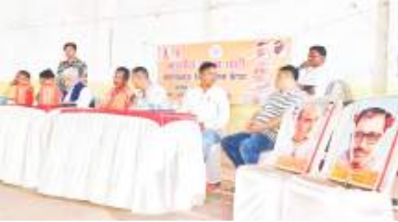
वोटिंग के दौरान उपस्थित पलामू के सांसद बीडी राम व अन्य भाजपा नेता.