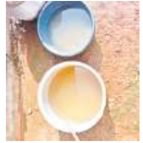
छोटानागरा पंचायत के गांवों में सप्लाई का दूषित पानी.

इसी से नाराज होकर सभी गांवों के ग्रामीण 12 सितंबर की सुबह लगभग पांच बजे से छोटानागरा थाना अन्तर्गत बाईहातु गांव के समीप मुख्य सड़क अनिश्चितकालीन जाम करेगे। सड़क जाम के डर से 11 सितंबर को