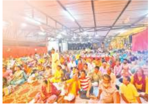
चांडिल के मुनका धर्मशाला में श्रीमद्भागवत गीता की कथा सुनते श्रद्धालु.