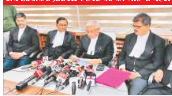
हाईकोर्ट के सभागार में विचार रखते महाधिवक्ता.