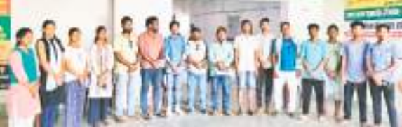
चाईबासा में आयोजित बैठक में शामिल महासभा के पदाधिकारी और सदस्य.