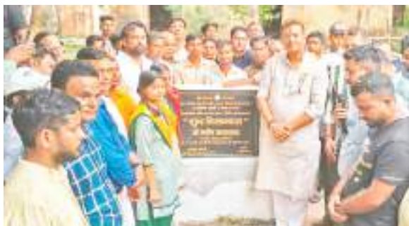
विकास योजना का शिलान्यास करते सांसद मनीष जायसवाल.

क्षेत्रीय सांसद मनीष जायसवाल क्षेत्र की समस्याओं और विकास योजनाओं को लेकर खीते दो दिन से राजधानी दिल्ली में थे. दिल्ली से लौटने के क्रम में शुक्रवार को उन्होंने रामगढ़ जिले के कई क्षेत्रों का सघन दौरा किया और क्षेत्र के विकास के लिए करीब पांच करोड़ रुपये से अधिक की राशि की योजनाओं की आधारशिला रखी. उन्होंने रामगढ़ शहर के बिजुलिया तालाब रोड स्थित अशोकब्रह्म धर्मशाला के उन्नयन कार्य का शिलान्यास और वार्ड संख्या 8 स्थित पटेल धर्मशाला में विवाह भवन निर्माण