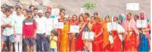
सैकड़ों की संख्या में पहुंचे थे ग्रामीण.