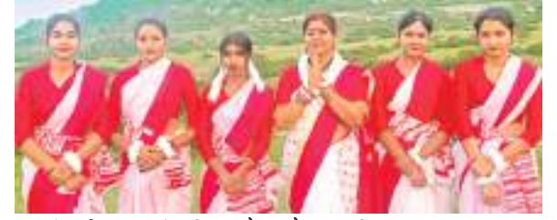
झारखंड की समृद्ध सांस्कृतिक धरोहर को बढ़ावा दिया जाएगा.

अलग-अलग प्रतियोगिता के विजेताओं के लिए कैश प्राइज, रजिस्ट्रेशन फ्री