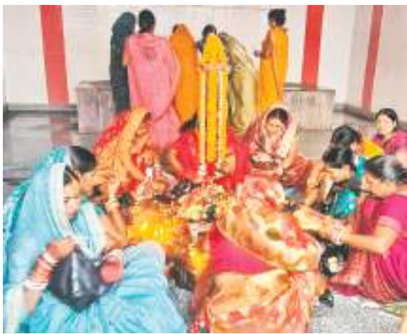
भगवान शिव-पार्वती की आराधना करती सुहागिनें.

शिव पुराण में लिखित एक कथानुसार इस पवित्र हरतालिका तीज व्रत को सबसे पहले राजा हिमवान की पुत्री माता पार्वती ने