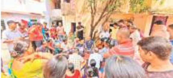
आदित्यपुर में आवास बोर्ड के फैसले के खिलाफ बैठक करते प्लैटवासी।

सभी ने एकजुट होकर कहा कि हाउसिंग बोर्ड द्वारा जनता प्लैट में रह रहे लोगों को बिना विश्वास में लिए पुनर्निर्माण की योजना के तहत सर्वे करवाया जा रहा है, जनता प्लैटवासी पुनर्निर्माण नहीं चाहते हैं। सभी का कहना है कि पिछले कई वर्षों से वे लोग प्लैट की मरम्मत करवा कर रह