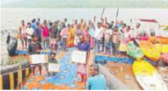
नौका परिचालन के स्थान पर खड़े होकर विरोध करते ग्राम प्रधान एवं ग्रामीण।

ग्रामीणों ने बताया कि 24 सितंबर को बंदोबस्ती रद करने के संबंध में