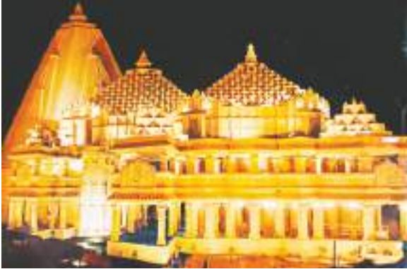
एस टाइप दुर्गा पूजा पंडाल में बनने वाले सोमनाथ मंदिर की आकृति।

सोमनाथ मंदिर की तरह बनाया जा रहा एस टाइप दुर्गा पंडाल एस टाइप दुर्गा पंडाल के निर्माण उद्घाटन की तिथि को देखते हुए जोर-शोर से किया जा रहा है। बता दें