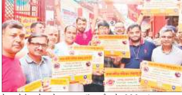
देवघर में बैनर-पोस्टर के साथ बाबा मंदिर व चैबर के प्रतिनिधि एवं अन्य.

बाबा बैद्यनाथ मंदिर परिसर और इसके 91 मीटर के दायरे में तंबाकू मुक्त क्षेत्र बनाने को लेकर एम्स देवघर ने पहल की है. एम्स के वाइटल स्ट्रेटिज तंबाकू कंट्रोल प्रोजेक्ट के मुख्य अन्वेषक और एम्स देवघर के निदेशक प्रो डॉ सौरभ वाण्योय ने इसके लिए क्रमबद्ध अभियान चलाने की योजना बनाई है. उन्होंने संस्थालपराना चैबर ऑफ कॉमर्स एंड इंडस्ट्रीज देवघर, आईएमए देवघर, पंडा धर्मरक्षिणी सभा देवघर, बाबा मंदिर प्रशासन, देवघर नगर निगम एवं स्वास्थ्य विभाग देवघर के साथ मिलकर बाबा मंदिर को तंबाकू मुक्त क्षेत्र बनाने के लिए काम शुरू कर दिया है.