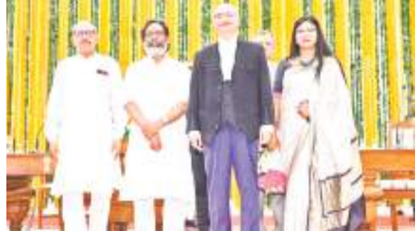
शपथ लेने के बाद सीएम और विस अध्यक्ष के साथ चीफ जस्टिस.