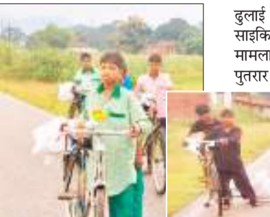
उपलब्ध कराई गई किताब को मजदूरों से ढुलाई नहीं कराकर नौनिहालों से साइकिल द्वारा ढुलाई करए जाने का मामला प्रकाश में आया है।

विभाग और विद्यालय में कार्यरत शिक्षकों को लापरवाही से बच्चों का भविष्य अंधकारमय दिखाई दे रहा है। यहां पर बुधवार को बच्चों को बेहतर शिक्षा मिले इसकी परवाह किए बिना नौनिहालों से साइकिल से सरकार की ओर से स्कूलों में उपलब्ध कराई गई किताबों को मजदूरों की तरह ढुलाई कराया जा रहा था। इससे यह स्पष्ट प्रतीत होता है कि नौनिहालों के भविष्य के साथ स्कूल प्रबंधन और विभाग खिलवाड़ करने का कार्य कर रही है। यहां पर बता दें कि पेशारार प्रखंड क्षेत्र अंतर्गत राजकीय उत्कर्मित मध्य विद्यालय जवाखाड़ में राजकीय उत्कर्मित मध्य विद्यालय पुतरार व अन्य स्कूलों में पढ़ने वाले बच्चों के बीच वितरित किए जाने हेतु