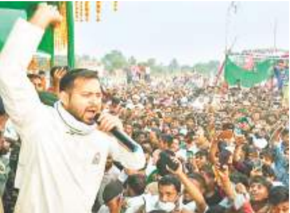
समस्तीपुर में संबोधित करते तेजस्वी यादव.

बिहार में विपक्ष के नेता और प्रदेश के पूर्व उपमुख्यमंत्री तेजस्वी यादव ने मंगलवार को समस्तीपुर से 'कार्यकर्ता आभार यात्रा' की शुरुआत कर दी है. इस यात्रा के दौरान तेजस्वी सीधे कार्यकर्ताओं से रूबरू होंगे और अगले साल होने वाले विधानसभा चुनाव को लेकर मंथन करेंगे. कार्यक्रम का पहला चरण 10 सितंबर से 17 सितंबर तक चलेगा. इस दौरान तेजस्वी यादव समस्तीपुर, दरभंगा, मधुबनी और मुजफ्फरपुर में पार्टी के नेताओं और कार्यकर्ताओं के साथ संवाद करेंगे. कार्यकर्ता संवाद कार्यक्रम के दौरान तेजस्वी अपने 17 महाने के कार्यक्रम की उपलब्धियों के बारे में पार्टी के नेताओं और कार्यकर्ताओं को जानकारी देंगे, ताकि कार्यकर्ता राजद के कामों की उपलब्धियां जनता तक पहुंचा सकें.तेजस्वी यादव कार्यकर्ताओं में उत्साह भी भरेंगे. कार्यकर्ता आभार यात्रा' के दौरान वे बिहार की गिरदी कानून व्यवस्था को भी उठावेंगे तथा सरकार को घेरने की कोशिश करेंगे. इस यात्रा का मकसद संगठन को मजबूत बनाने के साथ-साथ कार्यकर्ताओं से संवाद स्थापित करना और फीडबैक लेना है.