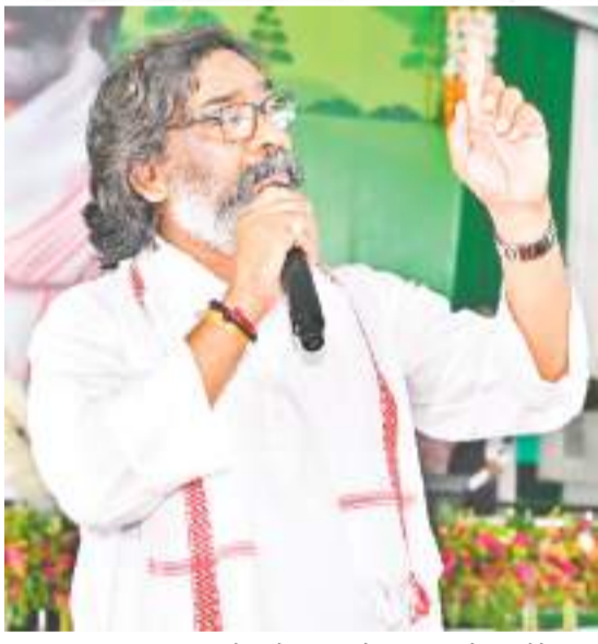
प्रमंडल स्तरीय कार्यक्रम को संबोधित करते मुख्यमंत्री हेमंत सोरेन.

1.36 लाख करोड़ बकाया के लिए दौड़ा रही केंद्र सरकार