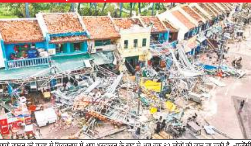
यागी तूफान की वजह से वियतनाम में आए भूस्खलन के बाद से अब तक 82 लोगों की जान जा चुकी है।