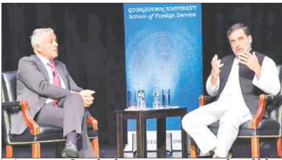
'जब भारत एक निष्पक्ष देश होगा तब हम आरक्षण खत्म करने पर सोचेंगे'

अमेरिका के तीन दिवसीय दौरे पर कांग्रेस नेता राहुल गांधी कई मुद्दों पर विस्तार से बात कर रहे हैं। उनके बयानों पर भारत में सियासी घमासान जारी है। इसी कड़ी में उन्होंने जॉर्जटाउन यूनिवर्सिटी के विद्यार्थियों के साथ भी संवाद किया। अभी तक लोकसभा में नेता प्रतिपक्ष अपने संबोधन में राष्ट्रीय स्वयंसेवक संघ (आरएसएस), भारतीय जनता पार्टी (भाजपा), प्रधानमंत्री नरेंद्र मोदी और बेराजगारी पर बात कर रहे थे, लेकिन अब अपने बयान में उन्होंने चुनाव आयोग को भी निशाने पर ले लिया। इसके साथ ही उन्होंने आरक्षण और अल्पसंख्यकों को लेकर भी बयान दिया, जिसको लेकर उन पर विपक्षी दलों ने निशाना साधा।