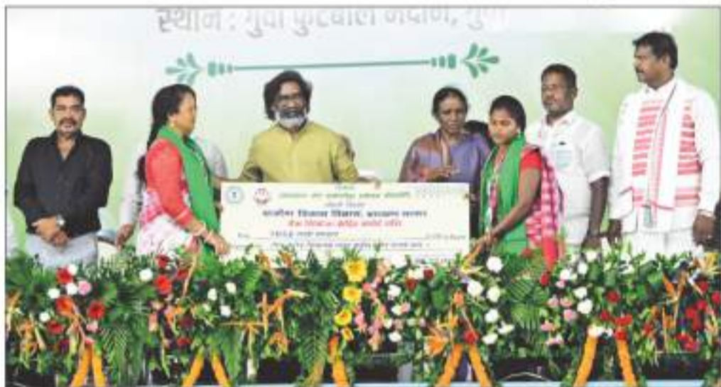
मुख्यमंत्री ने पद्मिनी सिंहभूम में कार्यक्रम के दौरान सखी मंडल को 30 करोड़ रुपये से अधिक का बैंक लिंकेज से जोड़ा

ग्रामीण महिलाओं के उत्थान और उनके आर्थिक स्वावलंबन के प्रति संवेदनशील मुख्यमंत्री हेमन्त सोरेन के विजयवादी सोच का परिणाम है कि 2019 से पूर्व सखी मंडल को जितना क्रेडिट लिंकेज दिया गया, उसका 10 गुना क्रेडिट लिंकेज विगत साढ़े चार वर्ष में सखी मंडल की दीर्घ-बहनों को मिला। यही नहीं, सखी मंडल की संख्या में भी बढ़ोतरी दर्ज की गई है। वर्ष 2013 से 2019 तक स्वयं सहायता समूह को क्रेडिट लिंकेज के तहत ₹1,114 करोड़ की राशि दी गई, जबकि 2019 के बाद 30 जून 2024 तक ₹10,111 करोड़ की राशि सखी मंडल की महिलाओं को सशक्तिकरण हेतु दी गई। वहीं 2013 से 2019 तक 2.45 लाख सखी मंडल की संख्या बढ़कर 30 जून 2024 तक 2.88 लाख हो गई।