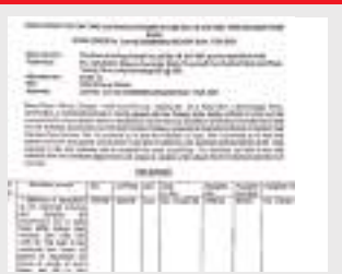
गुआ रेलवे साइडिंग का 5-6 लाईन की सफाई हेतु रेलवे द्वारा जारी पत्र.

बेच दिया गया है. इसी तरह बड़ाजामदा रेलवे साइडिंग की लाइन सफाई के नाम पर भी अब तक हजारों टन लौह अयस्क जिसका ग्रेड 55-58 के आसपास था, उसे बेचा गया है. सूत्र बताते हैं कि लगभग तीन फीट के आसपास