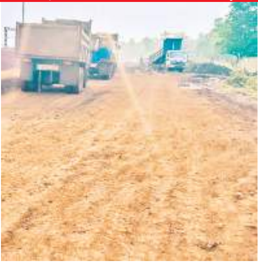
बड़ाजामदा रेलवे साइडिंग की तस्करी.