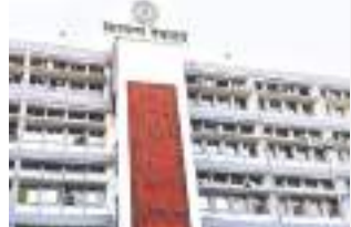
झारखंड फाइनांस सबऑर्डिनेट सर्विस के अकाउंट कैडर के तहत किया गया है। इसके लिए प्रोजेक्ट भवन कोषागार और डोरंडा कोषागार

साइबर ट्रेजरी के लिए पदों का सृजन : एसएनए स्पर्श और साइबर ट्रेजरी में लेखा अधीक्षक के दो, वरीय लेखा सहायक के दो और लेखा सहायक के चार पदों का सृजन