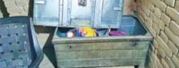
आखिर ऐसा कब तक चलेगा. कब तक गांव में पहरेदारी की जाएगी. पहरेदारी कर रहे युवकों की टोली क्या फिर से चैन का नींद सो पाएंगे.

अक्षय चौबे । तोपंचाची के ग्रामीण इलाकों में चोर ने ग्रामीणों के नींद को चोरी कर ली है. ग्रामीण गांव में पूरी रात जाग कर करीब 20 दिनों से पहरेदारी कर रहे हैं. गांव में अब रातों में युवकों की टोली से खबरदार सावधान, जागते रहो, की आवाज सुनाई देगी. इस टोली के युवकों की रात जागने के कारण पूरी दिनचर्या खराब हो रही है. कई सुबह उठकर काम में भी नहीं जा रहे हैं.