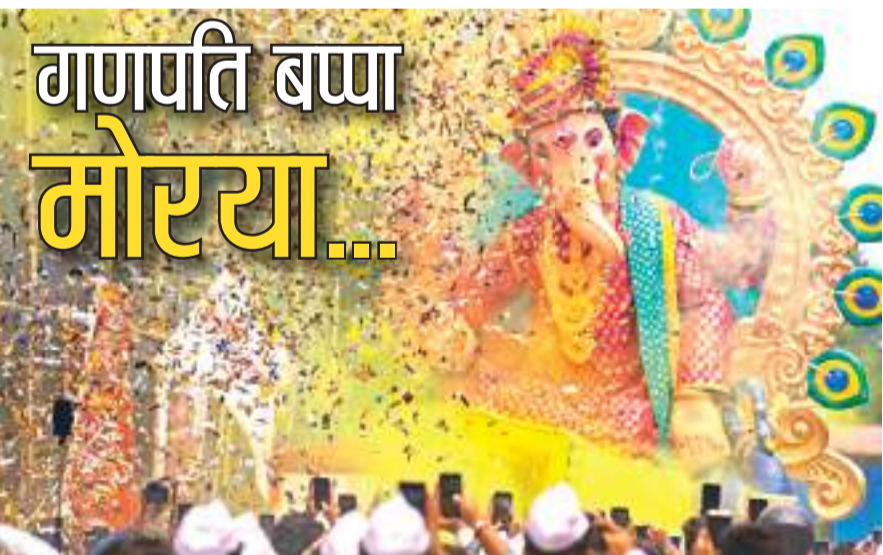
मुंबई में गणेश चतुर्थी उत्सव से पहले भगवान गणेश की मूर्ति को पंडाल में ले जाते भक्त।