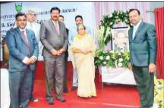
एनयूसआरएल के व्याख्यान के मौके पर जस्टिस भूषण रामकृष्ण गवई व अन्य।