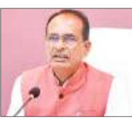
चुनाव पर भी मंथन किया। चौहान ने मंचे कहा कि झारखंड में हेमंत सोरेन के नेतृत्व वाली गठबंधन सरकार ने राज्य को बर्बाद कर दिया है, और हर जगह अराजकता है। उन्होंने आरोप लगाया, राजनेताओं और नौकरशाहों के यहां से (जबकि एजेंसियों द्वारा छापेमारी में) नोटों के

केंद्रीय मंत्री सह झारखंड भाजपा के चुनाव प्रभारी शिवराज सिंह चौहान ने कहा कि झारखंड में होने वाला विधानसभा चुनाव राज्य को बचाने के लिए है। यहां आदिवासियों की जमीन छीनी जा रही है। वे रविवार को ट्रेन से विदिशा रवाना होने से पहले मीडिया से बातचीत कर रहे थे। उन्होंने कहा कि इस बार झारखंड की जनता बीजेपी को वोट करने जा रही है। वर्तमान सरकार ने राज्य को पूरी तरह बर्बाद कर दिया है। रांची से रवाना होने से पहले उन्होंने बीजेपी नेताओं और कार्यकर्ताओं के साथ विधानसभा