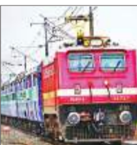
हैदराबाद -रक्सौल स्पेशल ट्रेन (वाया रांची) यात्रा प्रारंभ 12/10/2024 से 28/12/2024 तक प्रत्येक शनिवार को हैदराबाद से प्रस्थान करेगी। ट्रेन संख्या 07052

रेलवे ने दशहरा, दिवाली और छठ पर्व के मौके पर ट्रेनों में अतिरिक्त थ्रीड की संभावना को देखते हुए यात्रियों की सुविधा के लिए रांची रेल मंडल से होकर चलने वाली चार ट्रेनों का अवधि विस्तार किया है। ट्रेन संख्या 07051/07052 हैदराबाद - रक्सौल सिक्ंदराबाद स्पेशल और ट्रेन संख्या 07005/07006 सिक्ंदराबाद - रक्सौल-सिक्ंदराबाद स्पेशल वाया रांची के परिचालन अवधि में 2 जनवरी तक विस्तार किया गया है। ट्रेन संख्या 07051