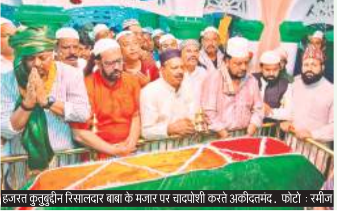
हजरत कुतुबुद्दीन रिसालदार बाबा के मजार पर चादपोशी करते अकीदतमंद.