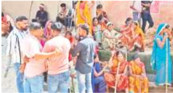
बड़कागांव में ठाकुर मुहल्ला में लाठी के साथ मौजूद महिलाएं व पुरुष और इलाके में कैप करते सुरक्षा बल के जवान।

हालांकि, पुलिस बल के कैप करने के बाद भी गुरुवार की सुबह एक बार फिर पुलिस की मौजूदगी में ही पत्थरबाजी की गई। इससे तनाव की स्थिति बनी हुई है। हालांकि, पुलिस-प्रशासन के वरीय अधिकारी मौके पर पहुंच कर हालात पर नजर बनाए हुए हैं। जानकारी के मुताबिक, बुधवार की रात बड़कागांव प्रखंड में राणा मोहल्ला से विश्वकर्मा पूजा के बाद लोग मूर्ति विसर्जन करने जा रहे थे। इसी दौरान उनका दूसरे पक्ष के लोगों के साथ विवाद हो गया। देखते ही देखते विवाद बढ़ गया और दोनों पक्षों के बीच जमकर पत्थरबाजी हुई।