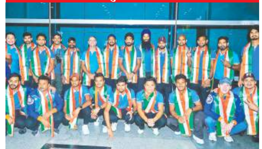
हॉकी की एशियन चैंपियनशिप ट्राफी जीतकर चीन से भारत लौटी टीम इंडिया, जहां उनका स्वागत हुआ।