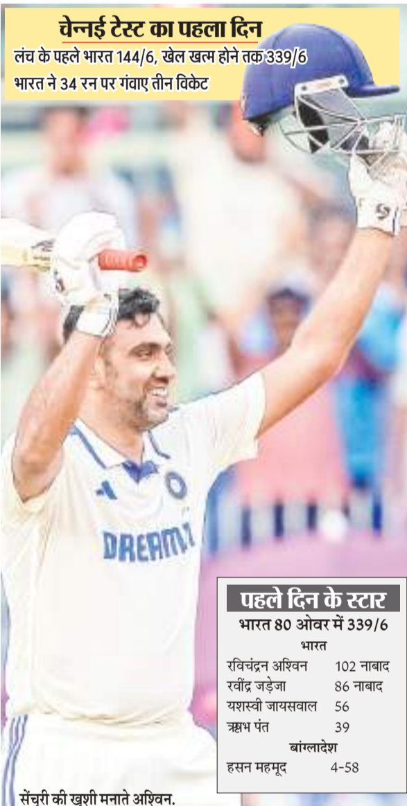
वेनई टेस्ट का पहला दिन लंच के पहले भारत 144/6, खेल खत्म होने तक 339/6 भारत ने 34 रन पर गंवार तीन विकेट

एजेंसी। चेन्नई भारत और बांग्लादेश के बीच दो मैचों की टेस्ट सीरीज गुरुवार को शुरू हुई। बांग्लादेश के कप्तान नजमुल हसन शांतो ने टॉस जीता और पहले फील्डिंग करना तय किया। उनका यह फैसला शुरुआत में रंग लाया और बांग्लादेशी बॉलर्स ने भारत के तीन विकेट 34 रन के भीतर झटक लिए। रोहित शर्मा और विराट कोहली 6-6 रन बनाकर आउट हुए तो शुभमन गिल का खाता भी नहीं खुला। ये तीनों ही विकेट हसन महमूद ने लिए, लेकिन चेन्नई की जिस पिच पर रोहित शर्मा, विराट कोहली, शुभमन गिल वगैरह फेल हो गए, उस पर अश्विन और जडेजा ने बॉलर्स को ऐसी पिटाई की जो बरसों याद रहने वाली है। खासकर बांग्लादेश की टीम और फैंस अपने गेदबाजों की बुरी गत लंबे समय तक याद रखने वाले हैं। बांग्लादेश ने एक समय भारत के 6 विकेट 144 रन पर झटक लिए थे। तब लग रहा था कि भारत 200 रन तक भी शायद ही पहुंचे। लेकिन ऑलराउंडर रविचंद्रन अश्विन और रविंद्र जडेजा ने 195 रन की पार्टनरशिप कर सारा नजारा बदल दिया। जब दिन का खेल खत्म हुआ तो भारत 6 विकेट पर 339 रन बनाकर मजबूती से डटा हुआ था।