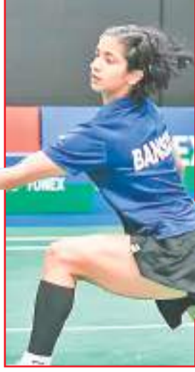
में लगातार सुधार और कड़ी मेहनत हराने के करीब पहुंच चुकी हैं।

कहा, यह मेरे जीवन की अब तक की सबसे बड़ी उपलब्धि है। मैंने क्वार्टर फाइनल में पहुंचने का सपना देखा था। अब मैं यहां हूँ, शीर्ष 8 में हूँ। यह एक शानदार एहसास है। एक चुनौतीपूर्ण मैच के बारे में बताते हुए मालविका ने कहा, मैच काटे की टक्कर का था, खासकर दूसरे और अंतिम गेम में प रिस्थिति कठिन थी, लेकिन मुझे खुशी है कि मैं मैच पर पकड़ बनाए रखने में कामयाब रही और मुझे जो समर्थन मिला, उसके लिए मैं आभारी हूँ। नागपुर में जन्मी इस खिलाड़ी ने अपनी सफलता का श्रेय अपने खेल