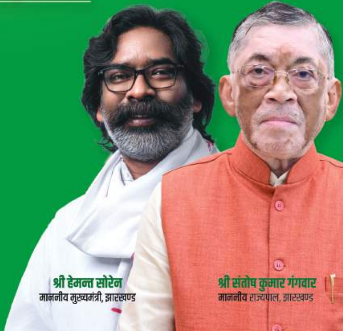
श्री हेमन्त सोरेन माननीय मुख्यमंत्री, झारखण्ड