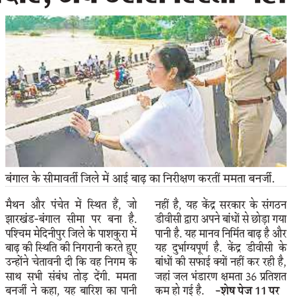
बंगाल के सीमावर्ती जिले में आई बाढ़ का निरीक्षण करतीं ममता बनर्जी.

एजेंसी। कोलकाता पश्चिम बंगाल की सीएम ममता बनर्जी ने गुरुवार को केंद्र सरकार पर निशाना साधा और राज्य में बाढ़ के लिए जिम्मेदार ठहराया. बंगाल सीएम ने दामोदर घाटी कॉरपोरेशन (डीवीसी) बांधों की ड्रेजिंग करने में केंद्र के विफल रहने का आरोप लगाया और कहा कि इसके परिणामस्वरूप पीछे से पानी छोड़ने के चलते राज्य के कई जिलों में बाढ़ आ गई. सीएम बनर्जी ने डीवीसी को मानव निर्मित बाढ़ के लिए जिम्मेदार ठहराया और कहा कि राज्य में स्थिति के पीछे एक साजिश है. डीवीसी बांध