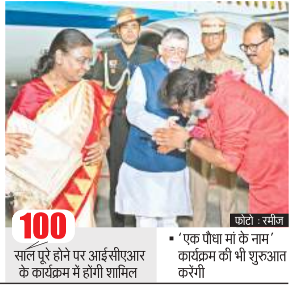
100 साल पूरे होने पर आईसीएआर के कार्यक्रम में होंगी शामिल

रांची। राष्ट्रपति द्रौपदी मुर्मू गुरुवार को शाम सात बजे रांची के बिरसा मुंडा एयरपोर्ट पहुंची. एयरपोर्ट पर राज्यपाल संतोष कुमार गंगवार, सीएम हेमंत सोरेन और केंद्रीय मंत्री शिवराज सिंह चौहान ने उनका स्वागत किया. एयरपोर्ट से राष्ट्रपति सीधे राजभवन पहुंची. वे रात्रि विश्राम राजभवन में करेंगी. बताते चलें कि राष्ट्रपति दो दिवसीय दौरे पर रांची पहुंची हैं. शुक्रवार को वे नामकुम स्थित आईसीएआर (नेशनल इंस्टीट्यूट ऑफ सेकेंडरी एग्रीकल्चर) के 100 साल पूरे होने के उपलक्ष्य में आयोजित कार्यक्रम में शिरकत करेंगी. साथ ही वहां 'एक पौधा मां के नाम' कार्यक्रम की भी शुरुआत करेंगी. इसके बाद वे दोपहर 12.30 बजे दिल्ली के रवाना हो जाएंगी. -शेष पेज 11 पर