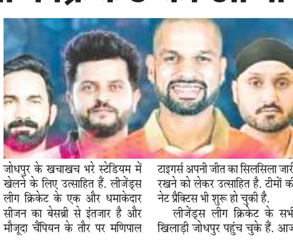
जोधपुर के खचाखच भरे स्टेडियम में खेले जाने के लिए उत्साहित हैं। लीजेंड्स लीग क्रिकेट के एक और धमाकेदार सीजन का बेसब्री से इंतजार है और मौजूदा चैंपियन के तौर पर मणिपाल टाइगर्स अपनी जीत का सिलसिला जारी रखने को लेकर उत्साहित हैं। टीमों की नेट प्रैक्टिस भी शुरू हो चुकी है। लीजेंड्स लीग क्रिकेट के सभी खिलाड़ी जोधपुर पहुंच चुके हैं। आज

एजेंसी। जोधपुर लीजेंड्स लीग क्रिकेट बरकतुल्लाह खान स्टेडियम में प्रतिस्पर्धी क्रिकेट की वापसी कर रहा है। 10 महीने के अंतराल के बाद 20 सितंबर को हरभजन सिंह की टीम मणिपाल टाइगर्स व इरफान पठान की टीम कोणार्क सूर्यास ओडिशा के बीच मुकाबले से होगा। बरकतुल्लाह खान स्टेडियम 20 से 26 सितंबर तक कुल छह मैचों की मेजबानी करेगा। मणिपाल टाइगर्स के कप्तान हरभजन सिंह ने कहा कि मणिपाल टाइगर्स की पूरी टीम और लीजेंड्स लीग क्रिकेट की अन्य टीमें