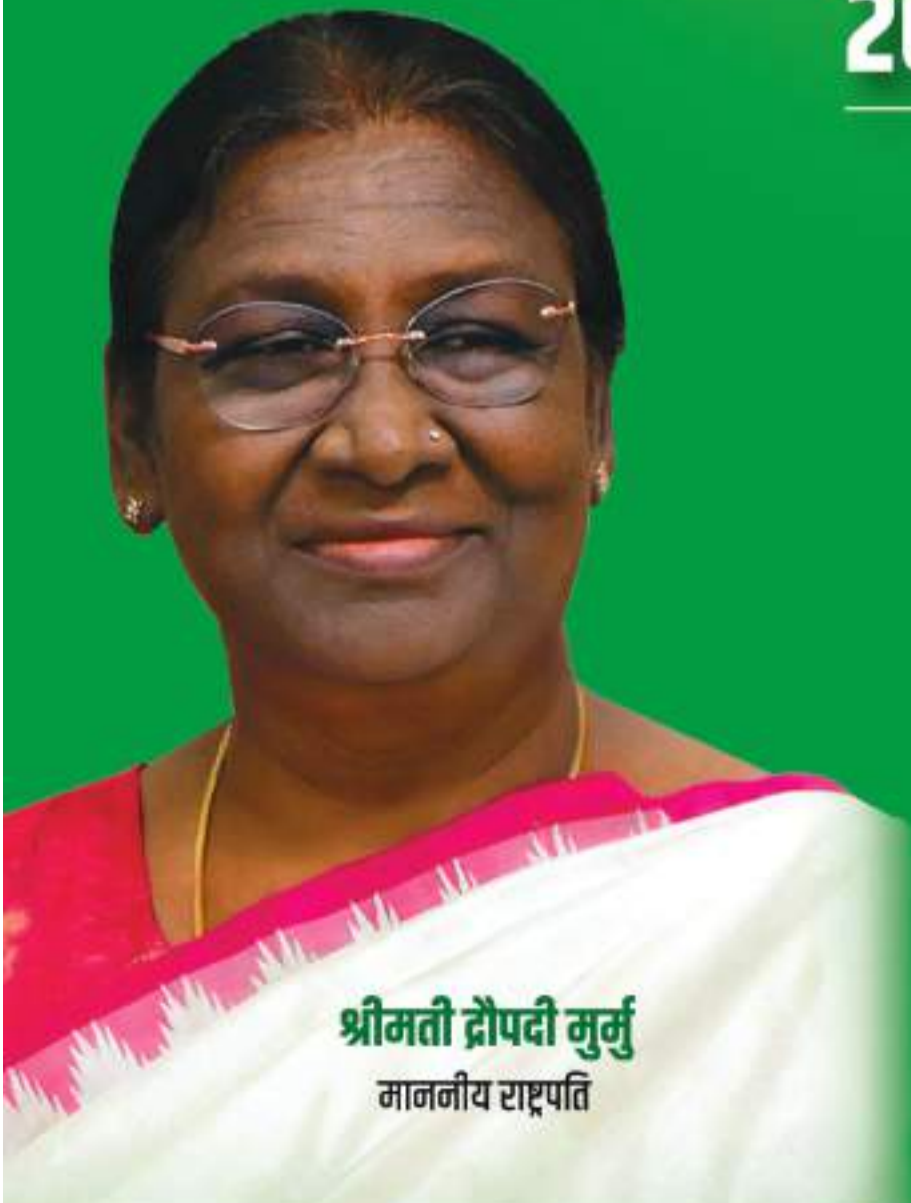
श्रीमती द्रौपदी मुर्मु माननीय राष्ट्रपति