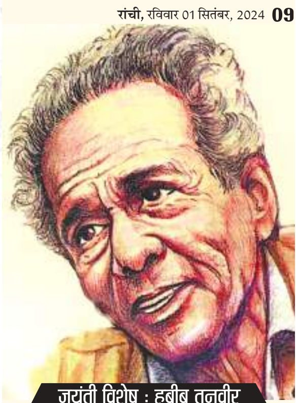
जयंती विशेष : हबीब तनवीर

17 अगस्त, 1982 को उनका देहावसान दिल्ली में हुआ। उनके निधन के बाद उनके आवास और निजी पुस्तकालय को डॉ. कामिल बुल्के शोध संस्थान के रूप में परिवर्तित कर दिया गया है।