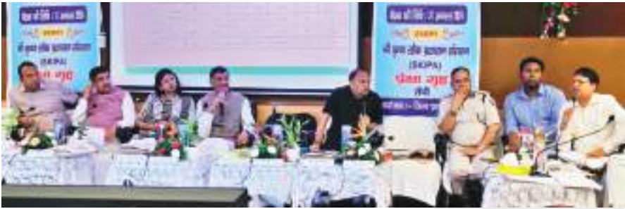
दिशा की बैठक में शामिल अतिथिगण एवं अधिकारी.

राज्य मनरेगा कर्मी संघ अपनी मांगों को लेकर आज 41वें दिन हड़ताल पर डटे हुए रहे. मनरेगा कर्मियों की हड़ताल के कारण मजदूरों को काफ़ी परेशानी हो रही है. संघ की ओर से ग्रामीण विकास मंत्री इरफान अंसारी के बयान का खंडन करती है. मंत्री ने मीडिया में जो बयान देकर मनरेगा कर्मियों को लगातार बरगलाने का प्रयास किया है. अपने बयान में मंत्री ने मनरेगा कर्मी को अपना भाई बताते हुए कहा था कि इनकी मानदेय बढ़ाती