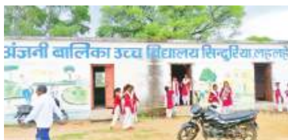
बालिका उच्च विद्यालय के परिसर में खेलते बच्चे .