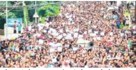
विरोध-प्रदर्शन में शामिल हुए हजारों कुकी-जो समुदाय के लोग.

एजेंसी। इफाल कुकी-जो समुदाय के लोगों ने अलग प्रशासन की अपनी मांग पर जोर देने के लिए शनिवार को मणिपुर में तीन रैलियां निकालीं और मुख्यमंत्री एन बीरेन सिंह के कथित ऑडियो क्लिप के खिलाफ विरोध प्रदर्शन किया, जिसमें कुछ आपत्तिजनक टिप्पणियों की गईं हैं. उन्होंने चुराचंदपुर जिले के लेइशांग, कांपोपकपी के केइथेलमन्बी और तेनौपाल के मोरेह में रैलियां निकालीं. चुराचंदपुर में रैली लेइशांग के एंग्लो कुकी वॉर गेट से शुरू हुई और छह किलोमीटर की दूरी तय करते हुए तुइबोरंग में 'पीस ग्राउंड' में समाप्त हुई. कुकी-जो