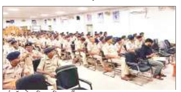
वर्कशॉप में शामिल पुलिसकर्मी।