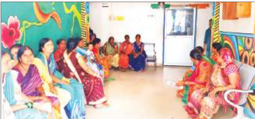
इंतजार में बैठी लाभुक।

महिलाओं को सशक्तिकरण एवं सम्मान को लेकर झारखंड सरकार द्वारा संचालित मुख्यमंत्री मंईयां सम्मान निधि योजना का फॉर्म दो दिनों से ऑनलाइन नहीं हो रहा है। जिस कारण लाभुकों में निराशा है। विदित हो कि 21 वर्ष से 49 वर्ष की महिला एवं युवतियों को मुख्यमंत्री मंईयां सम्मान निधि योजना के तहत प्रत्येक माह 1000 रूपए योग्य लाभुकों को खाते में देने की बात कही गई है। जिसके लिए 3 से 10 अगस्त तक योग्य लाभुकों को संबंधित मतदान केंद्रों पर सीएसपी संचालकों के द्वारा ऑनलाइन आवेदन अप्लाई किया जाना था। लेकिन अभी तक लाभुकों का एक भी आवेदन ऑनलाइन नहीं हो पाया है।