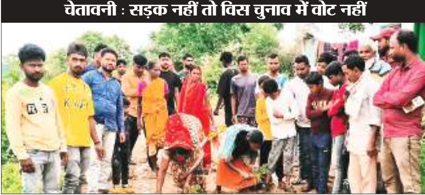
चेतावनी : सड़क नहीं तो विस चुनाव में वोट नहीं

सदर प्रखंड अंतर्गत ग्राम पंचायत हेसल नवा टोली से कुज्जी होते हुए कुड़, चंदवा और किस्को प्रखंड को जोड़ने वाली एकमात्र सड़क वर्षों से जर्जरावस्था है, जिसे बनवाने में किसी ने दिलचस्पी नहीं दिखाई है। ग्रामीणों ने सरकारी सिस्टम को लेकर काफी नाराज हैं। गांव वालों का कहना है कि कितने विधानसभा और लोकसभा चुनाव संपन्न हो गए लेकिन हेसल नवा टोली से कुज्जी सड़क की स्थिति जस का तस बना हुआ है। कितने बार इस सड़क का निर्माण कार्य कराए जाने हेतु लिखित आवेदन देकर गुहार भी लगाया जा चुका है फिर भी किसी की नजरें इस