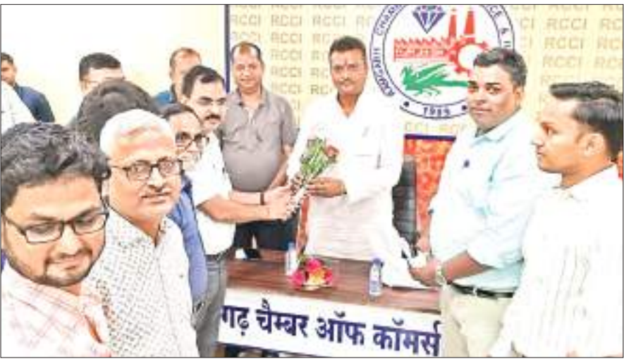
रामगढ़ पहुंचे क्षेत्रीय सांसद मनीष जायसवाल का स्वागत करते चैंबर ऑफ कॉमर्स के पदाधिकारी व सदस्य.

इसके बाद रामगढ़ चैंबर ऑफ कॉमर्स एंड इंडस्ट्रीज से जुड़े प्रबुद्ध जनों के साथ केंद्रीय बजट पर विशेष चर्चा पर चर्चा की. इससे पहले रामगढ़ पहुंचने पर सांसद मनीष जायसवाल ने ऐतिहासिक सुभाष चौक पर नेताजी सुभाष चंद्र बोस की