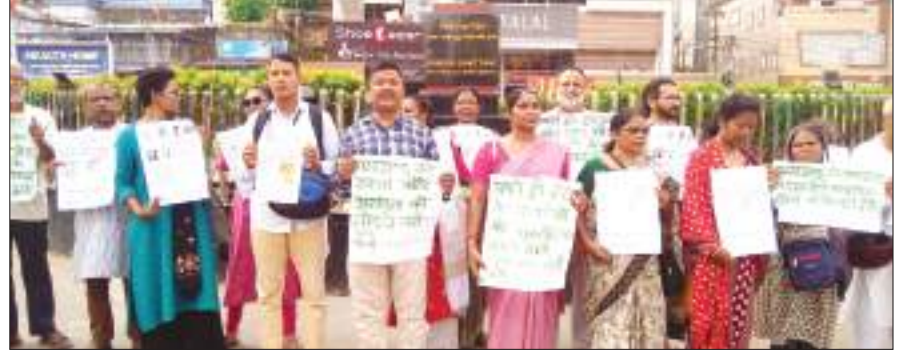
रांची में रविवार को विभिन्न संगठनों ने भाजपा की नीतियों के विरुद्ध पैदल मार्च किया।

हाल के दिनों में भाजपा नेताओं के बयान नफरत फैलाने वाला : इस दौरान कहा गया कि हाल में भाजपा व उसके प्रमुख नेता लगातार बयान दे रहे हैं कि झारखंड में बड़ी संख्या में बांग्लादेशी घुसपैठी आ रहे हैं। आदिवासियों की जनसंख्या कम हो रही है। आदिवासी लड़कियों से शादी कर रहे हैं, जमीन हथिया रहे हैं। लव जिहाद, लैंग जिहाद कर रहे हैं आदि। ऐसे भाषण देकर वे लगातार आदिवासियों व अन्य समुदायों में मुसलमानों के विरुद्ध नफरत फैलाने और विधान सभा चुनाव से पहले धार्मिक ध्रुवीकरण को कोशिश कर रहे हैं। भाजपा नेताओं द्वारा गलत आंकड़ों व झूठ के आधार पर