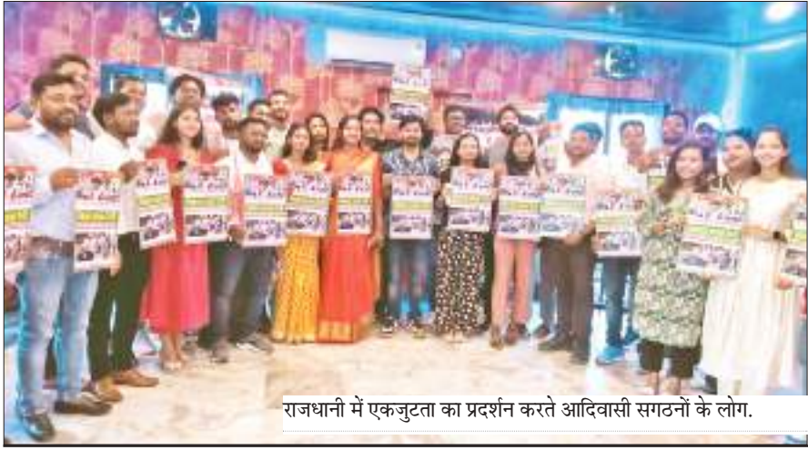
राजधानी में एकजुटता का प्रदर्शन करते आदिवासी संगठनों के लोग।