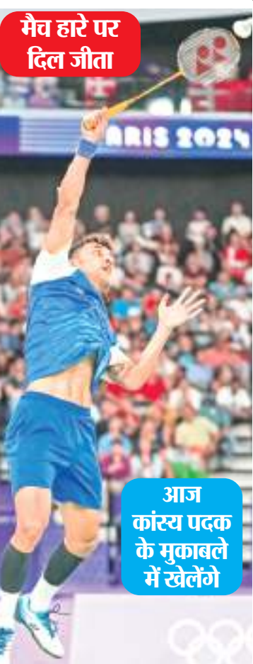
मैच हारे पर दिल जीता