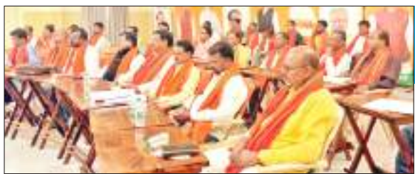
भाजपा एससी मोर्चा की बैठक में शामिल प्रतिनिधिगण।

भाजपा एससी मोर्चा के राष्ट्रीय महामंत्री सह झारखंड के प्रभारी भोला सिंह ने आगामी विधानसभा चुनाव को लेकर कार्य योजना झारखंड के सभी अनुसूचित जाति छात्रवास में जाकर छात्रों से मुलाकात कर उनकी सूची बनाने, प्रदेश के सभी सामान्य छात्रवास में भी एससी छात्रवास में जाकर सभी विधानसभा क्षेत्र के छात्रों से जुड़कर उनकी समस्याओं से रूबरू होना और पार्टी के नीति सिद्धांत के बारे में उन्हें जानकारी देते हुए भाजपा के साथ जोड़ने का निर्देश दिया गया है। इसके साथ ही प्रदेश के सभी बस्ती में जाकर अनुसूचित जाति के लोगों से उनकी बात सुनकर व उनकी समस्याओं से रूबरू होने का निर्देश दिया गया है। सिंह रविवार को भाजपा एससी मोर्चा की बैठक में बोल रहे थे। उन्होंने कहा कि सभी पदाधिकारियों को हर घर तिरंगा कार्यक्रम करने, मां के नाम से पेड़ लगाना, प्रदेश के सभी छात्रवास व कॉलेज में जाकर वृक्षारोपण करना,