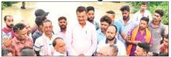
ग्रामीणों के साथ क्षेत्रीय सांसद मनीष जायसवाल ने स्थल का दौरा किया.