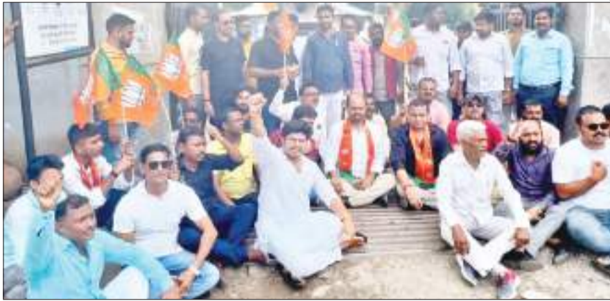
एमएमसीएच मुख्य गेट के बाहर प्रदर्शन करते भाजयुमो कार्यकर्ता।