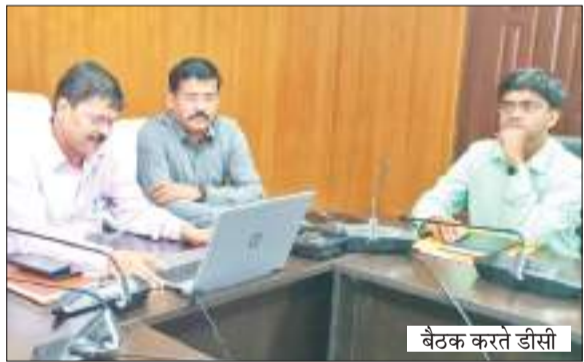
बैठक करते डीसी