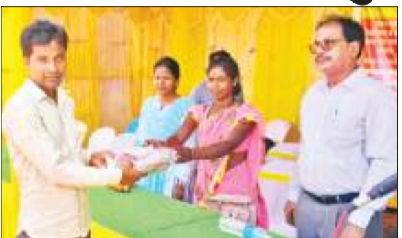
योजना का लाभ लेते लाभुक

आपकी योजना-आपकी सरकार-आपके द्वार कार्यक्रम अंतर्गत आज शनिवार को शिविर का दूसरे दिन रहा, जिसमें कुल 6 पंचायतों में शिविर आयोजित की गई, मुख्य सचिव झारखण्ड सरकार के निदेश पर सरकार की योजनाओं का लाभ इन शिविरों में दिया जा रहा है जिसमें मुख्य रूप से मुख्य प्रक्षेत्र के अंतर्गत जिन योजनाओं के आवेदन प्राथमिकता के आधार पर प्राप्त किये जा रहे हैं उनमें झारखंड मुख्यमंत्री मईयां सम्मान योजना, अबुआ स्वास्थ्य सुरक्षा योजना, अबुआ आवास योजना, मुख्यमंत्री पशुधन