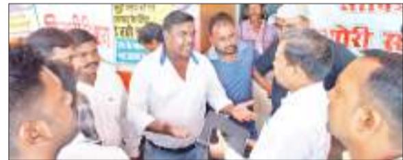
उग्र ग्रामीणों को समझाते पदाधिकारी व जनप्रतिनिधि।

जांब कार्ड वितरण के पांच और पेंशन स्वीकृति के 10 समेत अन्य योजनाओं के आवेदन शामिल थे। इस क्रम में लाभुकों के बीच कुल 39 लाख की परिसंपत्तियों का वितरण भी किया गया।