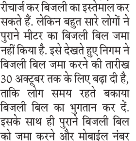
यह प्रीपेड मोड पर काम करेगा। आप जिस तरह पहले मोबाइल रिचार्ज करते थे, फिर इस्तेमाल करते हैं, उसी तरह बिजली उपभोक्ता पहले बिजली विभाग को पैसा देंगे, फिर बिजली का इस्तेमाल

करेंगे। आप जितने रुपये देंगे, उतने रुपये की बिजली का इस्तेमाल करेंगे। रिचार्ज खत्म होते ही बिजली का कनेक्शन खुद ही कट जाएगा। दुबारा रिचार्ज कराने पर कनेक्शन खुद ही चालू हो जाएगा।