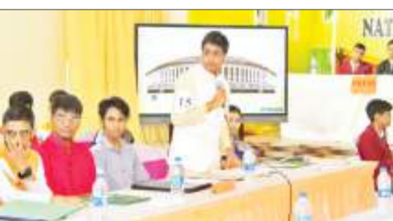
युवा संसद सभा में प्रतिभाग करते बच्चे।

स्थानीय ऑक्सफोर्ड पब्लिक स्कूल में शनिवार को युवा संसद सभा का आयोजन किया गया। सभा में महिला सर्वाधिकरण, खाद्य सुरक्षा, सूचना प्रौद्योगिकी, कोल और माईस संबंधी बहुविध विषयों पर चर्चा हुई। युवा संसद की बैठक में 60 सक्रिय छात्रों और संबंधित प्रभारी शिक्षकों की भागीदारी ने इसे सफल बनाया। सत्र में ऊर्जावान, अनुशासित और प्रभावशाली छात्रों को सामाजिक पेशेवर तथा शिष्टाचार की महत्वपूर्ण जानकारी दी। वक्तव्यों ने नये सदस्यों और मंत्रियों का परिचय,