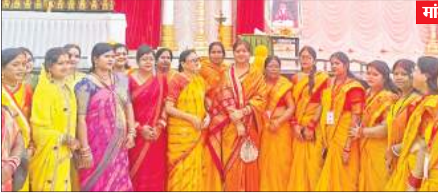
बाबा गणिनाथ गोविंद की जयंती के मौके पर आयोजित कार्यक्रम में जुटी समाज की महिलाएं।

इस अवसर पर समाज के गणमान्य लोगों ने बाबा गणिनाथ के आदर्शों एवं संदेशों को उपस्थित लोगों के बीच रखा। सभी ने जीवन