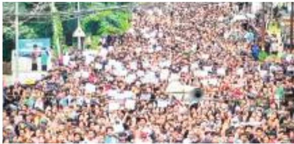
विरोध-प्रदर्शन में शामिल हुए हजारों कुकी-जो समुदाय के लोग.

एजेंसी। इफाल कुकी-जो समुदाय के लोगों ने अलग प्रशासन की अपनी मांग पर जोर देने के लिए शनिवार को मणिपुर में तीन रैलियां निकालीं और मुख्यमंत्री एन बीरेन सिंह के कथित ऑडियो क्लिप के खिलाफ विरोध प्रदर्शन किया, जिसमें कुछ आपत्तिजनक टिप्पणियों की गईं हैं. उन्होंने चुराचंदपुर जिले के लेइशांग, कांपोपकपी के केइथेलमन्बी और तेनौपाल के मोरेह में रैलियां निकालीं. चुराचंदपुर में रैली लेइशांग के एंग्लो कुकी वॉर गेट से शुरू हुई और छह किलोमीटर की दूरी तय करते हुए तुइबोरंग में 'पीस ग्राउंड' में समाप्त हुई. कुकी-जो