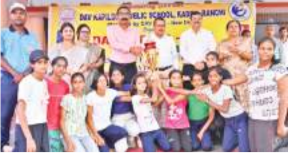
ट्राफी के साथ विजेता टीम के सदस्य.