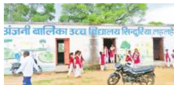
बालिका उच्च विद्यालय के परिसर में खेलते बच्चे .