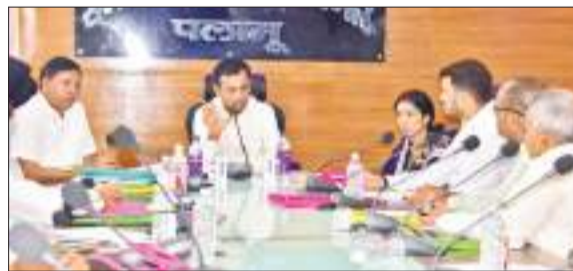
जिलास्तरीय अपीलीय समिति की बैठक करते डीसी