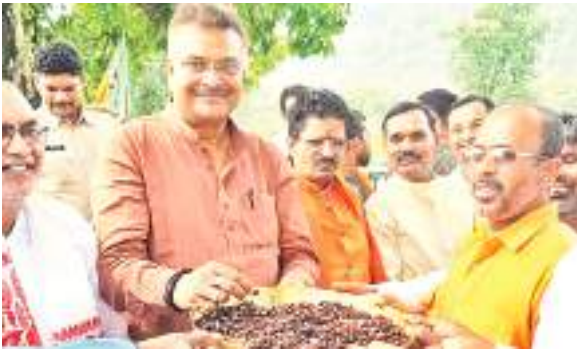
अहरी गांव पहुंचे सांसद मनीष जायसवाल का स्वागत करते ग्रामीण.

आजादी के इतने वर्षों बाद भी यहां के ग्रामीणों को जर्जर सड़क, बिजली की समस्याओं से जूझना पड़ता है. माध्यमिक स्कूल और स्वच्छ पेयजल की मांग के साथ ग्रामीण किसी जननेता के सुध लेने