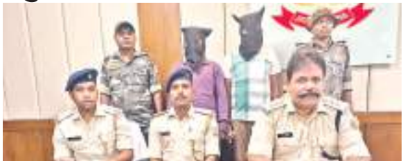
चोरी के मामले का खुलासा करते पुलिस अधिकारी.