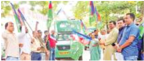
आजसू जन जगारण रथ रवाना.