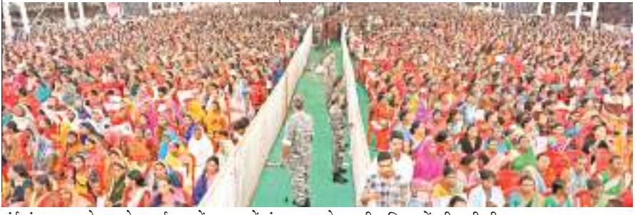
मईयां सम्मान योजना के कार्यक्रम में दुमका में मंगलवार को उमड़ी महिलाओं की भारी भीड़।

सीएम ने केंद्र पर निशाना साधते हुए कहा कि राज्य के गरीब-गुरबा, आदिवासी, दलित, पिछड़ा, अल्पसंख्यक को स्वावलंबी बनाने का पैसा इनके पास नहीं है। हमारे राज्य के गरीबों को आवास देने का पैसा इनके पास नहीं है, राज्य के कर्मचारियों को पेंशन देने का पैसा नहीं है, बूढ़ा बुजुर्ग को पेंशन देने का पैसा नहीं है। लेकिन बड़े-बड़े व्यापारियों का लाखों-लाखों अरबों-अरबों रुपए माफ करने का पैसा इनके पास है। भूख गरीब मरे तो मरे कोई चिंता नहीं है लेकिन व्यापारी लोग नहीं मरना चाहिए। पहले सबको आवास मिला था उसमें आधा पैसा केंद्र सरकार देती थी। चार पांच लाख बकाया आवास था। लेकिन पैसा नहीं दिया। हमलोग का पैसा बगल के राज्य को दे दिया लेकिन हमलोग को नहीं दिया। हमने उस दिन संकल्प लिया कि 4 लाख को छोड़ो 20 लाख लोगों को राज्य सरकार आवास बनाकर देगी। आने वाले 5 से 6 साल में इस राज्य में ऐसा कोई गरीब नहीं बचेगा, जिसके पास घर नहीं होगा। हर साल लाखों आवास स्वीकृत किए जाएंगे।