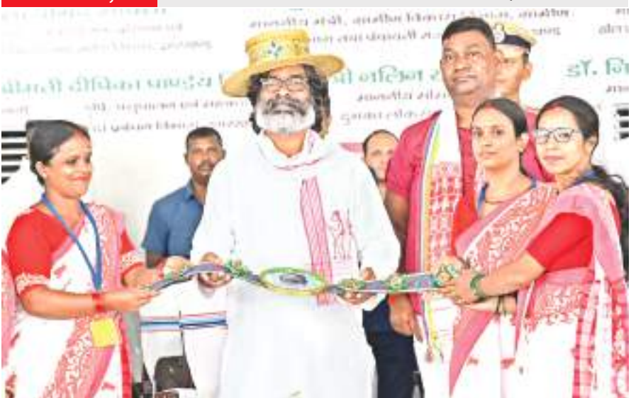
दुमका में मईया सम्मान कार्यक्रम के दौरान मंगलवार को बहनों ने हेमंत सोरेन सौंपी हस्त निर्मित राखी।

सीएम ने विपक्ष पर साधा निशाना, कहा फौज, बैंक और रेलवे सहित कई संस्थाओं में बंद कर दिया नौकरी विपक्ष फिर से लग गया है सरकार तोड़ो अभियान में