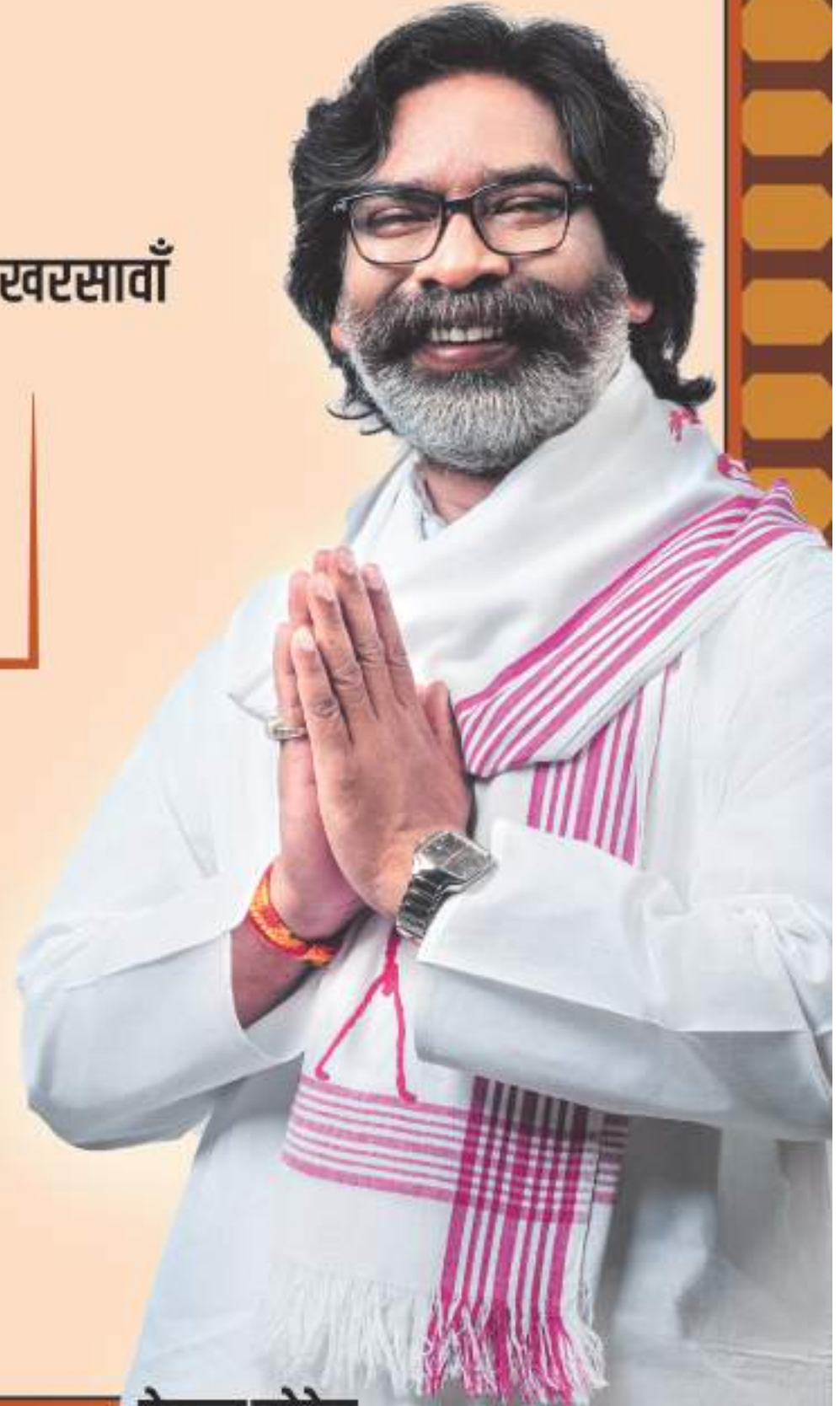
हेमन्त सोरेन मुख्यमंत्री, झारखण्ड

महिला, बाल विकास एवं सामाजिक सुरक्षा विभाग, झारखण्ड सरकार