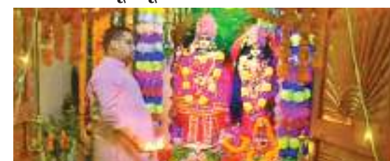
भगवान कृष्ण की आरती करते पुजारी.