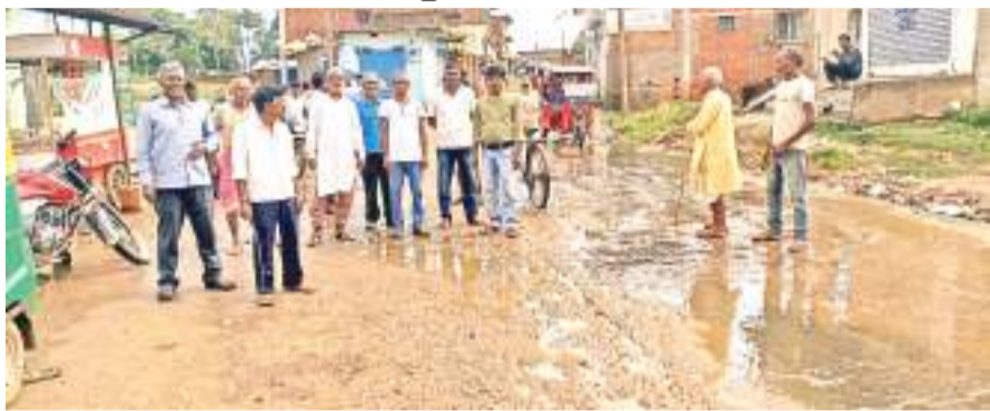
हाल ही में मरम्मत कराई गई पबरा सड़क हालत जर्जर हो गई है।

पेलावल मोड़ से सीमाने नदी तक आठ किलोमीटर लंबा पबरा रोड सात माह में ही बद्दहाल हो गई है। एक तरफ से बनती गयी और दूसरी तरफ से उखड़ती गई। इसी वर्ष 14 फरवरी को आरईओ ऑफिस द्वारा 4 करोड़ 85 लाख रुपये की लागत से इस सड़क को मरम्मत का कार्य शुरू हुआ था। निर्माण एजेंसी को ही इसके रखरखाव की भी जिम्मेदारी दी गई थी, लेकिन सात महीने के अंदर ही सड़क पर गह्वे ही गह्वे नजर आ रहे हैं। कहीं-कहीं तो सड़क के किनारे की मिट्टी भी धंस चुकी है। आरोप है कि सड़क की रिपेयरिंग में घटिया सामग्री का इस्तेमाल किया गया है। मार्ग पर पर कई पुलिया भी बनाई जानी थी, लेकिन ठेकेदार ने न तो कोई पुलिया बनाई और न ही अच्छी सड़क बनाई गई। रोड का काम पूरा हो चुका है और ठेकेदार भी फरार हो चुका है। वहीं संबंधित विभागीय अधिकारी भी मौन धारण कर लिए हैं।