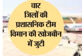
लापता विमान की सांकेतिक तस्वीर।

रांची। मुख्यमंत्री हेमंत सोरेन ने झारखंड मुख्यमंत्री मईयां सम्मान योजना के लिए निर्बंधित महिलाओं को राशि हस्तांतरण से संबंधित आ रहे कॉल को गंभीरता से लिया है। इस संबंध में मुख्यमंत्री ने कहा, झारखंड मुख्यमंत्री मईयां सम्मान योजना के संदर्भ में सूचना आ रही है कि कई लाभुकों के मोबाइल नंबर पर योजना को लेकर कॉल आ रहे हैं, जो पूरी तरह से फर्जी हैं। इसीलिए योजना के तहत निर्बंधित बहन-बेटियों से आग्रह है कि योजना के संदर्भ में या राशि हस्तांतरण से संबंधित कॉल आने पर ओटीपी या अपने बैंक खाते से संबंधित जानकारी कॉल करने वाले के साथ साझा कदापि न करें। झारखंड सरकार इस योजना को लेकर किसी तरह का कॉल नहीं कर रही है। अतः आप सभी सतर्क रहें और ऐसे कॉल आने पर अपने बैंक खाता को जानकारी नहीं दें।