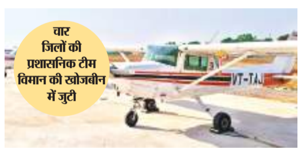
लापता विमान की सांकेतिक तस्वीर।

सोनारी एयरपोर्ट से सोमवार को सुबह उड़ान भरा अल्केमिस्ट एविएशन का ट्रेनी विमान लापता हो गया है। उड़ान भरने के कुछ मिनटों के बाद ट्रेनी विमान का एटीसी (एयरपोर्ट कंट्रोल सेंटर) से संपर्क कट गया। इसके बाद से विमान का कोई लोकेशन नहीं मिल पाया है। लापता होने से पहले विमान का अंतिम लोकेशन चांडिल एवं पुर्खलिया (प. बंगाल) के अयोध्या हिल की ओर देखा गया था। इसके बाद पूर्वी सिंहभूम जिला प्रशासन ने सरायकेला-खरसावां एवं पुर्खलिया जिला प्रशासन से विमान की खोज में मदद मांगी।