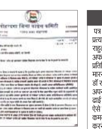
कांग्रेस अध्यक्ष को लिखा पत्र।