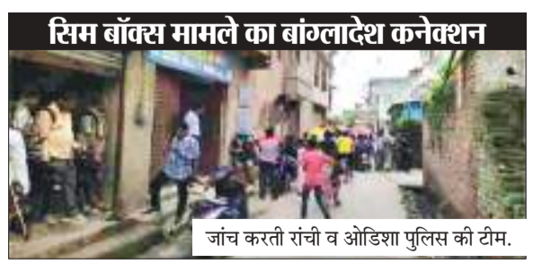
जांच करती रांची व ओडिशा पुलिस की टीम।

ओडिशा पुलिस ने सिम बॉक्स मामले में नामकुम थाना क्षेत्र के कांटाटोली में मंगलवार की दोपहर छापेमारी की। यहां एक घर का ताला तोड़ कर वहां से आठ सिम बॉक्स बरामद किये गये हैं। अभियान में ओडिशा पुलिस के साथ रांची पुलिस की टीम भी शामिल रही। बताया जा रहा है कि सिम बॉक्स रैकेट का हुआ था भंडाफोड़ : ओडिशा में 16 अगस्त को सिम बॉक्स रैकेट का भंडाफोड़ हुआ था, पुलिस ने भुवनेश्वर स्थित एक घर से पांच एक्टिव सिम बॉक्स, दो रिजर्व सिम बॉक्स और 750 से अधिक सिम कार्ड के साथ-साथ