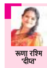
रूपाम रishi 'दीप'

इंसानियत को शर्मसार करने और दिल दहला देने वाली ऐसी दंदना और शर्मनाक घटना, जिसके बारे में सुनकर ही रूह कांप उठती है, उस संबंध में क्या विचार व्यक्त कर सकते हैं! इस पाशाचिक कुकृत्य को विस्तृत जानकारि वाली खबरें टीवी पर देखने के लिए भी हिम्मत जुटानी पड़ रही है. अभी तो मणिपुर की अति दुःखदाई यादें ताजा ही थी कि अब कोलकाता की उस डॉक्टर के साथ ऐसी दुःकृति! कैंडिल मार्च और वक्तव्यों से आगे अब हमें मंथन करना होगा कि आखिर क्यों कुछ पुरुषों की मानसिकता ऐसी विकृत हो जाती है? अपने परिवार, समाज या कानून का कोई भय उनके मन में क्यों नहीं रह जाता है? कोई ऐसा अति कठोर कानून तो अब बनाना ही पड़ेगा जिससे कि इनसानियत अगर खरेर भूल भी जाए तब कानून का भय उनके कुकर्मों पर लागम लगा सके.