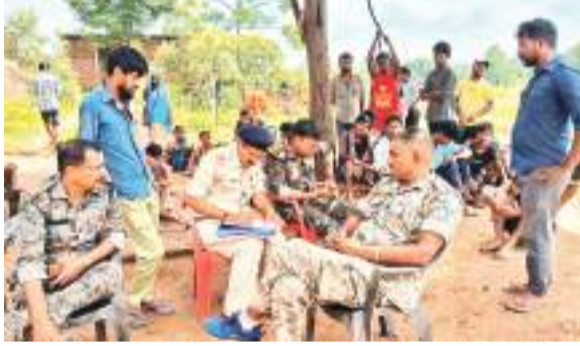
घटनास्थल पर जांच करती भंडरा थाना की पुलिस।