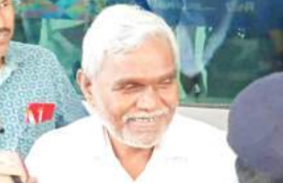
दिल्ली में मीडिया से रू-ब-रू पूर्व मुख्यमंत्री चंपाई सोरेन.