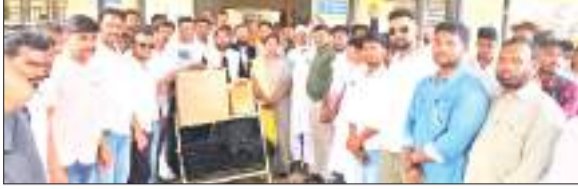
सदर अस्पताल में मरीजों के बीच खाद्य सामग्री वितरित करते कांग्रेसी।