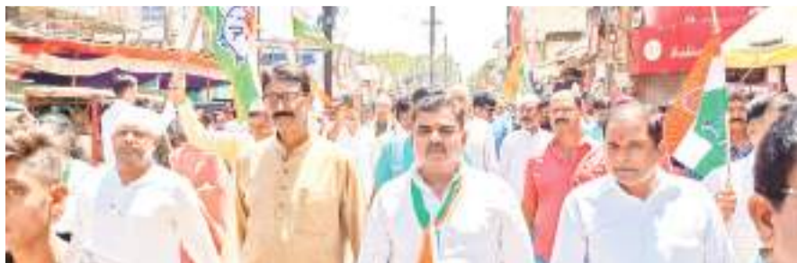
राजीव गांधी की जयंती पर सद्भावना रैली निकालते कांग्रेस नेता और कार्यकर्ता।