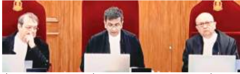
कोलकाता कांड की सुनवाई करती सीजेआई डीवाई चंद्रचूड़ की अध्यक्षता वाली सुप्रीम कोर्ट की पीठ.

सीजेआई डीवाई चंद्रचूड़ की अध्यक्षता वाली तीन नज्जों को पीठ ने कहा कि अगर महिलाएं काम पर नहीं जा पा रही हैं और काम करने की स्थितियां सुरक्षित नहीं हैं, तो हम उन्हें समानता से वंचित कर रहे हैं. पीठ में न्यायमूर्ति जेबी पारदीवाला और न्यायमूर्ति मनोज मिश्रा भी शामिल थे. सुप्रीम कोर्ट ने बलात्कार-हत्या मामले में प्राथमिकी दर्ज करने में देरी को लेकर पश्चिम बंगाल सरकार से पूछा कि अस्पताल के पदाधिकारी क्या कर रहे थे? पीठ ने कहा कि ऐसा लगता है कि अपराध का पता सुबह-सुबह ही चल गया था, लेकिन मेडिकल कॉलेज के प्राचार्य ने इसे आत्महत्या बताने की कोशिश की.