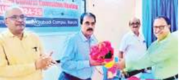
वार्षिक बैठक के दौरान रांची विवि के पदाधिकारी।