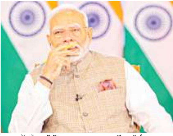
जब चारों ओर अनिश्चितता का माहौल है। दुनिया अब भी पूरी तरह से कोविड-19 के प्रभाव से बाहर नहीं आयी है। दूसरी ओर, युद्ध की स्थिति ने हमारी विकास यात्रा के लिए

प्रधानमंत्री नरेंद्र मोदी ने शनिवार को विकासशील देशों में, विशेषकर खाद्य और ऊर्जा सुरक्षा के क्षेत्रों में वैश्विक अनिश्चितताओं के प्रभावों पर चिंता व्यक्त की। मोदी ने तीसरे वॉयस ऑफ ग्लोबल साउथ सम्मेलन में अपने शुरुआती भाषण में इसमें भाग ले रहे देशों को डिजिटल सार्वजनिक बुनियादी ढांचा क्षेत्र समेत विभिन्न अहम क्षेत्रों में पूर्ण समर्थन देने की भारत की अटूट प्रतिबद्धता का आश्वासन दिया। भारत ने डिजिटल रूप से इस सम्मेलन की मेजबानी की। प्रधानमंत्री ने कहा, आज हम ऐसे वक्त में बैठक कर रहे हैं,