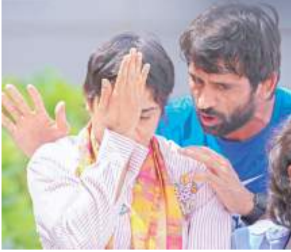
कांस्य पदक विजेता निशानेबाज और पेरिस ओलंपिक में भारतीय दल के नेता गगन नारंग ने विनेश को चैंपियन करार दिया। यह दोनों एक ही उड़ान से दिल्ली पहुंचे थे। नारंग ने पेरिस हवाई अड्डे पर विनेश के साथ खींची गई तस्वीर को एक्स पर पोस्ट किया।

खिलाडियों के अलावा पंचायत नेता भी विनेश का स्वागत करने के लिए पहुंचे थे। विनेश फूल मालाओं से लदी थीं। उन्होंने खुली जीप में सवार होकर लोगों का आभार व्यक्त किया। विनेश ने हाथ जोड़कर कहा, मैं पूरे देश का आभार व्यक्त करती हूँ। यह विशाल काफिला विनेश के साथ हरियाणा के बलौली गांव तक जाएगा। विनेश के आगमन के लिए कड़ी सुरक्षा व्यवस्था की गई थी। पेरिस ओलंपिक में फाइनल से पहले किए गए वजन में उनका वजन 100 ग्राम अधिक निकला था जिसके कारण उन्हें अयोग्य घोषित कर दिया गया था। विनेश ने संयुक्त रूप से रजत पदक दिलाने के लिए खेल पंचायत में अपील की थी जिसके कारण वह पेरिस में रुकी रही। खेल पंचायत ने उनकी अपील को खारिज कर दिया था। लंदन ओलंपिक के