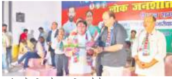
कार्यक्रम में शामिल लोजपा रामविलास के नेतागण।