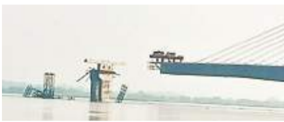
खगड़िया में निर्माणाधीन फोरलेन पुल का ध्वस्त स्ट्रक्चर.