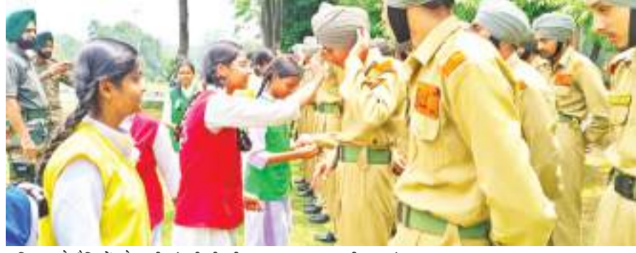
शनिवार को सैनिकों को राखी बांधती डीएवी स्कूल बरकाकाना की छात्राएं।