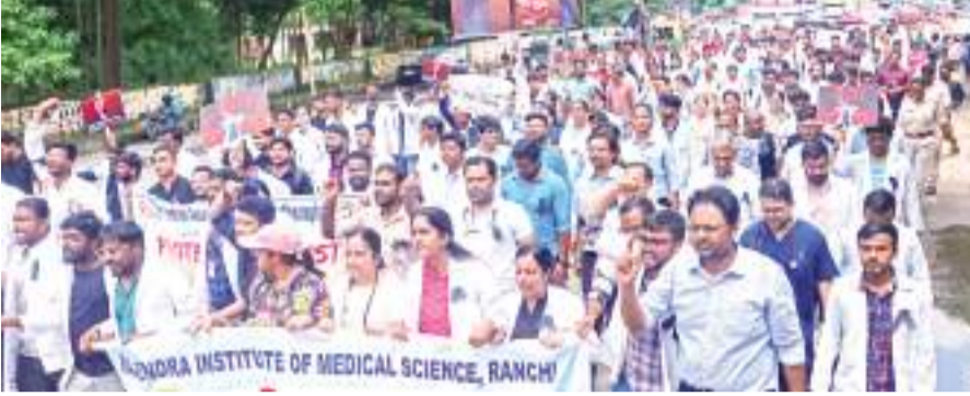
विरोध प्रदर्शन करते हुए रिम्स परिसर से आईएमए भवन जाते रिम्स के जूनियर डॉक्टर.