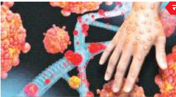
ज्यादातर व्यक्तियों को करता है प्रभावित

'द लासेट ग्लोबल हेल्थ' में हमारे एक हालिया लेख में बताया गया कि इस प्रकोप को रोकने और इसे संभवतः महामारी में बदलने से रोकने के लिए क्या किया जाना चाहिए। नैदानिक जांच, टीकों और एंटीबायोरल उपचारों तक पहुंच के लिए राजनीतिक प्रतिबद्धता और वित्तीय निवेश की आवश्यकता है। इसके संपर्क में आने वाले लोगों, संवर्णण मार्गों और नैदानिक जांच के बारे में अधिक जानकारी जुटाने के लिए वैज्ञानिक जांच की आवश्यकता है।