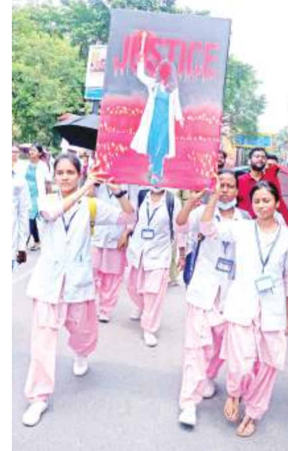
रांची की सड़क पर तख्ती लेकर विरोध प्रदर्शन करतीं नर्सिंग स्टाफ.

रांची। कोलकाता में महिला रेजिडेंट चिकित्सक की दुष्कर्म के बाद हत्या के विरोध में शनिवार को रांची के सभी निजी अस्पतालों ने डॉक्टरों ने सरकारी अस्पताल के डॉक्टरों के साथ संयुक्त रूप से विरोध प्रदर्शन किया. जेडीए, रिम्स, आईएमए, झाम्सा, आरडीए, सीआईपी और एचपीआई के सदस्य रिम्स परिसर से मार्च करते हुए आईएमए भवन पहुंचे और यहां प्रदर्शन किया. बता दें कि कोलकाता की घटना के बाद झारखंड के सबसे बड़े सरकारी अस्पताल रिम्स में भी चिकित्सकों का आंदोलन जारी है. डॉक्टरों का कहना है कि जिस प्रकार आज देश की बेटी दरिदों का शिकार हो गयी, दोबारा किसी बेटी के साथ ऐसा कुछ ना हो. इसलिए राज्य भर के डॉक्टर ने विरोध प्रदर्शन करते हुए अपराधी को फांसी देने की मांग कर रहे हैं. रिम्स में कार्यरत महिला डॉक्टरों ने कहा कि हम तमाम रांची के डॉक्टर बहुत दुखी हैं, क्योंकि कम उम्र की ट्रेनी महिला डॉक्टर, जो रात-दिन मरीज की सेवा में लगी रहती हैं. मगर उन्हें क्या मिलता है, दर्दनाक मौत. इस प्रकार की घटना से मन विचलित हैं. ऐसे दरिदों को सरकार तुरंत फांसी की सजा दे.