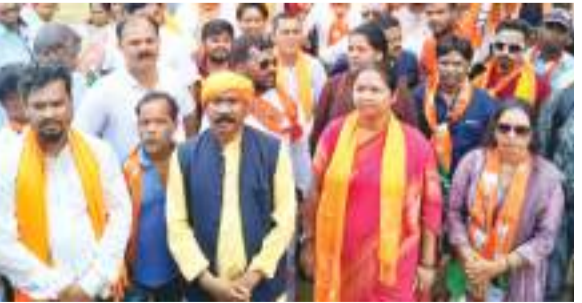
आंदोलन में शामिल पूर्व सीएम मधु कोड़ा, पूर्व सांसद गीता कोड़ा व अन्य।