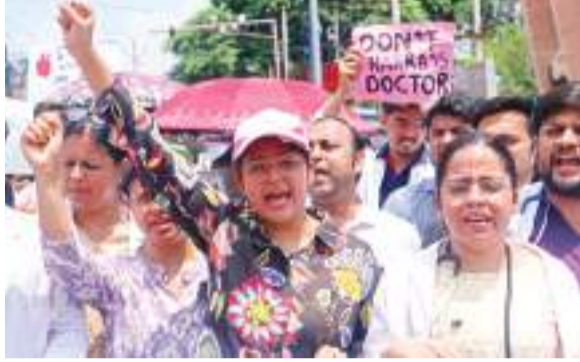
अस्पताल परिसर में सुरक्षा देने की मांग करतीं जूनियर महिला डॉक्टर.