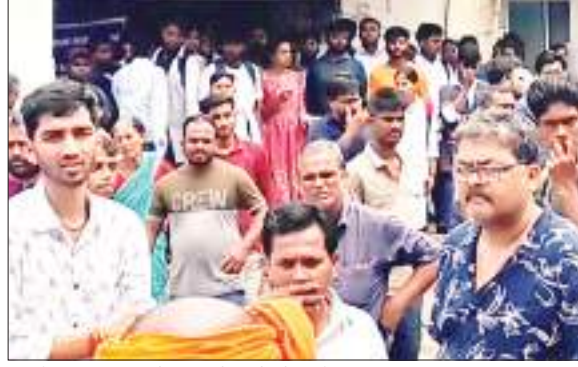
आक्रोशित डॉक्टरों ने ट्रामा सेंटर के गेट को भी जाम कर दिया।

शेख भिखारी मेडिकल कॉलेज अस्पताल में डॉक्टर के साथ मारपीट का मामला प्रकाश में आया है। घटना के विरोध में चिकित्सकों ने कार्य बहिष्कार कर दिया है। इसके कारण शुक्रवार को अस्पताल में दोपहर 12:00 बजे के बाद से किसी भी मरीज का इलाज नहीं हो पाया। जानकारी के अनुसार अस्पताल में इलाज के दौरान एक मरीज की मौत हो गई थी। इसके बाद मरीज के परिजन और डॉक्टर के बीच कहासुनी होने लगी। डॉक्टरों का आरोप है कि मरीज की मौत के बाद परिजनों ने डॉक्टर के साथ मारपीट की। बाद में पुलिस मरीज के एक परिजन को थाना ले गई। इसके बाद भी आक्रोशित डॉक्टर जिला प्रशासन से अपनी सुरक्षा मांग करते हुए हड़ताल पर चले गए। यहां तक कि डॉक्टरों ने ट्रामा सेंटर के गेट को भी जाम कर दिया।