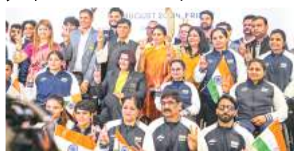
नयी दिल्ली

शुक्रवार को यहां आयोजित विदाई समारोह में केंद्रीय मंत्री मनसुख मंडविया ने कहा कि उन्हें 'चुनौती' को चुनौती देने वाले खिलाड़ियों से सर्वश्रेष्ठ प्रदर्शन की उम्मीद है। इस मौके पर खेल राज्य मंत्री रक्षा खडसे, भारतीय पैरालंपिक समिति (पीसीआई) के अध्यक्ष देवेन्द्र झाझड़िया और उद्घाटन समारोह में भारतीय ध्वजवाहक सुमित अतिल मौजूद थे।