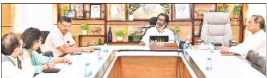
राजधानी में आयोजित बैठक में सीएम मंईयां योजना की जानकारी लेते मुख्यमंत्री हेमंत सोरेन।

मुख्यमंत्री हेमंत सोरेन रक्षाबंधन के दिन झारखंड मुख्यमंत्री मंईयां योजना का शुभारंभ करने वाले थे। लेकिन शिड्यूल में बदलाव किया गया है। सीएम हेमंत सोरेन अब रक्षाबंधन के एक दिन पूर्व 18 अगस्त को ही पाकुड़ में झारखंड मुख्यमंत्री मंईयां सम्मान योजना का शुभारंभ करेंगे। इसके तहत महिला लाभुकों के खातों में डीबीटी के माध्यम से एक हजार की सम्मान राशि ट्रांसफर की जायेगी। मुख्यमंत्री की अध्यक्षता में गुरुवार को आवासीय कार्यालय में आयोजित बैठक में यह निर्णय लिया गया। वीडियो कॉन्फ्रेंसिंग के जरिये आयोजित बैठक में मुख्य सचिव एल. खियात, मुख्यमंत्री के अपर मुख्य सचिव अविनाश कुमार, महिला बाल विकास एवं सामाजिक सुरक्षा विभाग के सचिव मनोज कुमार, सूचना एवं प्रौद्योगिकी सचिव विप्रा भाल समेत विभिन्न जिलों के उपायुक्त शामिल हुए। एसएमएस के माध्यम से लाभुकों को देे जानकारी : मुख्यमंत्री हेमंत सोरेन ने बैठक में इस महत्वाकांक्षी योजना के लिए विशेष शिविरों में मिल