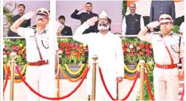
रांची के मोरहाबादी मैदान में गुरुवार को झंडोत्तोलन के बाद राष्ट्रीय ध्वज को सलामी देते सीएम हेमंत सोरेन.

जल, जंगल, जमीन हमारी पहचान : सीएम ने कहा कि जल, जंगल, जमीन हमारी पहचान है. इस पहचान को बनाये रखते हुए हम विकास की ऊंचाइयों को छूने का प्रयास कर रहे हैं. हमारी सरकार ने गांव-गांव पहुंच कर समस्याओं को सुलझाने का प्रयास किया. हर वर्ग की जरूरतों को देख कर नीतियां और योजनाएं बनायीं गयीं और इसे धरातल पर उतारने का काम किया गया. इस दौरान कई चुनौतियां भी आयीं. सरकार गठन के तुरंत बाद कोरोना महामारी फैल गया. इसका विकास कार्यों पर काफी बुरा प्रभाव पड़ा.