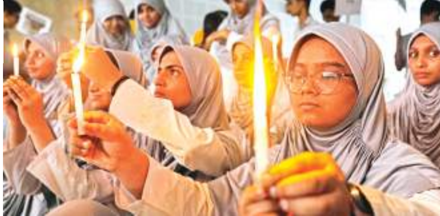
चेन्नई में बुधवार को स्कूली छात्रों ने केरल के वायनाड भूखलन पीड़ितों के लिए मोमबत्तियां जलाकर प्रार्थना की। प्रेर

व्यक्ति बैठे या लेटे हुए होंगे।" अधिकारियों ने हालांकि अभी तक इस बारे में आधिकारिक तौर पर कोई प्रतिक्रिया नहीं दी है। विभिन्न बचाव एजेंसियां इस घटना में लापता लोगों का पता लगाने में जुट गई हैं। भूखलन से प्रभावित इलाकों से 158 लोगों के शव बरामद किए हैं और करीब 191 लोग लापता हैं। मुख्यमंत्री पिनरायी विजयन ने बुधवार को कहा कि वायनाड जिले के भूखलन प्रभावित इलाकों से 200 से अधिक लोगों को अस्पतालों में भर्ती कराया गया है और इस पर्वतीय जिले के भूखलन से तबाह हुए इलाकों से 5,592 लोगों को बचाया गया है। उन्होंने यहां एक संवाददाता सम्मेलन में कहा कि इसके अलावा बच्चों और गर्भवती महिलाओं समेत 8,017 लोगों को जिले में 82 शिविरों में स्थानांतरित किया गया है। जिला प्रशासन के अनुसार, सैकड़ों लोगों के मलबे में दबे होने की आशंका है जिससे मृतक संख्या बढ़ सकती है। वायनाड में मंगलवार तड़के मुंडक्कई, चूरलमाला, अट्टामाला और नूलपुझा गांवों में मुसलाधार बारिश के बाद बड़े पैमाने पर भूखलन की घटनाएं हुई थीं।