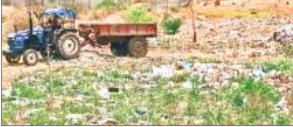
लातेहार के हरका गांव में सोती झरना के पास बना कचरा डंपिंग यार्ड.

लातेहार में औरंगा नदी व सोती झरना के प्रदूषण का मामला