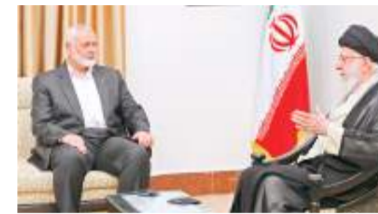
ईरान के सर्वोच्च नेता अयातुल्ला खामेनेई (दाएं) के साथ इस्माइल हनियेह। प्रेर

हमास ने अपने राजनीतिक ब्यूरो के प्रमुख की मौत के लिए इजराइल के हवाई हमले को जिम्मेदार ठहराया। वहीं, ईरान के अर्धसैनिक बल 'रिवोल्यूशनरी गार्ड' ने कहा कि वह हनियेह की हत्या की जांच कर रहा है। उसने यह नहीं बताया कि हत्या कैसे हुई और हनियेह को किसने मारा। फिलहाल किसी ने भी हत्या की जिम्मेदारी नहीं ली है, लेकिन इसका शक इजराइल पर है, जिसमें सात अक्टूबर को देश में हुए अप्रत्याशित हमले को लेकर हनियेह और हमास के विभिन्न कमांडरों को