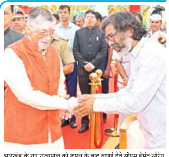
झारखंड के नए राज्यपाल को शपथ के बाद बधाई देते सीएम हेमंत सोरेन।