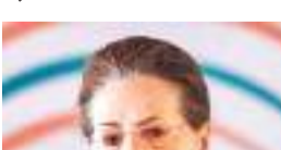
लोगों के और बीते सप्ताह के आखिर में दिल्ली के एक कोचिंग संस्थान में बारिश के पानी में डूबने के कारण जान गंवाने वाले तीन विद्यार्थियों के सम्मान में कुछ देर मौन रखा गया। कांग्रेस की पूर्व अध्यक्ष ने पार्टी के नए सांसदों से कहा, हमें नियमित रूप से संसद में मौजूद रहना चाहिए, हर समय सतर्क रहना चाहिए और अपनी समिति के कार्यों को गंभीरता से लेना

कांग्रेस संसदीय दल की प्रमुख सोनिया गांधी ने लोकसभा चुनाव के नतीजों का हवाला देते हुए बुधवार को पार्टी नेताओं से कहा कि देश में माहौल पार्टी के पक्ष में है, लेकिन अति आत्मविश्वास व आत्मसंतुष्टि नहीं होनी चाहिए तथा एकजुट होकर काम करना है। उन्होंने कांग्रेस संसदीय दल की बैठक में भाजपा और आरएसएस पर तीखे प्रहार किए और आरोप लगाया कि पीएम नरेंद्र मोदी की सरकार लोकसभा चुनाव में लगे झटके से सबक लेने के बजाय आज भी विभाजन और डर फैलाने की अपनी नीति पर कायम है। सीपीपी की बैठक की शुरुआत में, केरल के वायनाड में भूखलन में मारे गए