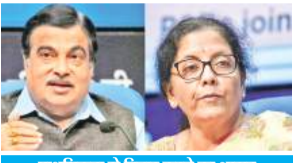
प्राथमिकता से विचार करने का आग्रह

एजेंसियां। नयी दिल्ली केंद्रीय मंत्री नितिन गडकरी अपनी बेबाकी के लिए जाने जाते हैं, उन्होंने अपनी ही सरकार से लाइफ और मेडिकल इश्योरेंस के प्रीमियम पर लगने वाला जीएसटी वापस लेने की मांग की है, वित्त मंत्री निर्मला सीतारमण को लिखे एक पत्र में गडकरी ने कहा कि इस कदम से बीमा कंपनियों पर टैक्स का बोझ कम होगा और देश में महत्वपूर्ण बीमा उत्पादों की मांग को बढ़ावा मिलेगा।