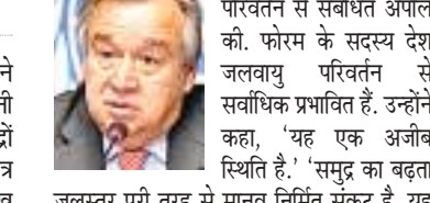
जलस्तर पूरी तरह से मानव निर्मित संकट है। यह संकट जल्द ही अप्रत्याशित पैमाने पर पहुंच जाएगा, जब हमें सुरक्षित वापस ले जाने के लिए कुछ नहीं बचेगा। गुतारेस के कार्यालय से तैयार की गई रिपोर्ट में पाया गया कि टोंगा की राजधानी नुकु अलोफा के पास वर्ष 1990 से 2020 के बीच समुद्र का जलस्तर 21 सेंटीमीटर बढ़ा है, जो वैश्विक औसत 10 सेंटीमीटर से लगभग दोगुना है। समोआ के अपिया में समुद्र का जलस्तर 31 सेंटीमीटर बढ़ा है, जबकि फिजी के सुवा-बी में 29 सेंटीमीटर बढ़ा है।

संयुक्त राष्ट्र महासचिव एंतोनियो गुतारेस ने दुनिया को एक और जलवायु चेतावनी (एसओएस) जारी की है, जिसमें उन्होंने समुद्रों में तेजी से बढ़ रहे जलस्तर, खासकर प्रशांत क्षेत्र के अधिक असुरक्षित द्वीपीय देशों का उल्लेख किया है। उन्होंने कहा है 'हमारे समुद्रों को बचाओ।' संयुक्त राष्ट्र और विश्व मौसम विज्ञान संगठन ने सोमवार को समुद्र के बढ़ते जलस्तर पर रिपोर्ट जारी की। पृथ्वी का तापमान बढ़ने और ग्लेशियरों के पिघलने से समुद्र का जलस्तर तेजी से बढ़ रहा है। उन्होंने दक्षिण-पश्चिम प्रशांत क्षेत्र पर बढ़ते महासागरों, समुद्री अम्लीकरण और समुद्र की गंम लहरों तथा अन्य जलवायु परिवर्तन प्रभावों पर भी प्रकाश डाला।