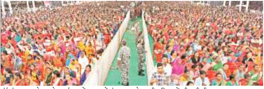
मईयां सम्मान योजना के कार्यक्रम में दुमका में मंगलवार को उमड़ी महिलाओं की भारी भीड़।

सीएम ने केंद्र पर निशाना साधते हुए कहा कि राज्य के गरीब-गुरबा, आदिवासी, दलित, पिछड़ा, अल्पसंख्यक को स्वावलंबी बनाने का पैसा इनके पास नहीं है। हमारे राज्य के गरीबों को आवास देने का पैसा इनके पास नहीं है, राज्य के कर्मचारियों को पेंशन देने का पैसा नहीं है, बूढ़ा बुजुर्ग को पेंशन देने का पैसा नहीं है। लेकिन बड़े-बड़े व्यापारियों का लाखों-लाखों अरबों-अरबों रुपए माफ करने का पैसा इनके पास है। भूखा गरीब मरे तो मरे कोई चिंता नहीं है लेकिन व्यापारी लोग नहीं मरना चाहिए। पहले सबको आवास मिला था उसमें आधा पैसा केंद्र सरकार देती थी। चार पांच लाख बकाया आवास था। लेकिन पैसा नहीं दिया। हमलोग का पैसा बगल के राज्य को दे दिया लेकिन हमलोग को नहीं दिया। हमने उस दिन संकल्प लिया कि 4 लाख को छोड़ें 20 लाख लोगों को राज्य सरकार आवास बनाकर देगी। आने वाले 5 से 6 साल में इस राज्य में ऐसा कोई गरीब नहीं बचेगा, जिसके पास घर नहीं होगा। हर साल लाखों आवास स्वीकृत किए जाएंगे।