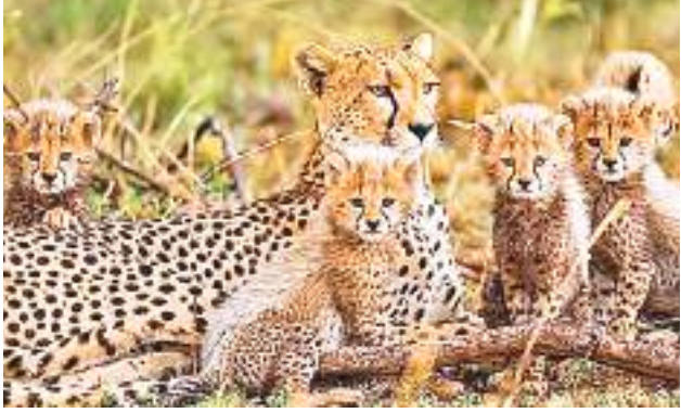
प्रबंधन प्रमुख चुनौतियां हैं। शिकार कम होना उन वजहों में से एक है जिसके चलते सेंटिसीमिया के कारण तीन चीतों की मौत के बाद बाकी के चीतों को

पिछले साल अगस्त में जंगल से लाए जाने के बाद कूनो में बाघों में अधिक वक्त गुजारना पड़ा। अंतरिम समाधान के तौर पर प्राधिकारी कूनो और गांधी सागर दोनों में शिकार की संख्या बढ़ा रहे हैं। दोनों इलाकों में तेंदुओं की अधिक तादाद के कारण भी तेंदुआ स्थानांतरण अभियान शुरू करना पड़ा है। विशेषज्ञों के अनुसार, तेंदुए और शेर जैसे शिकारियों की उपस्थिति चीतों के लिए खतरा पैदा करती है। बहरहाल, समिति के सदस्यों ने बार-बार 'मूल स्थान पर शिकार बढ़ाने' की महत्ता पर जोर देते हुए कहा है कि 'स्थानांतरण के जरिए सक्रिय शिकार वृद्धि अनिश्चितकाल तक नहीं हो सकती है।'