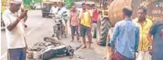
दुर्घटना स्थल पर क्षतिग्रस्त बाइक और उपस्थित स्थानीय लोग.