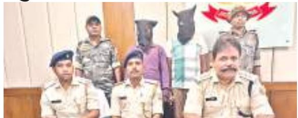
चोरी के मामले का खुलासा करते पुलिस अधिकारी.