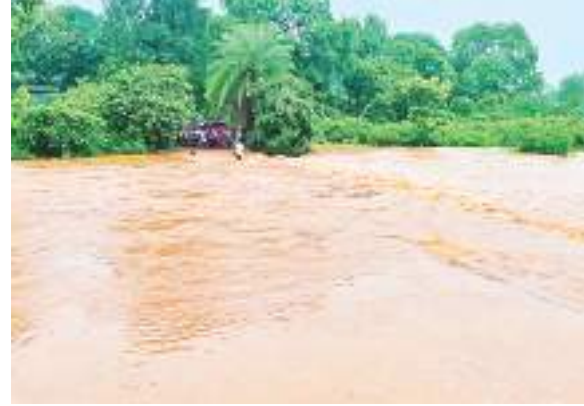
नाला पर बने पुल के ऊपर से बहता पानी और एक छोर पर खड़े ग्रामीण.