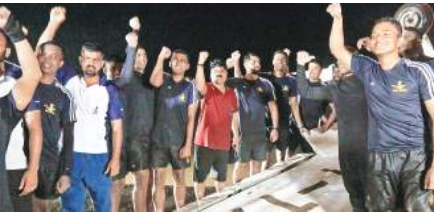
विमान के साथ भारतीय नौसेना की टीम

चांडिल डैम में गिरे अल्केमिस्ट एवियशन प्राइवेट लिमिटेड का टू सीटर ट्रेनी विमान को सोमवार की रात बाहर निकाल लिया गया। दुर्घटनाग्रस्त विमान को डैम से बाहर निकालने में भारतीय नौसेना को 14 घंटे का समय लगा। भारतीय नौसेना की टीम में कुल 20 सदस्य हैं, जिनमें 15 गोताखोर और पांच तकनीकीशियन हैं। सोमवार की सुबह लगभग 10 बजे भारतीय नौसेना की टीम विमान को बाहर निकालने के लिए आवश्यक संसाधनों के साथ चांडिल डैम में घुसी थी, जो अभियान की सफलता के साथ रात के लगभग 11.40 बजे बाहर निकलीं। सर्च ऑपरेशन के दौरान भारतीय नौसेना को रविवार को लापता होने के छठे दिन चांडिल डैम की गहराई में दुर्घटनाग्रस्त विमान मिला था। बताया जा रहा है कि विमान डैम में डूबे कोयलागढ़ के निकट वनडीह और बडोडीह के बीच पानी की गहराई में मिला था।