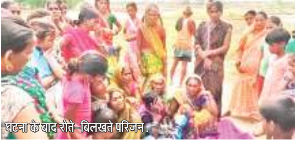
धुंधला के बाद राते-बिनाखते परिजम

• वज्रपात से तीन लोग गंभीर रूप से झुलसे, अस्पताल में भर्ती हुए संवाददाता । पटना