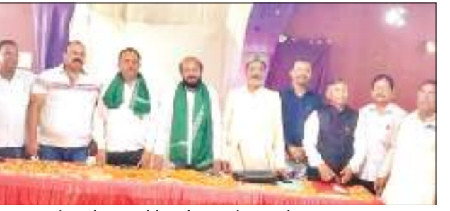
राजद की बैठक में हिस्सा लेने पहुंचे पार्टी के वरिय नेता.

झारखंड में हालांकि अभी तक विधानसभा चुनाव की कोई तिथि अभी तक निर्धारित नहीं हुई है. लेकिन जिले में चुनावी सरगमी तेज हो गयी है. संभावित प्रत्याशियों ने जनसंपर्क अभियान प्रारंभ कर दिया है. खास कर जिले के मिनिका विधानसभा क्षेत्र में सरगामी कुछ अधिक देखी जा रही है. अकेले भाजपा के ही तीन-चार प्रत्याशी क्षेत्र में जनसंपर्क अभियान चला रहे हैं. अब राजद ने भी इसमें इंटी मारी है. राजद ने कहा कि वे हर हाल में लातेहार जिला के दोनों