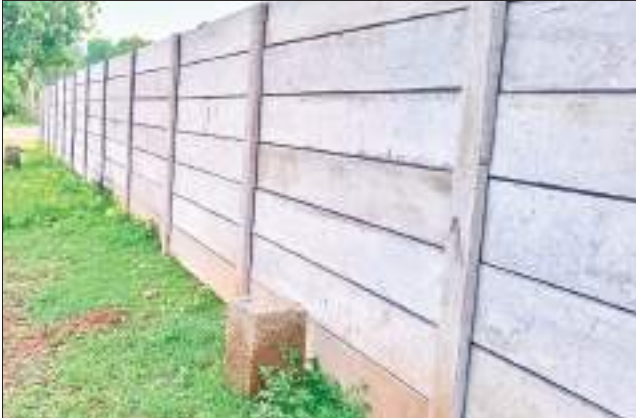
चहारदीवारी और परियोजना की ओर से गाड़ा गया पीलर.

चांडिल प्रखंड के चिलगु पुनर्वास स्थल के विस्थापित इन दिनों काफी परेशान और डरे-सहमे हैं. विस्थापित असमंजस की स्थिति में है कि कहीं फिर से उन्हें एक बार उजाड़ा तो नहीं जाएगा? बीते एक महीने से चिलगु पुनर्वास स्थल पर भूखंड का विवाद सुखियों में है. एक भूखंड के दो दावेदार सामने आए हैं, लेकिन अब तक यह स्पष्ट नहीं हो पाया है कि वास्तव में उक्त भूखंड है किसका. चांडिल अंचल के चिलगु पुनर्वास स्थल पर कुछ विस्थापितों ने घर और चारदीवारी का निर्माण किया है, जिसको लेकर चांडिल के अंचलाधिकारी ने तीन लोगों के नाम पर नोटिस जारी कर स्पष्टीकरण और कागजात मांगा था.