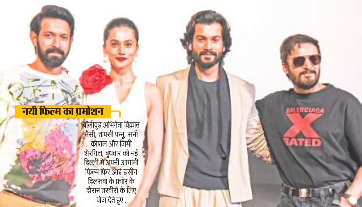
नयी फिल्म का प्रमोशन

नयी दिल्ली । कमजोर हाजिर मांग के बीच कारोबारियों द्वारा अपने सौदों का आकर घटाने से बुधवार को वायदा कारोबार में चांदी की कीमत 601 रुपये की गिरावट के साथ 79,022 रुपये प्रति किग्रा रह गया. मल्टी कर्मांडिटी एक्सचेंज में चांदी के सितंबर महीने में डिलीवरी वाले अनुबंध की कीमत 601 रुपये यानी 0.75 प्रतिशत की गिरावट के साथ 79,022 रुपये प्रति किलोग्राम रह गया. इसमें 28,899 लॉट का कारोबार हुआ. वैश्विक स्तर पर न्यून्योके में चांदी की कीमत 0.79 प्रतिशत की हानि के साथ 27 डॉलर प्रति औंस रह गयी.