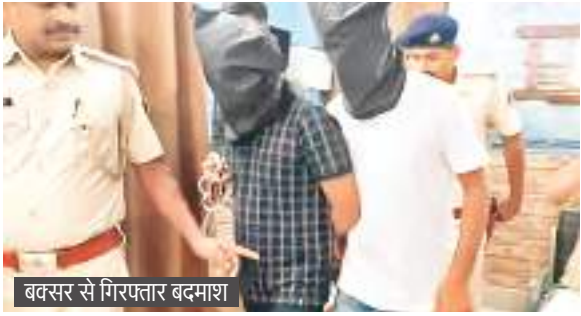
बदसर से गिरफ्तार बदमाश

• 145 प्रवेश पत्र, मोबाइल फोन, नकद राशि, पैन, डेबिट, आयुष्मान कार्ड, पहचान पत्र हुआ बरामद