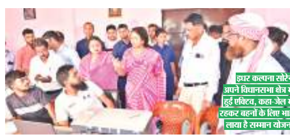
गिरिडीह की तेलोडीह पंचायत में जांच करने पहुंची कल्पना सोरेन.

उन्होंने सभी जिम्मेदार वरिय अफसरों के साथ बातचीत कर आ रही तकनीकी समस्याओं को तुरंत दूर करने का निर्देश दिया. सीएम ने लाभ लेने में देरी-बहनों को आ रही कठनायों को अतिशीघ्र दूर करने का निर्देश दिया.