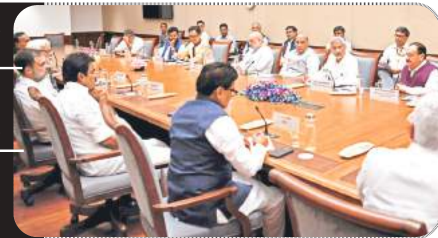
एजेंसी। नयी दिल्ली

हिंसा के दौरान अल्पसंख्यकों व हिंदुओं के घर तोड़ गए, हमले भी हुए, सरकार पड़ोसी देश से लगातार संपर्क में