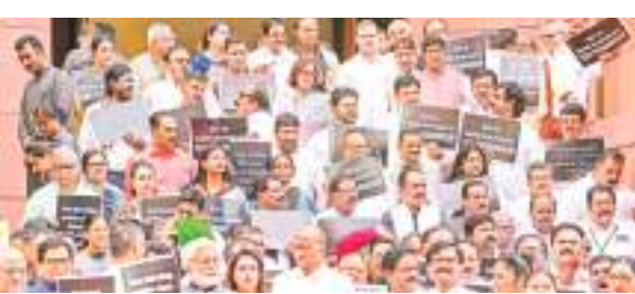
संसद परिसर में तख्तियां लेकर प्रदर्शन करते इंडिया गठबंधन के नेता.

विपक्षी दलों के सांसदों ने संसद भवन के मकर द्वार के सामने प्रदर्शन किया. उन्होंने हाथों में तख्तियां ले रखी थीं जिन पर स्वास्थ्य बीमा एवं जीवन बीमा से जीएटी खत्म करने की मांग लिखी हुई थी. जीएसटी खत्म करो के