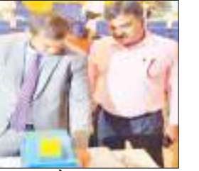
कार्यशाला में मुख्य निर्वाचन पदाधिकारी व आयोग के सचिव.

संवाददाता। रांची आगामी विधानसभा चुनाव की तैयारियों के क्रम में मुख्य निर्वाचन पदाधिकारी के. रवि कुमार की अध्यक्षता में सभी जिलों के जिला निर्वाचन पदाधिकारियों, उप निर्वाचन पदाधिकारियों व एफएलसी सुपरवाइजर के लिए ईवीएम और वीवीपैट के प्रथम स्तरीय निरीक्षण के लिए कार्यशाला का आयोजन किया गया. श्री कृष्ण लोक प्रशासन संस्थान में आयोजित एक दिवसीय कार्यशाला में मुख्य निर्वाचन पदाधिकारी के साथ भारत निर्वाचन आयोग के सचिव बीसी पात्रा, अपर सचिव राकेश कुमार, ईवीएम की नोडल