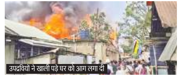
उपद्रवियों ने खाली पड़े घर को आग लगा दी

मणिपुर के जिरीबाम में शांति बहाल करने के प्रयासों के लिए मेइती और हमार समुदायों के बीच समझौता होने के एक दिन बाद ही तनाव पैदा करने वाली घटना सामने आई हैं जहां गोलीबारी की गई और एक खाली पड़े घर को आग लगा दी गई. अधिकारियों ने शनिवार को यह जानकारी दी. उन्होंने बताया कि लालपानी गांव में खाली पड़े एक घर को शुक्रवार रात हथियारबंद लोगों ने आग के हवाले कर दिया. एक अधिकारी ने बताया, यह घटना एक बिल्कुल ही अलग बस्ती में हुई जहां मेइती समुदाय के कुछ लोगों के घर हैं