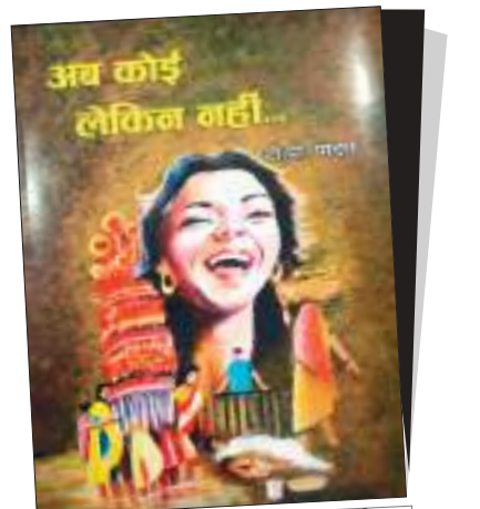
कथा-संग्रह : अब कोई लेकिन नहीं... प्रकाशक : बोधि प्रकाशन मूल्य : 200 रु. ( पेपर बैक )

अभिशाप है, जो दूरियों तो बढ़ा सकता है, मगर इंसान - इंसान को करीब लाकर एक दूसरे का सहयोगी नहीं बना सकता, जबतक कि आपस में निजी स्वार्थ निहित न हो. आबिदा एक चुड़ैलुहिन है, जो चूड़ियों से भरी टोकड़ी सर पर उठाये फेरी लगाकर अपने और आस पास के गांव में बेचती है. उनका और उसके पूरे परिवार का अपने और आस पास के गांवों के परिवार से, बल्कि उस व्यक्ति से भी जो अनाथ है, भावनात्मक और पारिवारिक रिश्ता सा जुड़ा होता है. वह दिन भर मेहनत करती है, फिर भी उसका परिवार अभावग्रस्त ही होता है. अकरम को यह अभाव हमेशा सालता रहता है. इसलिये वह जुर्म की दुनिया का रास्ता अख्तियार कर लेता है. आबिदा को जब इस सच्चाई का पता चलता है, तब उसे धक्का सा लगता है. उसे लगता है कि गांव वालों को जब अकरम की सच्चाई का पता चलेगा, उसकी सारी मान-प्रतिष्ठा, जिसे उसने पूरे जीवन को खपा कर अर्जित की है, वह धूमिल हो जाएगी. इसलिये वह रातोंरात सपरिवार गांव से पलायन कर जाती है.