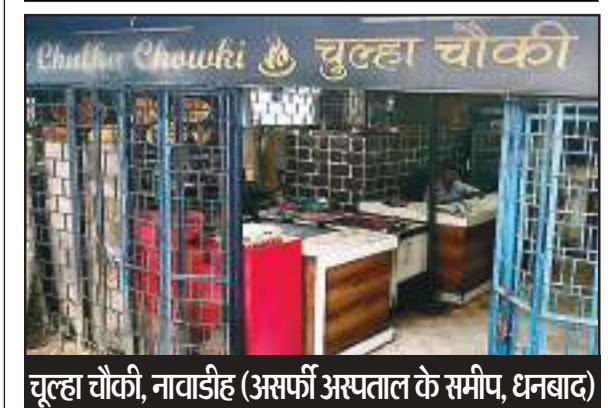
चूल्हा चौकी, नावाडीह (असर्पा अस्पताल के समीप, धनबाद)