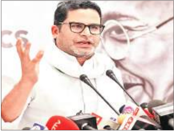
घोषणा करते जन सुराज के प्रमुख प्रशांत किशोर.

चुनावी रणनीतिकार और जन सुराज के प्रमुख प्रशांत किशोर ने शुक्रवार को बड़ा ऐलान किया है. उन्होंने कहा कि अगले वर्ष होने वाले विधानसभा चुनाव के बाद उनके दल की सरकार बननेगी तो 15 साल से कम के बच्चों की पूरी पढ़ाई का खर्च जिसमें उनकी किताबें से लेकर विद्यालय के कपड़े सब कुछ बिहार के बच्चों के लिए मुफ्त कर दी जाएगी. इसके साथ ही यह व्यवस्था केवल सरकारी स्कूलों में ही नहीं बल्कि सभी प्राइवेट स्कूलों में भी लागू होगी. प्राइवेट स्कूल में भी 15 वर्ष तक के बच्चों की पढ़ाई का खर्च सरकार देगी, ऐसी व्यवस्था हम करेंगे. इस तरह की व्यवस्था पूरे देश के किसी भी राज्य में अभी तक नहीं है. उन्होंने यह भी बताया कि नीतीश सरकार पढ़ाई के नाम पर हर वर्ष 50 हजार करोड़ खर्च कर रही है, पर आप ही बताइए कि उन 50 हजार करोड़ से क्या 50 बच्चे भी पढ़ें? लेकिन हमारा यह संकल्प है की हम इन्हें 50 हजार करोड़ को सही तरीके से खर्च करके आपके बच्चों को