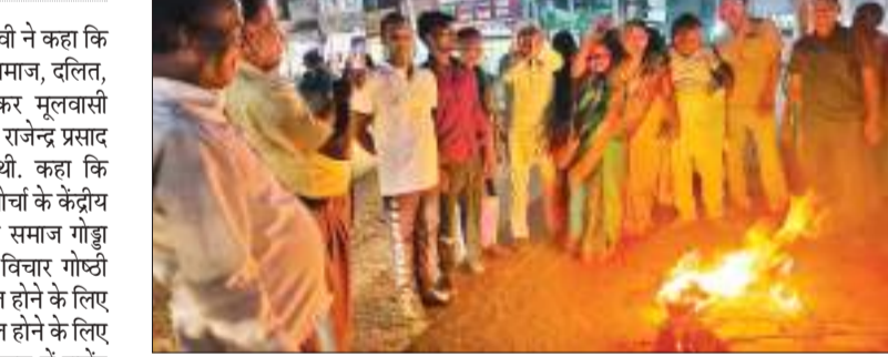
सांसद निशिकांत दुबे का पुतला दहन करते लोग।