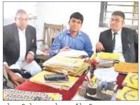
लोक अभियोजक दास के साथ बैठे अधिवक्ता।

आखिरकार शुभम संदेश की मुहिम रंग लायी, व्यवहार न्यायालय परिसर में जौन शीर्ष अवस्था में पड़े लोक अभियोजन कार्यालय का पुराना भवन को तोड़ कर वहां नया भवन बनाया जायेगा, भवन निर्माण विभाग ने इसकी निविदा फाइनल कर दी है, बिहार के संवेदक ने कार्य भी प्रारंभ कर दिया है, भवन को तोड़ा जा चुका है और परिसर को समतल किया जा रहा है, बता दें कि शुभम संदेश ने अपने 22.08.22 के अंक में पूरे प्रदेश के लोक अभियोजन कार्यालयों की बदहाली की एक खबर छापी थी, इसके अलावा शुभम