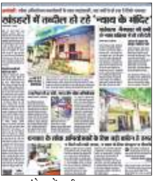
शुभम संदेश में छपी खबर