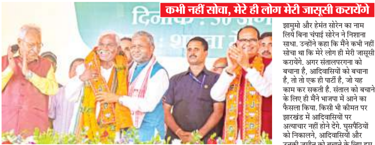
भाजपा में चंपाई सोरेन का स्वागत करते प्रदेश अध्यक्ष बाबूलाल मरांडी. साथ में हैं शिवराज सिंह चौहान व अन्य.