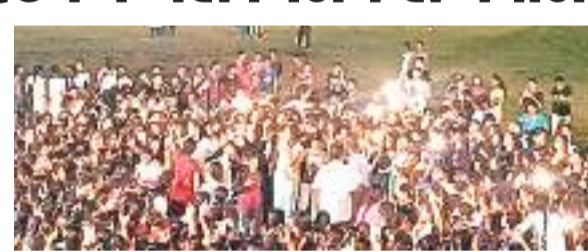
इंजीनियरिंग कॉलेज में गुरुवार की देर रात विरोध जताते छात्र-छात्राएं.