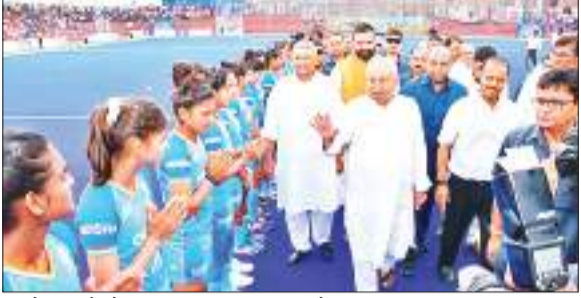
आयोजन को लेकर सीएम नीतीश कुमार ने जताई खुशी.

राजगीर के राज्य खेल अकादमी एवं बिहार खेल विश्वविद्यालय में 11 नवंबर से 20 नवंबर 2024 तक महिला एशियन चैंपियंस ट्रॉफी का आयोजन किया जाएगा. यह आयोजन हॉकी इंडिया और बिहार सरकार के सहयोग से होगा. इसमें डिफेंडिंग चैंपियन भारत के अलावा, ओलंपिक रजत पदक विजेता चीन, जापान, कोरिया, मलेशिया और थाईलैंड की टीम भाग लेने की उम्मीद है. बिहार के मुख्यमंत्री नीतीश कुमार ने कहा कि मैं 8वें महिला एशियन चैंपियंस ट्रॉफी की मेजबानी के लिए बिहार सरकार का सम्मन प्रदान करने के लिए बहुत खुश हूं. हम इस