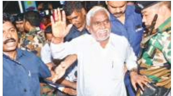
बुधवार को नयी दिल्ली से लौटने पर चंपाई सोरेन का समर्थकों ने जोरदार स्वागत किया। उन्होंने इस दौरान सबका अभिवादन किया।

पूर्व सीएम चंपाई सोरेन ने झामुमो की प्राथमिक सदस्यता और मंत्री पद के साथ विधायकी से भी इस्तीफा दे दिया है। उन्होंने सोशल मीडिया प्लेटफॉर्म एक्स पर एक पत्र जारी कर इस बात की जानकारी दी। अपना इस्तीफा विधानसभा अध्यक्ष को भेज दिया है। उन्होंने कहा कि आज झामुमो की प्राथमिक सदस्यता एवं सभी पदों से त्याग-पत्र दे दिया। झारखंड के आदित्यपुरियों, मूलवासियों, दलितों, पिछड़ों एवं आम लोगों के मुद्दों को लेकर हमारा संघर्ष जारी रहेगा। इससे पहले चंपाई ने रांची एयरपोर्ट पर मीडिया से बातचीत में कहा कि भाजपा का दामन थाने के लिए मैंने काफी सोच-समझ कर फैसला लिया है। 30 अगस्त को भाजपा में शामिल होंगे। उन्होंने कहा कि मेरे भाजपा में जाने के फैसले से सिर्फ कोल्हान में ही नहीं पूरे झारखंड की राजनीति में असर पड़ेगा। जासूसी कराए जाने के सवाल पर कहा कि सरकार जो चाहे करा ले, मैं डरने वाला नहीं हूँ, मैं सही निर्णय लिया है। झामुमो सुप्रीमो शिवू सोरेन के प्रति हमारे दिल में हमेशा आस्था बनी रहेगी।