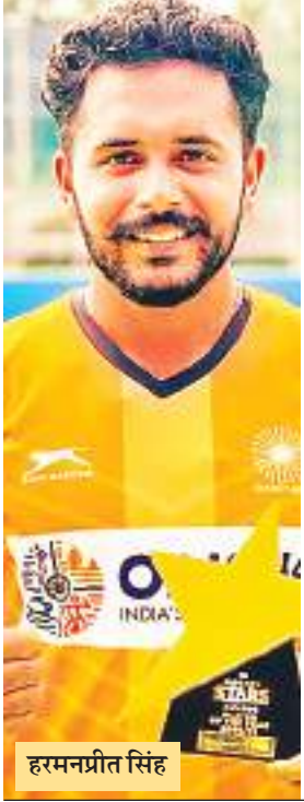
नयी दिल्ली

पीआर श्रीजेश के संन्यास के बाद आगामी एशियाई चैंपियंस ट्रॉफी के लिए कृशन बहादुर पाठक को हरमनप्रीत सिंह की कप्तानी वाली 18 सदस्यीय भारतीय हॉकी टीम का मुख्य गोलकीपर बनाया गया है। भारत के उदीयमान ड्रैग फ्लिकर जुगराज सिंह जूनियर के लिए भी यह सुनहरा मौका होगा। वह प्रो लीग में अपनी प्रतिभा की बागणी दे चुके हैं। अराइजीत सिंह हुंडल टीम में तीसरे ड्रैग फ्लिकर होंगे। डिफेंस का जिम्मा जरमनप्रीत सिंह, अमित रोहिदास, हरमनप्रीत सिंह, जुगराज सिंह, संजय और सुमित पर होगा। वहीं मिडफील्ड में राजकुमार पाल, नीलाकांता शर्मा,