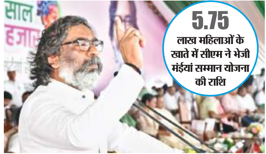
गम्हरिया के रापचा फुटबॉल मैदान में सीएम हेमंत सोरेन बुधवार को सभा को संबोधित करते हुए।

बता दें कि मुख्यमंत्री मंईयां सम्मान योजना के तहत 21 वर्ष से 50 वर्ष की 48 लाख से अधिक महिलाओं का निबंधन हो चुका है। 96 प्रतिशत से अधिक आवेदन को प्रशासनिक स्वीकृति दी जा चुकी है। इसके तहत हर महिला को प्रति माह एक हजार रुपये की राशि यानी सालाना 12 हजार रुपये सीधे उनके खाते में देने की योजना है। मुख्यमंत्री ने कहा कि झारखंड में मुझे जेल भिजवाने का काम किया। जब राज्य के नेताओं से हम काबू नहीं हुए तो मध्यप्रदेश और असम से नेताओं को पदस्थापित कर षडयंत्र रचने में लगी है। यह वीर सिंदो-कान्हू, वीर बिरसा मुंडा की धरती है, यहां हर चौहाने पर वीर शहीद झारखंडी मिलेंगे, हमलोग डरने वाले नहीं हैं।