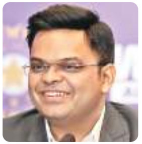
नयी दिल्ली

अगले छह साल तक जय शाह आईसीसी चेरमैन के पद पर बने रह सकते हैं