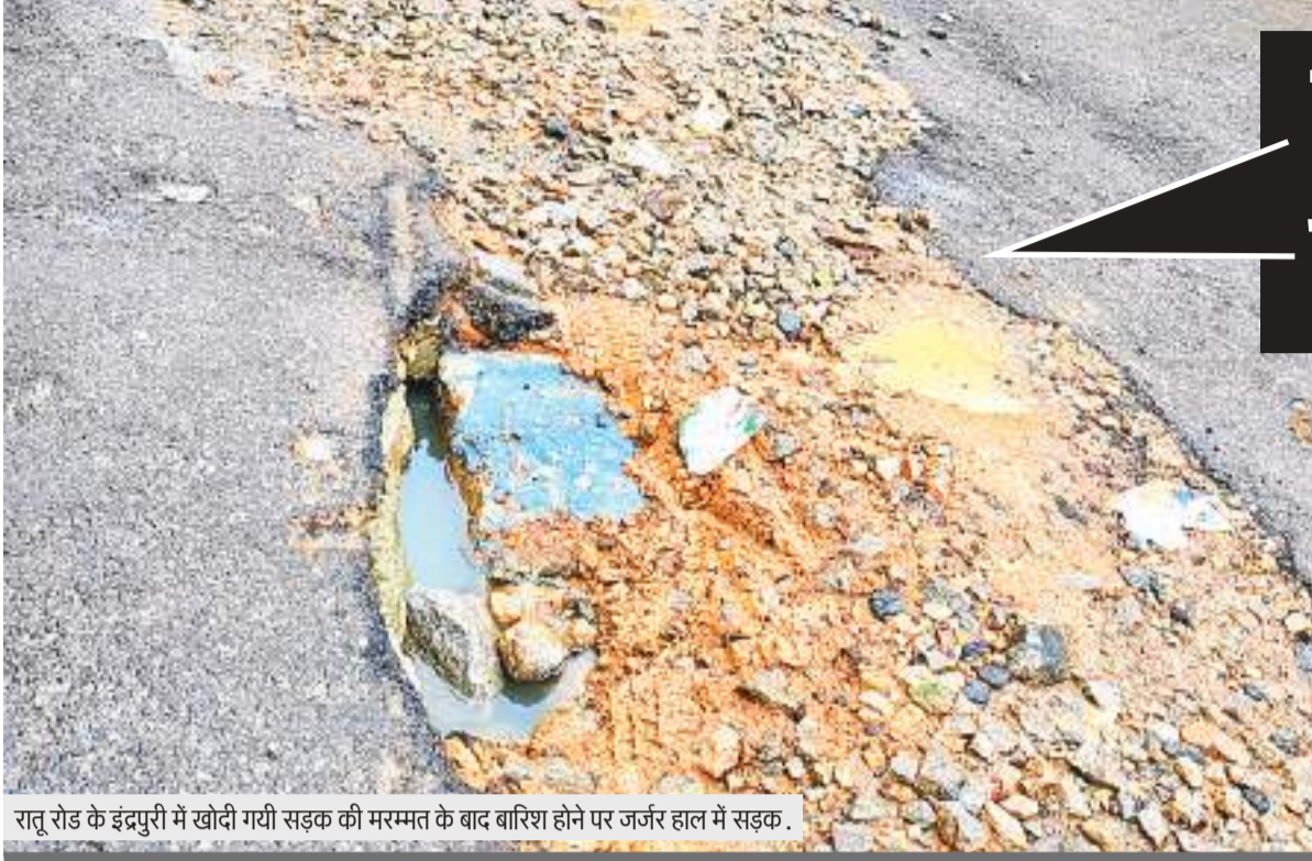
रातू रोड के इंद्रपुरी में खोदी गयी सड़क की मरम्मत के बाद बारिश होने पर जर्जर हाल में सड़क.