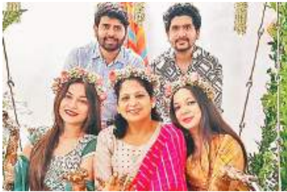
हरियाली तीज मनातीं मारवाड़ी समाज की सुहागन महिलाएं।

इसी भाव से विवाहितियों ने जहां महादेव और माता पार्वती की पूजा-अर्चना कर अखंड सौभाग्य की