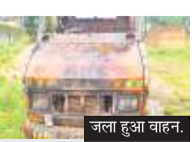
जला हुआ वाहन.