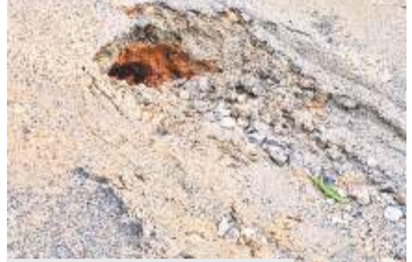
बरियातू रोड में मरम्मत की गयी सड़क में हो गये गड्ढे.

है कि लोग अब सड़क पर निकलने से डरते हैं। सड़क के बीचों-बीच पाइप बिछाने के लिए गड्ढा किया गया था। पाइप बिछा दी गयी, जिसके बाद सड़क की मरम्मत करने की जगह अब तो बारिश होने पर मिट्टी व डस्ट ने भी जवाब दे दिया। सड़क पर बीचों-बीच बड़े-बड़े गड्ढे बन चुके हैं। ऐसे में हमेशा किसी बड़ी दुर्घटना होने की आशंका बनी हुई रहती है। रातू रोड के अलावा बरियातू रोड, लालपुर से जेल मोड़ तक समेत अन्य सड़कों की स्थिति ऐसे ही है।