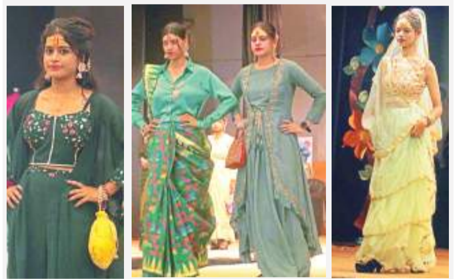
सावन महोत्सव के समापन समारोह में रैंप पर उतरीं छात्राएं।

डिजाइनिंग विभाग के द्वारा सावन थीम पर शिव वंदना के गीत पर अपने द्वारा बनाए गए परिधान में फैशन शो