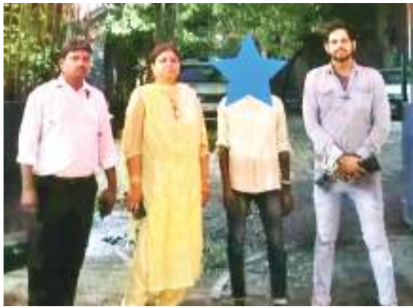
मुक्त कराया गया बालक।