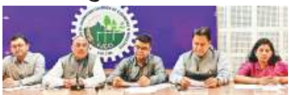
झारखंड चैंबर की कार्यकारिणी समिति की बैठक में शामिल पदाधिकारी।