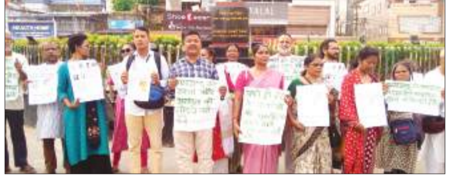
रांची में रविवार को विभिन्न संगठनों ने भाजपा की नीतियों के विरुद्ध पैदल मार्च किया।

हाल के दिनों में भाजपा नेताओं के बयान नफरत फैलाने वाला : इस दौरान कहा गया कि हाल में भाजपा व उसके प्रमुख नेता लगातार बयान दे रहे हैं कि झारखंड में बड़ी संख्या में बांग्लादेशी घुसपैठी आ रहे हैं। आदिवासियों की जनसंख्या कम हो रही है। आदिवासी लड़कियों से शादी कर रहे हैं, जमीन हथिया रहे हैं। लव जिहाद, लैंग जिहाद कर रहे हैं आदि। ऐसे भाषण देकर वे लगातार आदिवासियों व अन्य समुदायों में मुसलमानों के विरुद्ध नफरत फैलाने और विधान सभा चुनाव से पहले धार्मिक ध्रुवीकरण को कोशिश कर रहे हैं। भाजपा नेताओं द्वारा गलत आंकड़ों व झूठ के आधार पर