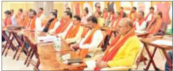
भाजपा एससी मोर्चा की बैठक में शामिल प्रतिनिधिगण।

भाजपा एससी मोर्चा के राष्ट्रीय महामंत्री सह झारखंड के प्रभारी भोला सिंह ने आगामी विधानसभा चुनाव को लेकर कार्य योजना झारखंड के सभी अनुसूचित जाति छात्रवास में जाकर छात्रों से मुलाकात कर उनकी सूची बनाने, प्रदेश के सभी सामान्य छात्रवास में भी एससी छात्रवास में जाकर सभी विधानसभा क्षेत्र के छात्रों से जुड़कर उनकी समस्याओं से रूबरू होना और पार्टी के नीति सिद्धांत के बारे में उन्हें जानकारी देते हुए भाजपा के साथ जोड़ने का निर्देश दिया गया है। इसके साथ ही प्रदेश के सभी बस्ती में जाकर अनुसूचित जाति के लोगों से उनकी बात सुनकर व उनकी समस्याओं से रूबरू होने का निर्देश दिया गया है। सिंह रविवार को भाजपा एससी मोर्चा की बैठक में बोल रहे थे। उन्होंने कहा कि सभी पदाधिकारियों को हर घर तिरंगा कार्यक्रम करने, मां के नाम से पेड़ लगाना, प्रदेश के सभी छात्रवास व कॉलेज में जाकर वृक्षारोपण करना,