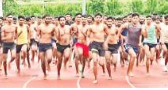
सेना बहाली में दौड़ लगाते हजारीबाग, रामगढ़ और दुमका के युवाक।

पर पहुंच रहे हैं। उन सभी उम्मीदवारों को एडमिट कार्ड मुहिया करवाया जा रहा है। बता दें कि सोमवार को अग्निवीर जीडी श्रेणी के लिए