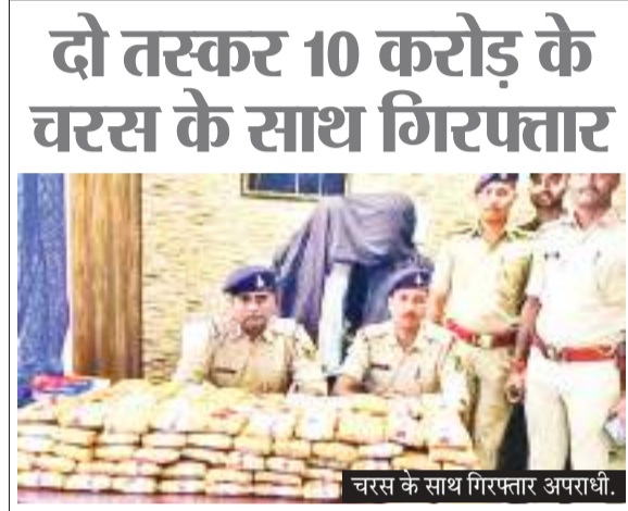
चरस के साथ गिरफ्तार अपराधी।