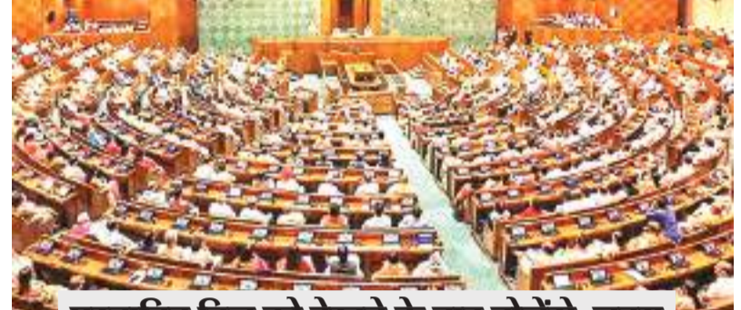
प्रस्तावित बिल को देखने के बाद बोलेंगे: जदयू

पीएम नरेंद्र मोदी के नेतृत्व वाली एनडीए सरकार वक्फ अधिनियम में संशोधन करने की तैयारी में है। सूत्रों ने बताया कि शुरुआत को कैबिनेट ने वक्फ एक्ट में कुल 40 संशोधनों को मंजूरी दे दी। विधेयक में वक्फ अधिनियम की धारा 9 और धारा 14 में संशोधन का भी प्रस्ताव है। बोर्ड की संरचना में परिवर्तन का भी प्रस्ताव है। निकायों में महिलाओं को प्रतिनिधित्व देने का प्रस्ताव है। इन संशोधनों के पारित होने के बाद वक्फ बोर्ड की शक्तियां सीमित हो जाएंगी। सूत्रों के अनुसार, इन संशोधनों का उद्देश्य किसी भी संघर्ष को 'वक्फ संघर्ष' के रूप में नामित करने के वक्फ बोर्ड के अधिकार को प्रतिबंधित करना है।