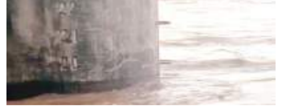
उत्तरी कोयल बराज से बढ़ा हुआ जल स्तर.

हुसैनाबाद/गढ़वा। देवरी कला में उत्तरी कोयल बराज का जल स्तर खतरे के निशान से दो फीट नीचे यानी 19.5 फीट पर है। अनुमंडल प्रशासन ने आम लोगों से गढ़वा के लोहरगड़ा अपील की है कि सोन नदी के नजदीक ना जाएं, स्थानीय और मैरौनी गांव प्रशासन ने झारखंड-बिहार को जोड़ने वाले नाला घाट को बंद कर दिया है। इधर, रविवार की देर रात गढ़वा जिला के हरिहरपुर के लोहरगड़ा और मैरौनी गांव के ग्रामीण फंसे। पास सोन नदी का जलस्तर अचानक बढ़ने से एक दर्जन ग्रामीण फंस गये, सूचना पर जिला प्रशासन को टीम मौके पर पहुंची और राहत-बचाव में जुट गयी थी। रात में ही एसडीआरएफ को भी सूचना दे दी गयी थी।