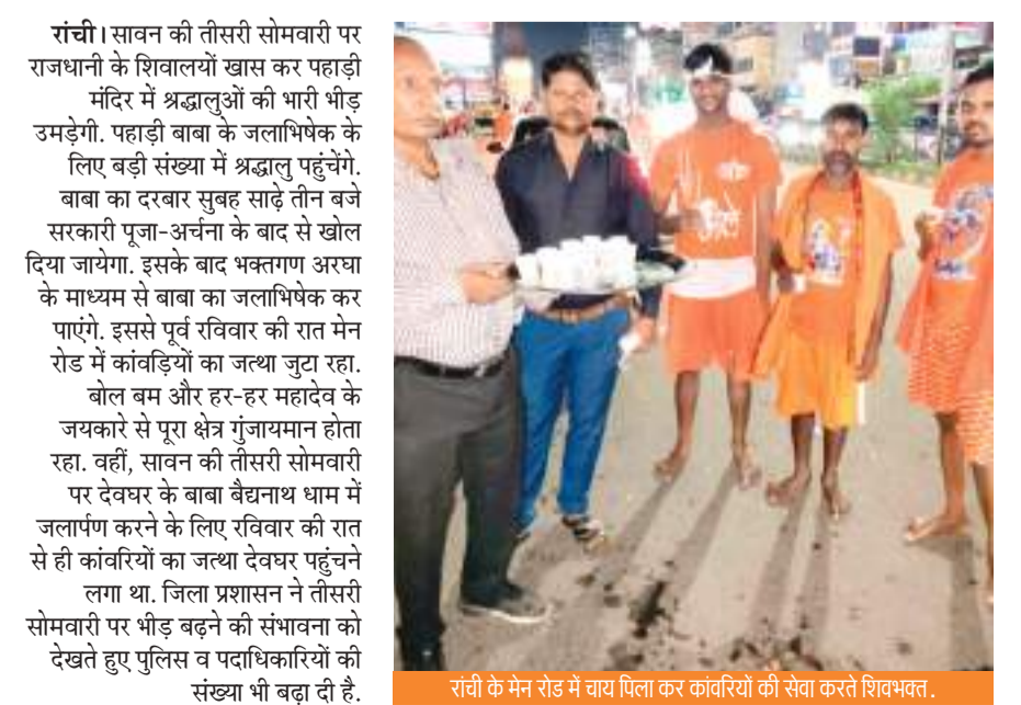
रांची के मैन रोड में चाय पिला कर कांवड़ियों की सेवा करते शिवभक्त.

रांची। सावन की तीसरी सोमवारी पर राजधानी के शिवालयों खास कर पहाड़ी मंदिर में श्रद्धालुओं की भारी भीड़ उमड़ेंगी। पहाड़ी बाबा के जलाभिषेक के लिए बड़ी संख्या में श्रद्धालु पहुंचेंगे। बाबा का दरबार सुबह साढ़े तीन बजे सरकारी पूजा-अर्चना के बाद से खोल दिया जायेगा। इसके बाद भक्तगण अस्था के माध्यम से बाबा का जलाभिषेक कर पाएंगे। इससे पूर्व रविवार की रात मैन रोड में कांवड़ियों का जत्था जुटा रहा। बोल बम और हर-हर महादेव के जयकारे से पूरा क्षेत्र गुंजायमान होता रहा। वहीं, सावन की तीसरी सोमवारी पर देवघर के बाबा बैद्यनाथ धाम में जलापण करने के लिए रविवार की रात से ही कांवड़ियों का जत्था देवघर पहुंचने लगा था। जिला प्रशासन ने तीसरी सोमवारी पर भीड़ बढ़ने की संभावना को देखते हुए पुलिस व पदाधिकारियों की संख्या भी बढ़ा दी है।