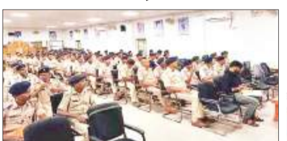
वर्कशॉप में शामिल पुलिसकर्मी।