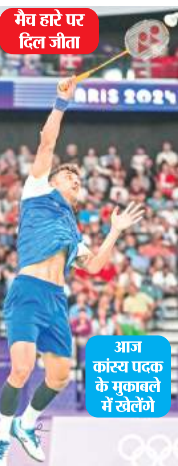
मैच हारे पर दिल जीता