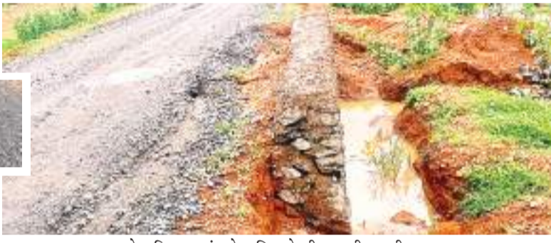
बालूमाथ एनएच-22 से बारियातू प्रखंड के राहिया के बीच आधी-अधूरी सड़क.

लातेहार जिले में ऐसे भी संवेदक हैं, जिन्हें एक- दो नहीं बल्कि दर्जन भर से अधिक कार्य विभाग की मेहरबानी से मिले हुए हैं. हालांकि, संवेदक द्वारा योजनाए लटका दी जा रही हैं. यही नहीं पीएमजीएसवाई के कार्यों में एटीआर लगने के बावजूद नियमों की अन्देखी कर विभाग द्वारा संवेदक को कार्य आवंटित किये जा रहे हैं. विभाग की मेहरबानी से लातेहार जिले के मां यशोदा कंस्ट्रक्शन चंदवा को एक दर्जन से अधिक योजनाओं का काम मिला हुआ है. इसकी प्राबल्यन राशि तकरीबन 70 करोड़ रुपये है. लेकिन संवेदक द्वारा हर योजना में नाम मात्र का कार्य कर उसे अधूरा छोड़ दिया गया है.