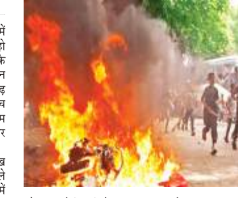
और फिर दोनों पक्षों के बीच झड़प शुरू हो गई। कुछ ही देर में बवाल इतना बढ़ गया कि आक्रोशित लोगों

बांग्लादेश की राजधानी ढाका में एक बार फिर विरोध प्रदर्शन शुरू हो गए हैं। प्रधानमंत्री शेख हसीना के इस्तीफे की मांग को लेकर प्रदर्शन कर रहे सैकड़ों लोगों और सत्तारूढ़ अवाामी लीग के समर्थकों के बीच रविवार को खूनी झड़प में कम से कम 75 लोगों की मौत हो गई और सैकड़ों अन्य घायल हुए हैं।