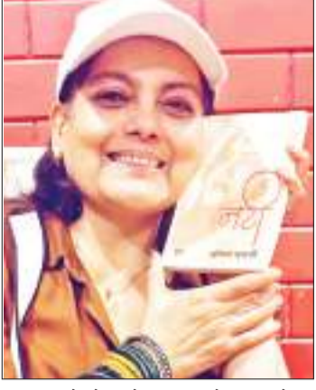
उस जमाने में चाहे रंगमंच हो या सिनेमा,

बॉलीवुड की प्रख्यात अभिनेत्री सुष्मिता मुखर्जी द्वारा लिखित नाटक 'नटी-एक मूल नाट्य' प्रकाशित होकर अब पाठकों के लिए उपलब्ध हो चुका है। यह नाटक सामाजिक रूढ़ियों को चीर कर रंगमंच से अदाकारी की छटा बिखेरने वाली 'विनोदिनी' के जीवन-वृत्त पर आधारित है। यह सुष्मिता मुखर्जी की पांचवीं प्रकाशित पुस्तक है।