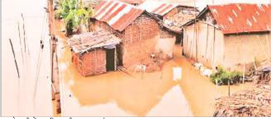
बाढ़ के पानी में डूबा बिहारशरीफ का एक गांव।

हिलसा अनुमंडल क्षेत्र के लोकईन नदी में उफान आने से नालंदा में बाढ़ की स्थिति उत्पन्न हो गई है, बढ़ते जलस्तर से नदी किनारे तटबंध टूट गया है, जिससे तकरीबन 100 घर पानी से थिर गए हैं। हिलसा अनुमंडल क्षेत्र में 100 एकड़ खेतों में लगी धान की फसल नष्ट हो गई है। अनुमंडलीय एवं जिला जिला प्रशासन ने मौके पर पहुंचकर स्थिति का जायजा ले रहे हैं। हिलसा अनुमंडल क्षेत्र के ग्रामीणों ने कहा कि बीते दो दिनों से लगातार बारिश होने के कारण लोकईन नदी में उफान आ गया है।