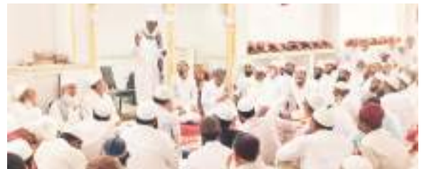
कांके के पतराटोली स्थित जामा मस्जिद में बैठक करते उलेमा।