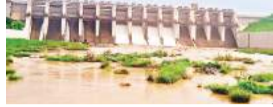
चांडिल डैम के खोल गये चारों रेडियल गेट.

चांडिल। पिछले दो दिनों से रूक्का-रूक्का कर हो रही बारिश के कारण चांडिल डैम का जल स्तर बढ़ गया है। ऐहतियात के तौर पर रविवार की सुबह आठ बजे डैम के चार रेडियल गेट 10-10 सेंटीमीटर खोल दिया गया। सुबह डैम का जल स्तर 181.25 मीटर दर्ज किया गया। रेडियल गेट खोले जाने के बाद लगातार बढ़ रहे डैम के जल स्तर में स्थिरता आई है। हालांकि, शाम में एक गेट को 25 सेंटीमी तक बढ़ा कर 35 सेंटीमी तक खोल दिया गया, जबकि शेष तीन गेट 10-10 सेंटीमी तक ही खुले रहे। इसके पूर्व गुरुवार को सुबह भी चांडिल डैम का पांच रेडियल गेट खोला गया था और शाम में सभी गेट को बंद कर दिया गया था।