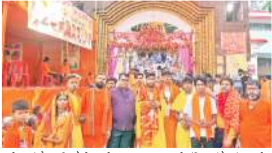
रानी चुआं से 21 किलोमीटर की यात्रा तय कर पहाड़ी मंदिर पहुंचे कांवरयात्री।