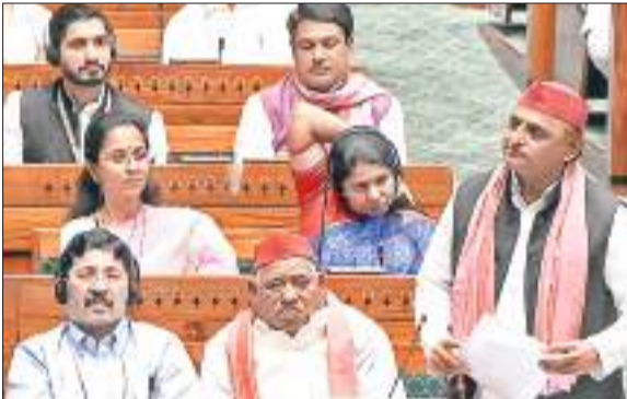
विकास के नाम पर अटकों का भ्रष्टाचार

समाजवादी पार्टी के अध्यक्ष अखिलेश यादव ने मंगलवार को कहा कि इस लोकसभा चुनाव में सकारात्मक राजनीति की जीत हुई, गत चार जून को सांप्रदायिक राजनीति से देश को आजादी मिली तथा सामुदायिक राजनीति की शुरुआत हुई। उन्होंने राष्ट्रपति के अभिभाषण पर लोकसभा में आए हुए धन्यवाद प्रस्ताव पर चर्चा में भाग लेते हुए यह भी कहा कि इंडिया गठबंधन ने विपक्षी इंडिया गठबंधन को भी जिम्मेदारी का पैगाम दिया है। उन्होंने यह भी कहा कि यदि उनकी पार्टी उत्तर प्रदेश की सभी 80 लोकसभा सीट जीत जाए, तब भी उन्हें इवीएम पर भरोसा नहीं होगा। यादव ने कहा, चार जून देश के लिए सांप्रदायिक राजनीतिक से आजादी का दिन था। सांप्रदायिक राजनीति का अंत हुआ और सामुदायिक राजनीति की शुरुआत हुई। इस चुनाव में सांप्रदायिक राजनीति की हमेशा के लिए हार हो गई। उन्होंने कहा, सकारात्मक राजनीति की जीत हुई है, हम मानते हैं कि संविधान ही संप्रदायिक राजनीति की जीत हुई है। देश जनमर्जी से ही चलेगा : सपा संसद ने कहा कि देश किसी की निजी महात्वाकांक्षा से नहीं, बल्कि जन आकांक्षा से चलेगा, और अब मानमर्जी नहीं, बल्कि जनमर्जी चलेगी। यादव ने आरोप लगाया कि इस सरकार ने आरक्षण के साथ