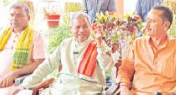
भाजपा के प्रदेश अध्यक्ष बाबूलाल मरांडी गिरिडीह में प्रेस कॉन्फ्रेंस करते हुए.

हिंदुत्व का नारा विश्व कल्याण का है, विश्व बंधुत्व डीएनए में