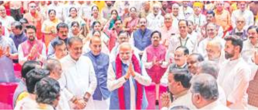
एनडीए के बैठक में शामिल होने जाते प्रधानमंत्री नरेंद्र मोदी.

प्रधानमंत्री नरेंद्र मोदी ने मंगलवार को एनडीए के सांसदों से संसदीय नियमों एवं आचरण का पालन करने तथा वरिष्ठ सदस्यों से सर्वश्रेष्ठ प्रथाओं के बारे में सीखने को कहा। एनडीए सांसदों के लिए पीएम मोदी की यह सलाह लोकसभा में विपक्ष के नेता राहुल गांधी के उस भाषण के एक दिन बाद आई है, जिसे सत्कारुद्ध गठबंधन के नेताओं ने बेहद गैरजिम्मेदाराना करार दिया था। सूत्रों के मुताबिक, राजग संसदीय दल की बैठक को संबोधित करते हुए मोदी ने कहा कि विपक्ष इस बात से परेशान है कि पहली बार कोई गैर कांग्रेसी नेता