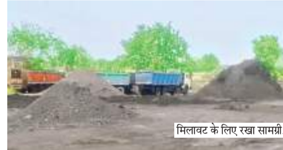
मिलावट के लिए रखा सामग्री।