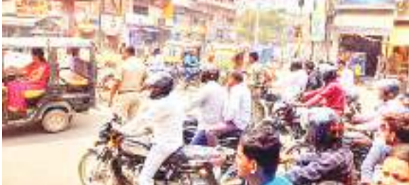
रेंडमा चौक पर लगा जाम.

कहों पर भी खड़े हो जाते हैं. वही सड़क पर आड़े तिरछे खड़े वाहन जाम का मुख्य कारण बन रहे हैं. इस कारण लोगों को दस मिनट के रास्ते आधा घंटे में तय करना पड़ रहा है.वही शहर के पंजाब नेशनल बैंक