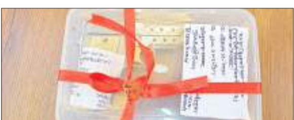
पुलिस ने आरोपियों से कट्टा और बाइक भी बरामद की.