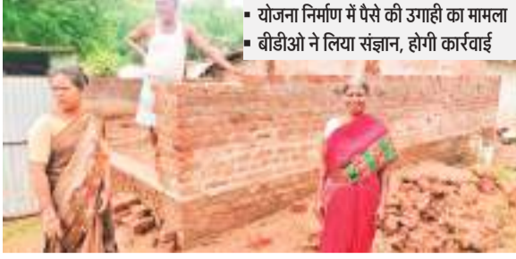
निर्मित अबुआ आवास योजना का निरीक्षण कर जायजा लेती मुखिया.

जिले के सेन्हा प्रखंड क्षेत्र में इन दिनों अबुआ आवास योजना में बिचौलिया के द्वारा प्रशासन को चुनौती देते हुए अवैध रूप से पैसों की उगाही लाभुकों को डरा धमकाकर किए जाने का मामला प्रकाश में आया है. यहां पर बता दें कि सेन्हा प्रखंड क्षेत्र अंतर्गत ग्राम पंचायत अरुं पंचायत क्षेत्र में अबुआ आवास योजना में बिचौलिया हावी हैं और लाभुकों से कर रहे हैं अवैध रूप से पैसों की उगाही. इधर इस मामले का खुलासा अरुं पंचायत अंतर्गत जोगाना ग्राम भ्रमण के दौरान ग्रामीण व लाभुक ने मुखिया के