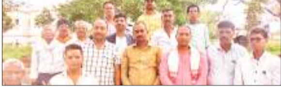
जिला कमेटी की बैठक में भाग लेते प्रजापति समाज के लोग.