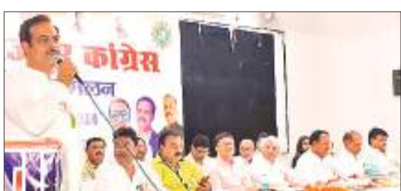
हजारीबाग में राष्ट्रीय मजदूर कांग्रेस के सम्मेलन को संबोधित करते वक्ता.