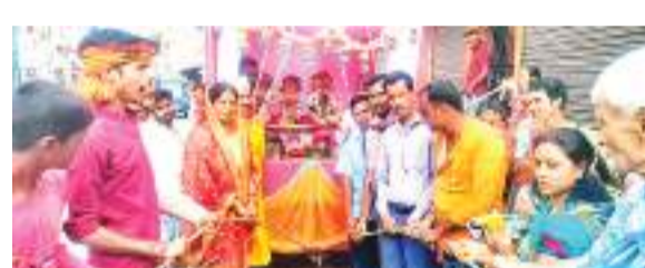
लातेहार : प्रभु जगन्नाथ के रथ को उत्साह के साथ खिंचते श्रद्धालु.

गायत्री मंदिर रोड, अरुण शुक्ला रोड होते हुए पुनः हरे कृष्ण निवास पहुंचा. रथयात्रा में मायापुर