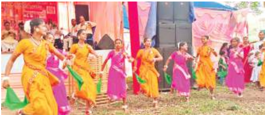
फोटो:कार्यक्रम में प्रस्तुति देते कलाकार.