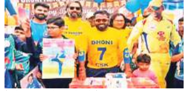
धोनी के जन्मदिन पर केक काटते उनके फैंस।