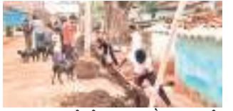
श्रमदान कर नाली की मरम्मत करते मुहल्लावासी.

कैरो/लोहरदगा। कैरो प्रखंड मुख्यालय स्थित रविदास मुहल्ला में रविदास विकास मंच के सदस्यों ने श्रमदान कर नाली की सफाई किया. विदित है कि रविदास मुहल्ला में बरसात की शुरूआती बारिश होते ही जल-जमाव होना शुरू हो जाता है. जिससे सड़क में पानी भर आता है. रविदास विकास मंच के सदस्यों ने श्रमदान कर सफाई करते हुए मुहल्ला वासियों से अपील किया कि सभी लोग अपने घर का कचड़ा ऐसे जगह पर फेंके जो की नाली से कुछ दूर हो या नाडेप में जमा कर दें. वहीं साफ-सफाई पर लोगों को प्रेरित करते हुए नाली से निकाले गए कूड़ा-कचड़ा को ट्रैक्टर में लोड कर एक निश्चित स्थान में निष्पादित किया.