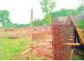
बिना नक्शा का निर्माणधीन बाउंड्री.