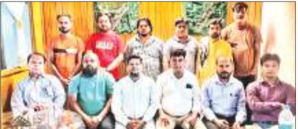
बैठक में शामिल मुस्लिम लीग के नेतागण.