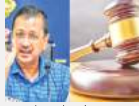
लगाया है. यह पैसा गोवा गया. खुद केजरीवाल ने अपने उम्मीदवारों से कहा था कि पैसे की चिंता ना करें, चुनाव लड़ें.