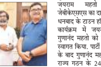
झारखंड के निजी विद्यालयों की समस्याओं को सुना और आरटीई से संबंधित कठिन शर्तों पर विस्तृत चर्चा की गई. जमीन की बाध्दता के अनुपालन में निजी विद्यालयों को हो रही कठिनाइयों को विस्तार से समझाया गया.