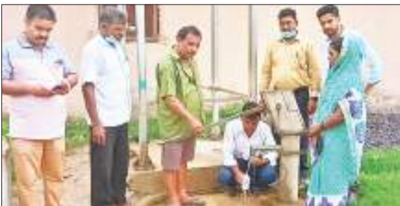
चापाकल से पानी का नमूना लेते कर्मी.