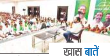
योजनाओं के संबंध में उठ रहे जिज्ञासाओं को शांत किया तथा संगठन की मजबूती के लिए वृथ स्तर पर कार्यक्रम करने की बात की गई.बैठक में बोकारो व धनबाद जिला के जिला समिति के सभी पदाधिकारी, वर्ग संगठनों के अध्यक्ष एवं सचिव, नगर,महानगर समिति के पदाधिकारी, प्रखंड समिति के

विधानसभा चुनाव के मद्देनजर झामुो का जिलावार बैठक जारी है. सोमवार को हरमू सोहराई भवन में बोकारो और धनबाद जिला के पंचायत स्तरीय कार्यकर्ताओं की बैठक हुई. इसमें राज्य सरकार द्वारा चलाए जा रही लोक कल्याणकारी योजनाओं के प्रचार-प्रसार तथा सांगठनिक रूप से युद्ध स्तर पर कार्यक्रमों को आयोजित कर योजनाओं का लाभ राज्य के अंतिम व्यक्ति तक पहुंचाने का कार्य सुनिश्चित करने का निर्णय लिया गया. केंद्रीय महासचिव विनोद कुमार पांडेय ने बैठक में आए कार्यकर्ताओं के मन में राज्य की लोककल्याणकारी