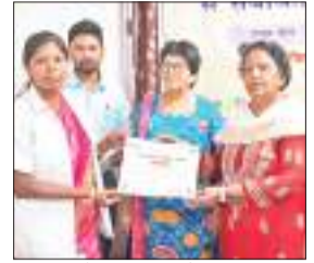
प्रशिक्षु को प्रमाणपत्र देती सीएस।

सिविल सर्जन कार्यालय के सभागार में शुक्रवार को जिला स्तरीय मदस एक्सल्यूट अफेक्शन कार्यक्रम से संबंधित चार दिवसीय प्रशिक्षण का समापन किया गया। इसमें मुख्य रूप से सभी प्रखंडों से आए एनएम को प्रशिक्षण दिया गया। इस दौरान मुख्य रूप से नवजात बच्चों को स्तनपान कराने की वास्तविक विधि, बच्चे को स्तन से लगाने की स्थिति, बच्चे और मां के लिए पूरक आहार आदि के बारे में बताया गया। बताया गया कि छह महीने तक बच्चों को केवल मां का ही दूध पिलाना चाहिए और छह महीने बाद बच्चों को क्या-क्या पूरक आहार देना चाहिए यह भी बताया गया। अन्य कोई दूध यदि बच्चे को दिया जाए तो बच्चे के स्वास्थ्य पर प्रतिकूल प्रभाव डाल सकता है। साथ ही यह भी बताया गया कि समुदाय में कार्य करने वाले फ्रंट लाइन वर्कर या सहिया देवी किस तरह से माताओं से बातचीत करें कि उन्हें स्तनपान कराने की प्रेरणा मिले। सभी प्रशिक्षुओं को