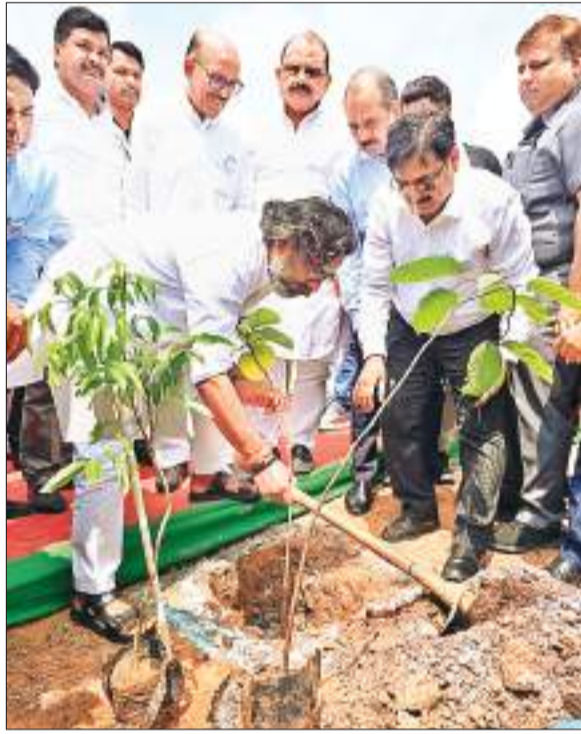
विधानसभा परिसर में शुक्रवार को पौधरोपण करते सीएम हेमंत सोरेन।

झारखंड विधानसभा और वन विभाग द्वारा विधानसभा परिसर में 75वें राज्यव्यापी वन महोत्सव का आयोजन किया गया। मौके पर विधानसभा परिसर में विधानसभा अध्यक्ष रवींद्र नाथ महतो और मुख्यमंत्री हेमंत सोरेन ने पौधरोपण किया। मुख्यमंत्री हेमंत सोरेन ने कहा कि एक वक्त था, जब झारखंड में पौधरोपण की कोई जरूरत नहीं थी। जल जंगल और जमीन झारखंड की पहचान रही है। एक ऐसा भी वक्त था जब राज्य में चारों ओर घने जंगल थे। हर तरफ हरियाली ही हरियाली थी। उसी दौरान यहां पौधरोपण की कोई जरूरत नहीं पड़ती थी। लेकिन, जैसे-जैसे विकास की ओर बढ़ते गए, जंगलों पर खतरा पैदा होता गया। उद्योग-धंधों का विस्तार, बड़े पैमाने पर खनन कार्य होने और पुल-पुलिया व सड़कों का जाल बिछाने समेत कई अन्य कारणों से बड़े पैमाने पर पेड़ों का काटना पड़ा जहां जंगल हुआ करते थे, वहां कंक्रीट के जंगल बन गए। प्राकृतिक व्यवस्था में हस्तक्षेप का सीधा असर पर्यावरण पर पड़ा। प्रकृति का संतुलन बिगड़ने से आज हमें तरह-तरह की चुनौतियों का सामना करना पड़ रहा है। अगर नहीं चेते तो इसके गंभीर परिणाम भुगतने को तैयार रहना होगा। ऐसे में ज्यादा से ज्यादा पौधे लगाने के लिए सभी को आगे आना होगा, सभी पर्यावरण के