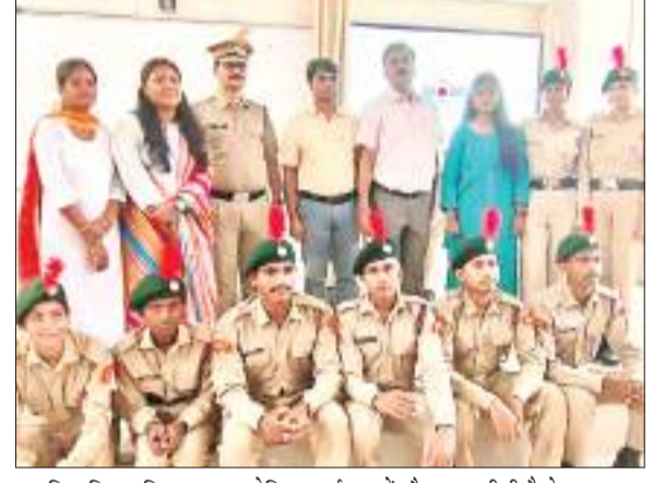
कारगिल विजय दिवस पर आयोजित कार्यक्रम में मौजूद एनसीसी कैडेट व अन्य।