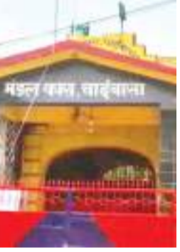
के बीच गंभीर चर्चा का विषय बना हुआ है।

हाल के वर्षों में झारखंड में नई परंपरा शुरू हुई है। बड़े और ऑर्गेनाइज्ड क्राइम में शामिल दुर्दात अपराधियों को सेंट्रल जेल में रखने के बदले मंडल कारा में रखा जाने लगा है। इससे मंडल कारा की सुरक्षा पर गंभीर खतरा पैदा होने की आशंका है। चाईबासा मंडल कारा में स्थानांतरित करने को गंभीर खतरा बताया है। साथ ही आग्रह किया है कि दुर्दात अपराधियों को सेंट्रल जेल में ही रखा जाये। क्योंकि सेंट्रल जेल में पर्याप्त सुरक्षा व्यवस्था, जरूरी आधारभूत संरचना व संसाधन और मैनपावर उपलब्ध है। चाईबासा मंडल कारा अधीक्षक के इस पत्र के बाद जेल प्रशासन के अफसरों