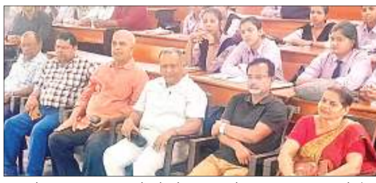
विभावि के राजनीति विज्ञान विभाग में "शोध में विषय चयन के महत्व" पर हुए व्याख्यान में मौजूद प्रोफेसर।