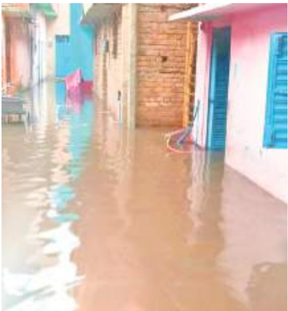
बागबेड़ा के निचले इलाके में जमा बारिश का पानी

वहीं मुसलाधार वर्षा से कोल्हान के सबसे बड़े सरकारी अस्पताल एमजीएम में जगह-जगह पानी भर गया. जिसके कारण मरीजों एवं अटेंडरों को आने-जाने में दिक्कतों का सामना करना पड़ा. खासकर शिशु रोग विभाग के