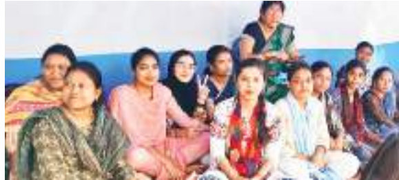
अनिश्चितकालीन हड़ताल में शामिल महिला कर्मचारी.

काला बिल्ला लगाकर कार्य करना, कलमबंद हड़ताल करना, कैडल