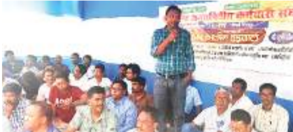
अनिश्चितकालीन हड़ताल में शामिल समाहरणालय के कर्मचारी.

झारखंड राज्य अनुसूचितव्यय कर्मचारी संघ (समाहरणालय संवर्ग) के राज्य नेतृत्व के आह्वान पर नौ सूत्री मांगों को लेकर समाहरणालय के कर्मचारी सोमवार से अनिश्चितकालीन हड़ताल पर चले गए हैं। राज्य स्तरीय संघ द्वारा दो वर्षों से अपनी मांगों के प्रति सरकार को ध्यानकर्षित करते रहे हैं। मुख्य सचिव, झारखंड सरकार से भी पत्र के माध्यम से अपनी जायज मांगों से अवगत कराते रहे हैं। सरकार के स्तर से किसी तरह की दो वर्षों तक