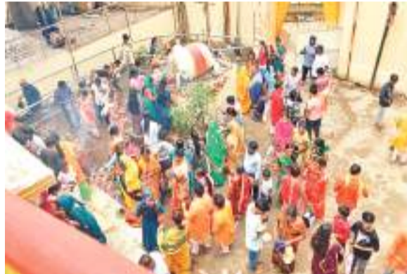
मंदिर में भोले नाथ की पूजा और जलाभिषेक करने पहुंचे लोग.

सावन की पहली सोमवारी पर चांडिल अनुमंडल में सबसे अधिक भीड़ जयदा स्थित ऐतिहासिक बुढाबाबा शिव मंदिर और दलमा बाबा गुफा मंदिर में देखा गया। यहां श्रद्धालु अपने आराध्य के दर्शन-पूजन के लिए पहुंचे और सोमवारी के अवसर पर शिव लिंग पर जलाभिषेक किया। इसके अलावा जारागोडीह शिव मंदिर, ईचागढ़ के चतुर्मुखी शिव मंदिर समेत चांडिल, ईचागढ़, नीमडीह और कुकड़ प्रखंड के सभी शिवालयों में भक्तों की भीड़ उमड़ी। इस दौरान शिवालय हर-हर महादेव से गूंज उठा। चारों ओर भक्ति का माहौल बन गया और लोग महादेव की आराधना में लीन रहे। इस वर्ष सावन में पांच सोमवार पड़ रहा है, जो शुभ फलदायी है।