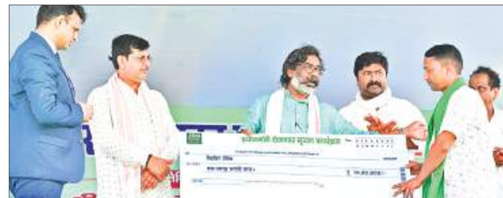
राजमहल में सोमवार को लाभुको चेक देते सीएम हेमंत सोरेन.

मुख्यमंत्री हेमंत सोरेन साहिबगंज जिले के बरहेट प्रखंड अंतर्गत सिंगा मैदान में आयोजित 132/33 केवी ग्रीड सब-स्टेशन (बरहेट) एवं 132 केवी (पाकुड़-राजमहल) डबल सर्किट लिलो ट्रांसमिशन लाइन का उद्घाटन किया। इस मौके पर उन्होंने करीब 88 करोड़ 84 लाख की 34 विकास योजनाओं का उद्घाटन- शिलान्यास किया। करीब 86 करोड़ 80 लाख रुपये की 31 योजनाओं की आधारशिला एवं तीन योजनाओं का उद्घाटन शामिल है। राजमहल एवं बरहेट में आयोजित कार्यक्रमों में 10 हजार 141 लाभुकों को सशक्त बनाने के उद्देश्य से उनके बीच 38 करोड़ 80 लाख रुपये से ज्यादा की परिसंपत्तियां बांटीं। कार्यक्रम में राजमहल सांसद विजय हांसदा, विधायक अनंत ओझा, मुख्यमंत्री के अपर मुख्य सचिव अविनाश कुमार, उपायुक्त एवं पुलिस अधीक्षक समेत कई अधिकारी मौजूद थे।