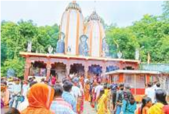
पहली सोमवारी को मंदिर में जलाभिषेक के लिए उमड़ी श्रद्धालुओं की भीड़.

सावन महीने की शुरुआत सोमवार से हुई है। पहली सोमवारी से चांडिल अनुमंडल क्षेत्र का वातावरण शिवमय हो गया है। इस पावन अवसर पर शिव का ध्यान कर भक्तों ने व्रत का संकल्प लिया। सावन का पहला दिन ही सोमवार पड़ा, ऐसे में शिव भक्तों का उत्साह चरम पर देखा गया। पहली सोमवारी होने के कारण शिवालयों में उमड़ी शिवभक्त आये। भोले नाथ के दर्शन-पूजन के लिए शिवालयों में भक्तों का तांता लगा रहा। अहले सुबह से ही मंदिरों में भक्तों का जमावड़ा होने लगा था। शिव भक्तों ने भगवान भोलेनाथ को बेलपत्र, धतूरा, भांग आदि अर्पण किए।