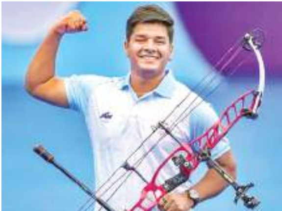
लेकिन उन्होंने भारतीय टीम के लिए कुछ अच्छी बातें कही हैं.

पेरिस ओलंपिक शुरू होने अब सिर्फ 10 दिन बचे हैं और इसको लेकर सरगमीं बढ़ गई हैं. पेरिस में भारत का शुरुआती इवेंट आर्चरी ही होगा. यह 26 जुलाई को ओपनिंग सेरिमनी से एक दिन पहले ही शुरू हो जाएगा. आर्चरी में पांच मेडल इवेंट होंगे और सभी में भारत अपनी दावेदारी पेश करेगा. इस विषय को लेकर