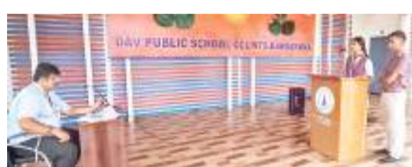
डीएवी स्कूल बरकाकाना में आयोजित प्रतियोगिता में भाग लेते बच्चे।

डीएवी बरकाकाना में अंतरसंदनीय वाद-विवाद प्रतियोगिता का आयोजन किया गया, जिसमें कक्षा नवम से ग्यारहवीं तक के बच्चों ने उत्साहपूर्वक भाग लिया। प्रतियोगिता का शुभारंभ विधिवत रूप से किया गया। बच्चों को चार अलग-अलग विषय दिए गए, जिन्हें लॉटरी सिस्टम के माध्यम से चुना गया। प्रत्येक बच्चे को पक्ष और विपक्ष में बोलने के लिए दो-दो मिनट का समय प्रदान किया गया। हिंदी प्रतियोगिता में 31 अंक के साथ द्रोण सदन को प्रथम, 27 अंक के साथ अगस्त्य सदन को द्वितीय एवं 21 अंक के साथ वशिष्ठ सदन को तृतीय स्थान प्राप्त हुआ। वहीं अंग्रेजी में परशुराम सदन को 34 अंक के साथ प्रथम,