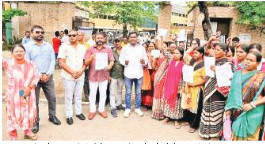
उपायुक्त कार्यालय के समक्ष बस्तीवासियों के साथ प्रदर्शन करते कांग्रेस के नेता व कार्यकर्ता.