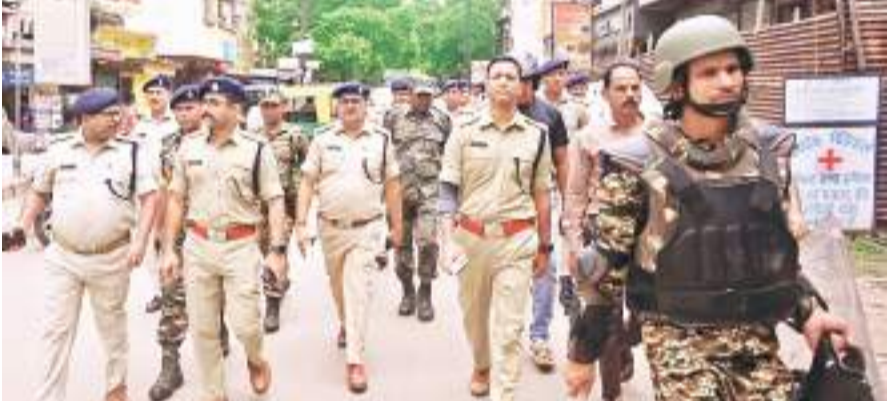
एसएसपी के नेतृत्व में फ्लैग मार्च करती जमशेदपुर पुलिस.