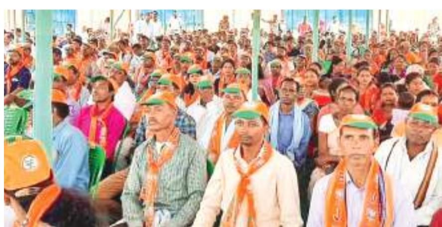
बैठक में शामिल भाजपा के कार्यकर्ता.