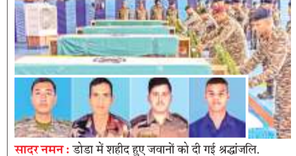
सादर नमन : डोडा में शहीद हुए जवानों को दी गई श्रद्धांजलि.