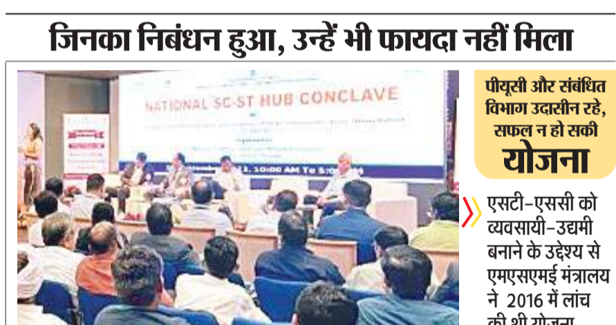
पीयूसी और संबंधित विभाग उदासीन रहे, सफल न हो सकी योजना