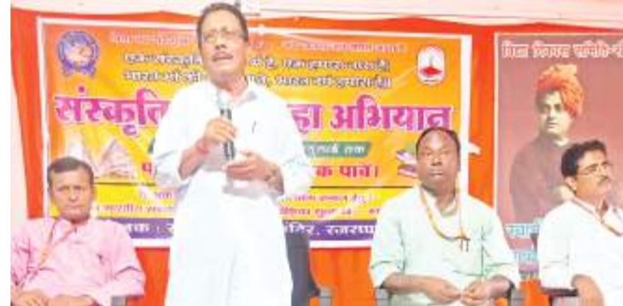
सरस्वती विद्या मंदिर में आयोजित संस्कृति ज्ञान महा अभियान पखवाड़ा कार्यक्रम को संबोधित करते वक्ता।