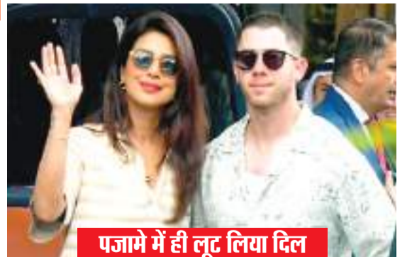
पजामे में ही लूट लिया दिल