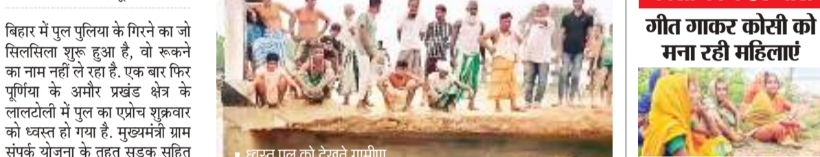
ध्वस्त पुल को देखते ग्रामीण