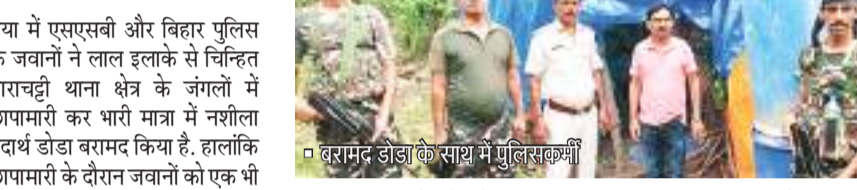
बरामद डोडा के साथ में पुलिसकर्मी

गया में एसएसबी और बिहार पुलिस के जवानों ने लाल इलाके से चिन्हित बाराचट्टी थाना क्षेत्र के जंगलों में छापामारी कर भारी मात्रा में नशीला पदार्थ डोडा बरामद किया है. हालांकि छापामारी के दौरान जवानों को एक भी तस्कर हाथ नहीं लगा. तस्करों की गिरफ्तारी के लिए जंगलों में तलाशी अभियान चलाया जा रहा है. जानकारी के मुताबिक, शुक्रवार की सुबह गया जिले के बीबी पेंसरा गांव स्थित 29वीं वहिनी एसएसबी के जवानों को गुप्त सूचना मिली थी. बताया गया था कि जिले के अति नक्सल प्रभावित