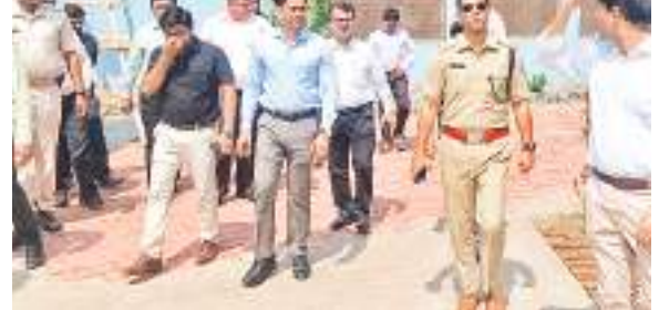
बहरागोड़ा में ग्राम न्यायालय भवन का निरीक्षण करने पहुंचे अधिकारी