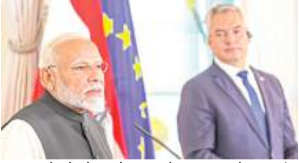
प्रधानमंत्री नरेंद्र मोदी के साथ के ऑस्ट्रिया के चांसलर कार्ल नेहमर, प्रे