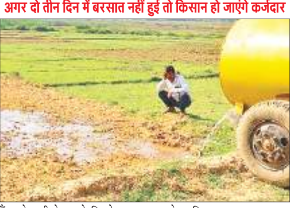
टैंकर के पानी से धान के बिचड़े का पटवन करते हुए किसान।

अगर दो तीन दिन में बरसात नहीं हुई तो किसान हो जाएंगे कर्जदार