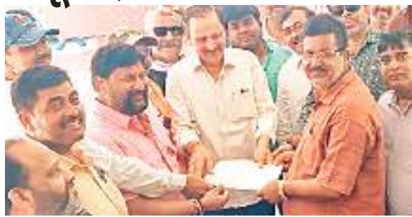
आवास बोर्ड कार्यपालक अभियंता के नाम जापान सौंपते भाजपा के नेता

आवास बोर्ड द्वारा डब्ल्यू टाइप समेत अन्य फ्लैट व मकान के सर्वे के विरुद्ध लगातार हो रहे आंदोलन के बीच भारतीय जनता पार्टी ने भी सर्वे को तत्काल रोकने की मांग की है। सर्वे के विरुद्ध भाजपा द्वारा सरकार के खिलाफ उग्र आंदोलन की सी घोषणा की गई है। बुधवार को भारतीय जनता पार्टी सरायकेला खरसावां जिला