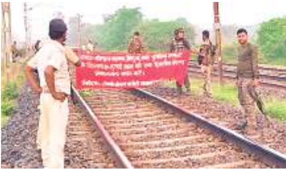
रेलवे ट्रैक पर लगाये बैनर को हटाने सुरक्षा बल के जवान

भाकपा माओवादी नक्सलियों द्वारा आहत कोल्हान बंद का असर ट्रेनों के परिचालन पर पड़ा है। नक्सलियों ने बंद शुरू होते ही हावड़ा-मुंबई मुख्य रेलमार्ग पर जराइकेला व मनोहरपुर स्टेशन के बीच रेलवे ट्रैक पर बैनर लगाकर ट्रेनों का परिचालन रोक दिया। नक्सलियों ने थर्ड रेल लाइन में किमी संख्या 378/35 ए के समीप रेलवे ट्रैक के बीचों बीच बैनर लगा दिया। इसके कारण मंगलवार रात दो बजे से बुधवार सुबह छह बजे तक इस मार्ग पर ट्रेनों का परिचालन बंद कर दिया गया। मार्ग से गुजर रही मालगाड़ी संख्या बीओसी / एलएमएनआर के क्रू मेंबर ने ट्रेक पर