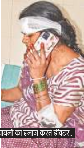
घायलों का इलाज करते डॉक्टर.