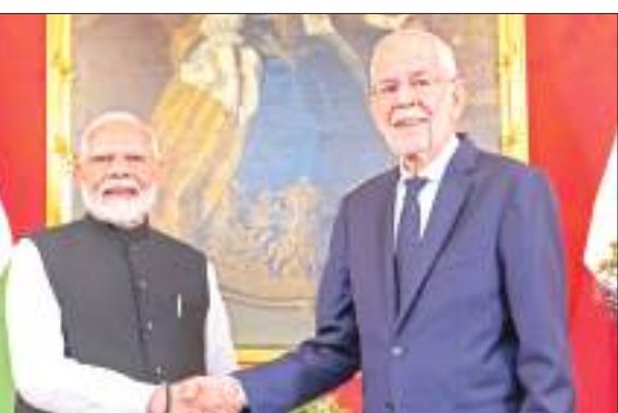
शांति की बहाली के लिए मध्यस्थता भी करने को भी तैयार हैं। यूक्रेन युद्ध के साथ ही पीएम मोदी और नेहमर ने आतंकवाद की भी कड़ी निंदा की।

मोदी ने कहा, मैं और चांसलर नेहमर ने विश्व में चल रहे विवादों, चाहे यूक्रेन में संघर्ष हो या पश्चिम एशिया की स्थिति, सभी पर विस्तार से बात की है। मैंने पहले भी कहा है कि यह युद्ध का समय नहीं है। उन्होंने कहा कि जंग के मैदान में समाधान नहीं निकल