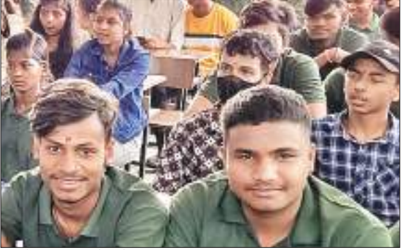
आईसेक्ट इंटर कॉलेज में आर्ट्स, साइंस व कॉमर्स की 11वीं की कक्षाएं शुरू।