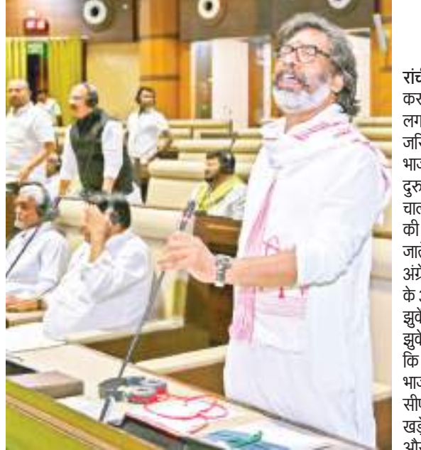
विधानसभा में पलोर टेस्ट से पूर्व संबोधित करते सीएम हेमंत सोरेन।