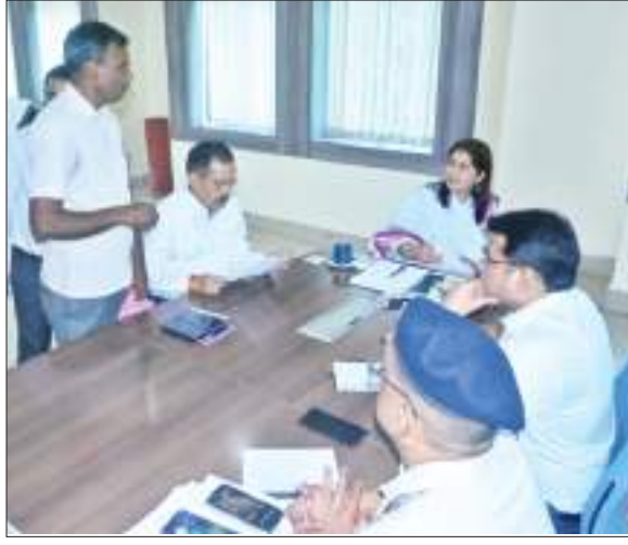
भी हुआ तो वहीं कुछ समस्याओं एवं शिकायतों के निवारण के लिए उसे संबंधित विभाग के पदाधिकारियों को भेजा गया है।

समाहरणालय स्थित कार्यालय कक्ष में आयोजित जनता दरबार में जिले के विभिन्न क्षेत्रों के लोगों ने उपायुक्त विजया जाधव के समक्ष अपनी-अपनी समस्याओं को रखा। लगभग 60 लोग अपनी समस्या को लेकर उपायुक्त के पास पहुंचे थे। कुछ समस्याओं का तत्काल ही समाधान