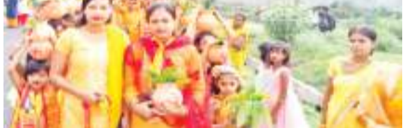
संवाददाता । मैथन

सैकड़ों महिलाएं कलश लेकर सुन्दर नगर स्थित बराकर नदी पहुंचीं