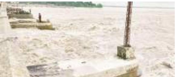
कोसी नदी खतरे के निशान से ऊपर बह रही है

बिहार में पिछले 24 घंटे में हुई मूसलाधार बारिश के कारण राज्य के नदी-नाले जहां उफान पर हैं, वहीं कोसी समेत कई नदियों का जल स्तर विभिन्न जगहों पर खतरे के निशान को पार कर चुका है। बिहार के जल संसाधन विभाग (डब्ल्यूआरडी) से प्राप्त जानकारी के अनुसार, चार जुलाई से बांका, बेगूसराय, भागलपुर, भोजपुर, बक्सर, गया, जहानाबाद, कैमूर, कटिहार, खाड़िया, मुंगेर, नालंदा, पटना, नवादा, पूर्णिया, सारण, शेखपुरा, सीवान और वैशाली सहित कई जिलों में हल्की से मध्यम बारिश दर्ज की गई। विभाग के अधिकारियों ने कहा, राज्य के कुछ जिलों में लगातार बारिश के कारण नदियां और नाले