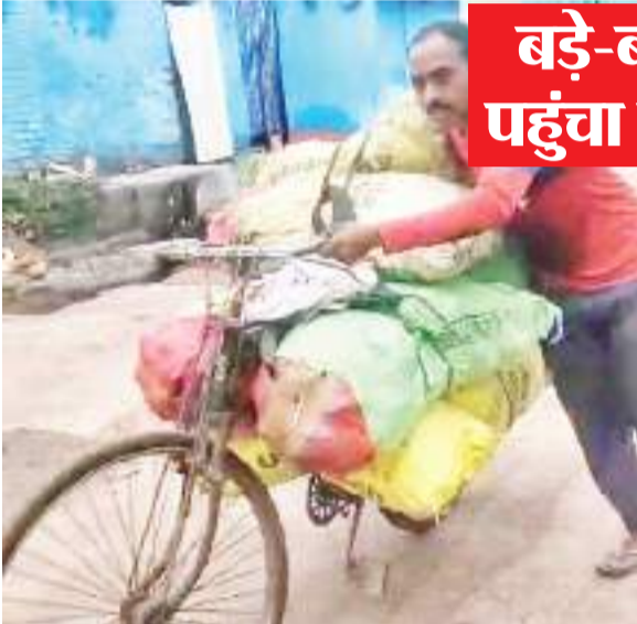
बड़े-बड़े कारखानों में कारोबारी पहुंच रहे हैं भारी मात्रा में कोयला