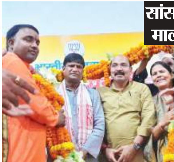
संवाददाता । मैथन

चिरकुंडा टाउन हॉल में शनिवार को भाजपाइयों ने सांसद दुल्लू महतो का अभिनंदन किया. निरसा विधायक अपर्णा सेनगुप्ता की अध्यक्षता में आयोजित समारोह में सांसद का स्वागत 101 किलो फूलों की माला पहनाकर किया गया. कार्यक्रम में निरसा विधानसभा क्षेत्र के सभी 528 वृक्षों के कार्यकर्ता शरीक हुए. दुल्लू महतो ने लोकसभा चुनाव में बूथों पर भाजपा को बेहतर बढ़त दिलाने वाले कार्यकर्ताओं को सम्मानित किया. उन्होंने कार्यकर्ताओं से कहा कि विधानसभा चुनाव में इससे भी बेहतर