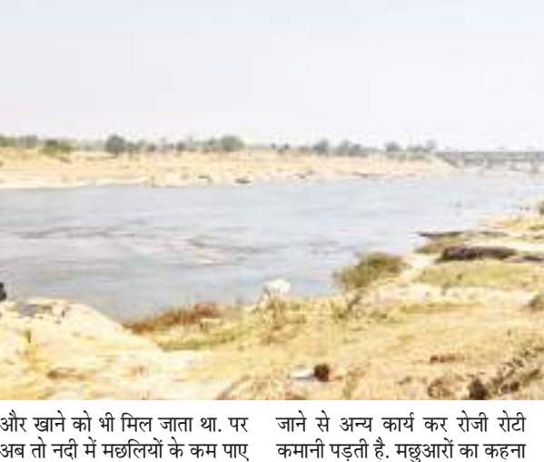
है कि इस नए दौर में नए लोग नई तकनीक के जरिये विस्फोटक का