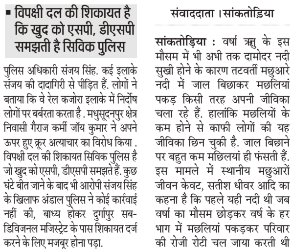
है कि इस नए दौर में नए लोग नई तकनीक के जरिये विस्फोटक का