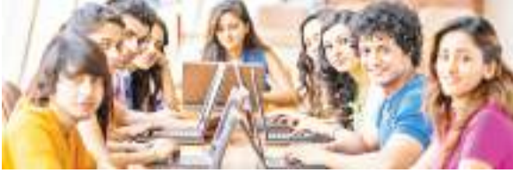
मशीन लर्निंग और न्यूरल नेटवर्क की मूल बातें से लेकर प्राकृतिक भाषा प्रसंस्करण और कंप्यूटर दृष्टि जैसे अधिक उन्नत विषयों तक की एक विस्तृत श्रृंखला है शामिल

छात्रों को भविष्य की आवश्यकताओं के लिए तैयार करने के उद्देश्य से एक क्रान्तिकारी पहल में, ओडीएम एजुकेशनल ग्रुप ने कक्षा I-IX के छात्रों के लिए एक व्यापक ऑनलाइन एडुकेशनल कोर्स लॉन्च किया है। यह अभिनव कार्यक्रम स्कूल पाठ्यक्रम में उन्नत प्रौद्योगिकी शिक्षा को एकीकृत करने की दिशा में एक महत्वपूर्ण कदम है, जिससे छात्रों को 21वीं सदी के नौकरी बाजार की बदलती मांगों के लिए तैयार किया जा सके। यह एआई कोर्स, जो क्षेत्र में अपनी तरह का पहला है, ओडीएम