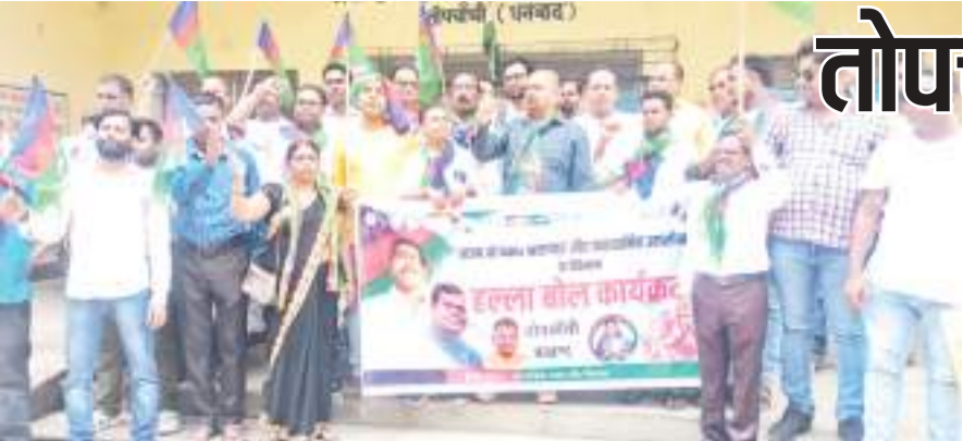
संवाददाता । तोपचांची

बिजली आपूर्ति नहीं होने से क्षेत्र की जनता को समस्याओं का करना पड़ता है सामना