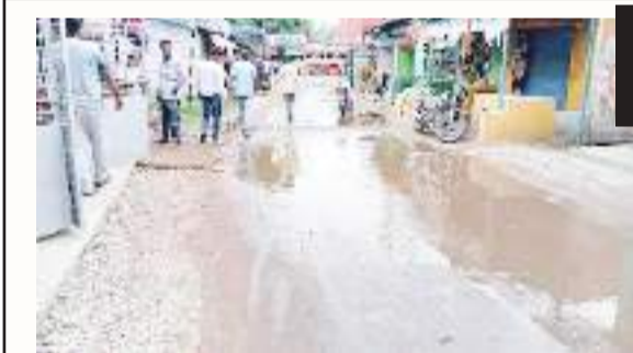
जामुडिया । हाल ही में हुई हल्की बारिश ने पश्चिम बर्दवान के जामुडिया में सड़कों की स्थिति को

प्रशासन का सहयोग मिलना बहुत जरूरी है। इन सभी अवैध कोयला कारोबारियों को प्रशासन का सह है। जिसके बल पर यह लोग खुलेआम दिन के उजाले में अवैध कोयला का कारोबार कर रहे हैं। उन्होंने कहा कि वार्ड नंबर 68 के बराकर गायत्री मंदिर के समीप चुपचाप बैठ जाने पर यह कोयला तस्करी का नजारा खुलेआम निरंतर दिखाई पड़ेगा। उन्होंने बताया कि यहां दर्जनों की संख्या में इस तरह के साइकिल स्कूटर और मोटरसाइकिल हैं। जिस के सहारे यह कारोबार निरंतर चलता रहता है। लोगों ने बताया कि पुलिस के गश्ती लगाने वाली गाड़ी भी इन्हें कुछ नहीं बोलता है। जिस कारण यह अवैध धंधा यहां भरपूर फूल फूल रहा है और पुलिस प्रशासन चुपी साधे हुए है।