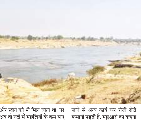
और खाने को भी मिल जाता था। पर अब तो नदी में मछलियों के कम पाए