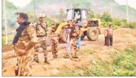
लोडकर बीसीसीएल प्रबंधन को सौंप दिया गया।

सभी अवैध कोयला तस्करों में खलबली मच गई। साथ ही कुछ खाकी वर्दी वाले पुलिस अधिकारी व सप्ता पक्ष के सफेद पोशा नेताओं