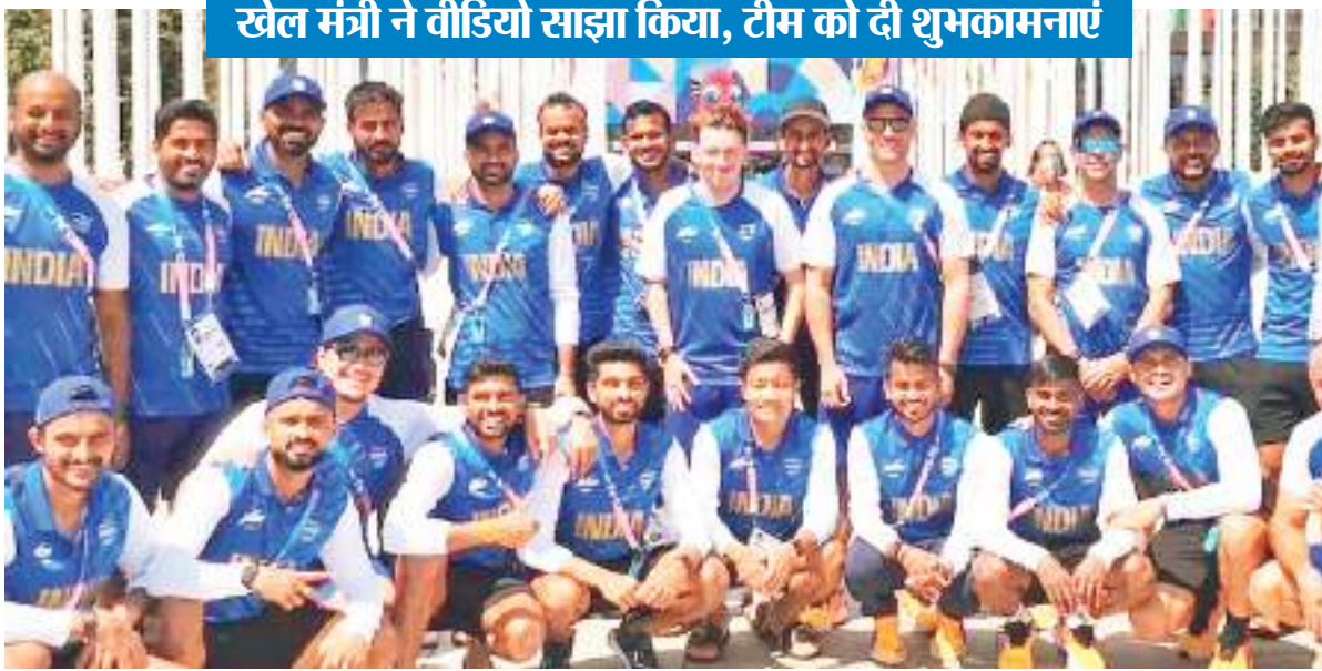
खेल मंत्री ने वीडियो साझा किया, टीम को दी शुभकामनाएं

भारतीय टीम की नजरें गोल्ड मेडल पर : टोक्यो ओलंपिक 2020 में कांस्य पदक जीतने के बाद भारतीय टीम की नजर अपने पदक का रंग बदलकर स्वर्ण पर टिकी होगी। भारतीय पुरुष हॉकी टीम अपने पेरिस 2024 ओलंपिक अभियान की शुरुआत 27 जुलाई को करेगी। पुल-बी में उसका पहला मैच न्यूजीलैंड से है। इसके बाद 29 जुलाई को भारतीय टीम अर्जेंटीना से, 30 जुलाई को आयरलैंड से और एक अगस्त को बेल्जियम से भिड़ेगी। टीम इंडिया शुभ चरण का अपना अंतिम मैच दो अगस्त को ऑस्ट्रेलिया के खिलाफ खेलेगी। शीर्ष चार में रहने से भारत नॉकआउट चरण में पहुंच जाएगा।