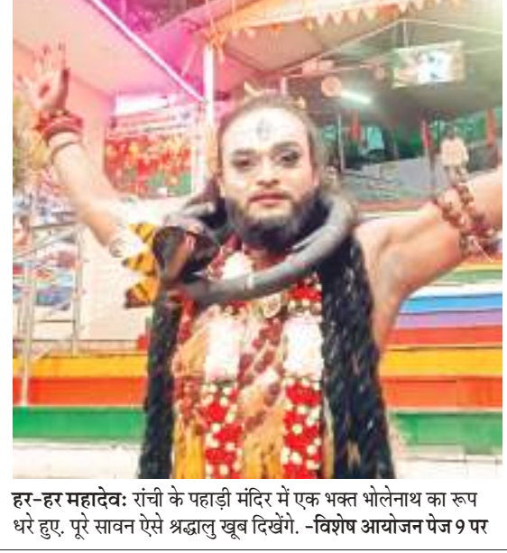
हर-हर महादेव: रांची के पहाड़ी मंदिर में एक भक्त भोलेनाथ का रूप धरे हुए. पूरे सावन ऐसे श्रद्धालु खूब दिखेंगे. -विशेष आयोजन पेज 9 पर