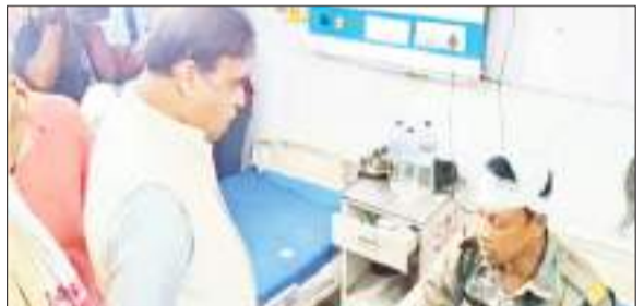
रिम्स में घायल सहायक पुलिसकर्मी से मिलते हिमंता।