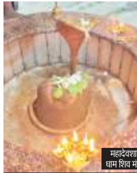
महादेवशाल धाम शिव मंदिर