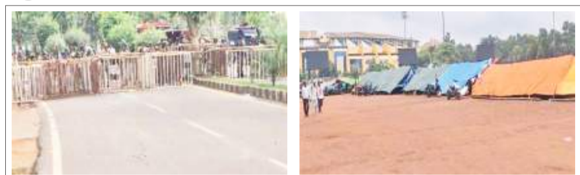
राजधानी रांची के मोरहाबादी जानेवाले सभी रास्ते में बैरिकेडिंग कर भारी संख्या में पुलिस के जवान तैनात किए गए। तंबू में जमे हैं सहायक पुलिसकर्मी।