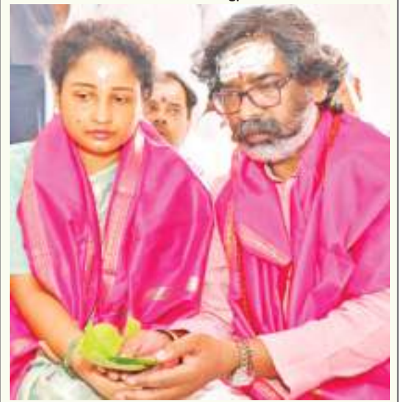
सीएम हेमंत सोरेन और कल्पना सोरेन ने शनिवार को देवघर मंदिर में पूजा-अर्चना की। राज्य की मंगल कामना की।