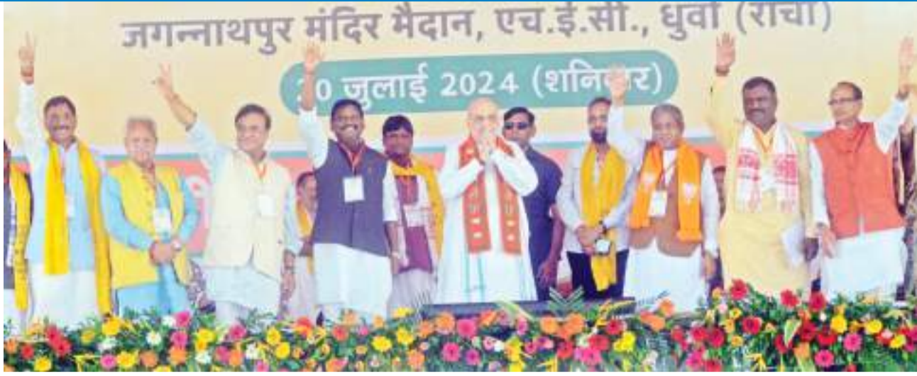
रांची में आयोजित भाजपा की विस्तारित कार्यसमिति की बैठक में शामिल गृह मंत्री अमित शाह, केंद्रीय मंत्री शिवराज सिंह चौहान, संजय सेठ, असम के सीएम हिमंता बिस्व सरमा, पूर्व सीएम बाबूलाल मरांडी, अर्जुन मुंडा सहित अन्य नेता व कार्यकर्ता।

मीन आय के लिए किया गया प्रयास सफल होगा, पर लेन-देन में जल्दबाजी न करें, किसी व्यक्ति के व्यवहार से क्लेश होगा, आय होगी, जोखिम न उठाएँ, वाहन व मशीनरी के प्रयोग में लापरवाही न करें, किसी से विवाद हो सकता है।