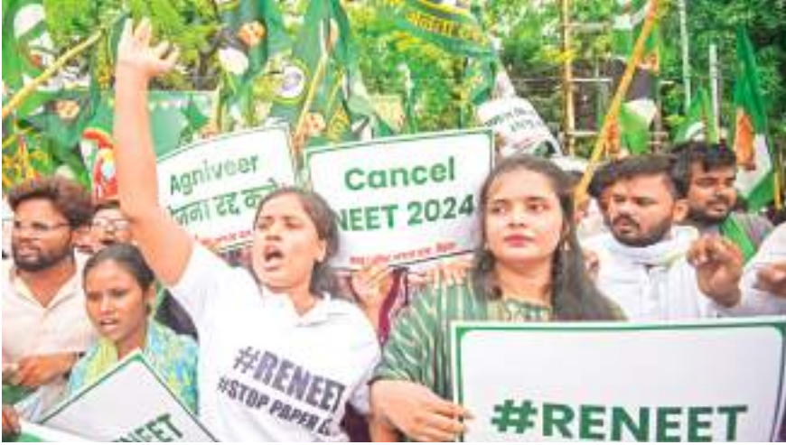
राजद के छात्र विंग के सदस्यों ने पटना में एनईईटी परीक्षा में अनियमितताओं को लेकर राजभवन तक विरोध मार्च निकाला।

पटना । एनडीए ने उपेंद्र कुशवाहा को राज्यसभा भेजने का फैसला लिया है। एनडीए ने यह फैसला सभी सहयोगी दलों की सहमति से लिया है, जिसके तहत उपेंद्र कुशवाहा राज्यसभा के उम्मीदवार होंगे। डिप्टी मुख्यमंत्री सभाट चौधरी ने मीडिया से बातचीत में कहा कि उपेंद्र कुशवाहा को राज्यसभा भेजने का निर्णय एनडीए के सभी दलों का सामूहिक फैसला है। यह कदम कुशवाहा समुदाय के समर्थन को बनाए रखने के लिए उठाया गया है, जो बिहार की राजनीति में एक महत्वपूर्ण घटक है। उल्लेखनीय है कि उपेंद्र कुशवाहा ने हाल ही में काराघाट सीट से लोकसभा चुनाव में हार का सामना किया था। इसके बावजूद बिहार में कुशवाहा वोट बैंक की महत्वपूर्णता को देखते हुए एनडीए ने उन्हें राज्यसभा भेजने का निर्णय लिया है।