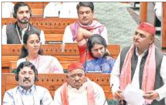
विकास के नाम पर अरबों का भ्रष्टाचार

समाजवादी पार्टी के अध्यक्ष अखिलेश यादव ने मंगलवार को कहा कि इस लोकसभा चुनाव में सकारात्मक राजनीति की जीत हुई, गत चार जून को सांप्रदायिक राजनीति से देश को आजादी मिली तथा सामुदायिक राजनीति की शुरुआत हुई। उन्होंने राष्ट्रपति के अभिभाषण पर लोकसभा में आए गए धन्यवाद प्रस्ताव पर चर्चा में भाग लेते हुए यह भी कहा कि इंडिया गठबंधन को भी जिम्मेदारी का पैगाम दिया है। उन्होंने यह भी कहा कि यदि उनकी पार्टी उन्नत प्रदेश की सभी 80 लोकसभा सीट जीत जाए, तब भी उन्हें इवीएम पर भरोसा नहीं होगा। यादव ने कहा, चार जून देश के लिए सांप्रदायिक राजनीतिक से आजादी का दिन था। सांप्रदायिक राजनीति का अंत हुआ और सामुदायिक राजनीति की शुरुआत हुई। इस चुनाव में सांप्रदायिक राजनीति की हमेशा के लिए हार हो गई। उन्होंने कहा, सकारात्मक राजनीति की जीत हुई है, हम मानते हैं कि संविधान ही संजीवनी है और उसकी जीत हुई है। देश जनमर्जी से ही चलेगा : सपा संसद ने कहा कि देश किसी की निजी महात्वाकांक्षा से नहीं, बल्कि जन आकांक्षा से चलेगा, और अब मानमर्जी नहीं, बल्कि जनमर्जी चलेगी। यादव ने आरोप लगाया कि इस सरकार ने आरक्षण के साथ