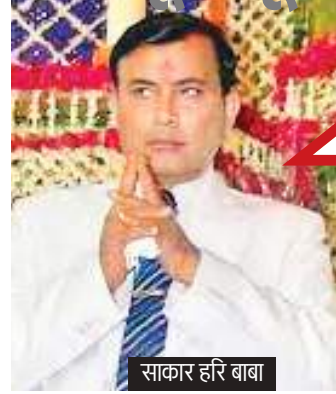
साकार हरि बाबा

बाद पटना के गांधी मैदान में भगदड़ मचने से 32 लोगों की मौत हो गई और 26 अन्य घायल हो गए। 13 अक्टूबर 2013 : मध्य प्रदेश के दतिया जिले में रतनगढ़ मंदिर के पास नवरात्रि उत्सव के दौरान मची भगदड़ में 115 लोगों की मौत हो गई और 100 से ज्यादा लोग घायल हो गए। भगदड़ की शुरुआत नदी के पुल टूटने की अफवाह से हुई जिसे श्रद्धालु पार कर रहे थे। 19 नवंबर 2012 : पटना में गंगा नदी के तट पर अदालत घाट पर छठ पूजा के दौरान एक अस्थायी पुल के ढह जाने से मची भगदड़ में लगभग 20 लोगों की मौत हो गई और कई अन्य घायल हो गए। 08 नवंबर 2011 : हरिद्वार में गंगा नदी के तट पर हरकी पैड़ी घाट पर मची भगदड़ में कम से कम 20 लोगों की