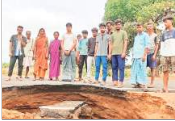
ही नहीं गाईवाँल नहीं होने के कारण लगभग चार जगहों पर पानी के साथ सड़क के नीचे की मिट्टी भी बह गई है। जिससे जगह-जगह गोफ बन गया