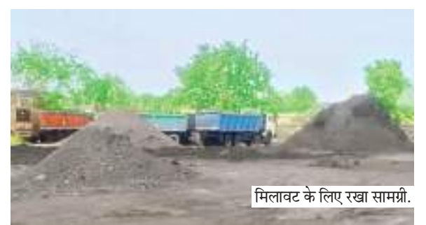
मिलावट के लिए रखा सामग्री।