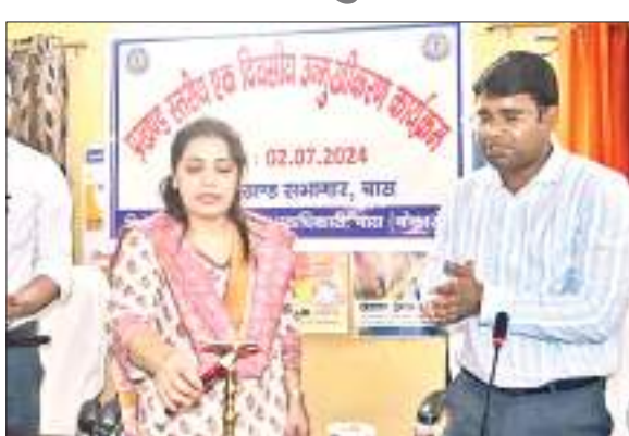
मुखिया आम लोगों तक योजनाओं की जानकारी पहुंचाएँ, ताकि अधिक से अधिक लोग लाभान्वित हो सकें। उन्मुखीकरण कार्यक्रम का उद्देश्य भी यही है।