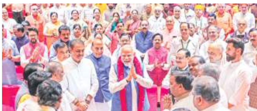
एनडीए के बैठक में शामिल होने जाते प्रधानमंत्री नरेंद्र मोदी.

प्रधानमंत्री नरेंद्र मोदी ने मंगलवार को एनडीए के सांसदों से संसदीय नियमों एवं आचरण का पालन करने तथा वरिष्ठ सदस्यों से सर्वश्रेष्ठ प्रथाओं के बारे में सीखने को कहा। एनडीए सांसदों के लिए पीएम मोदी की यह सलाह लोकसभा में विपक्ष के नेता राहुल गांधी के उस भाषण के एक दिन बाद आई है, जिसे सत्तारूढ़ गठबंधन के नेताओं ने बेहद गैरजिम्मेदाराना करार दिया था। सूत्रों के मुताबिक, राजग संसदीय दल की बैठक को संबोधित करते हुए मोदी ने कहा कि विपक्ष इस बात से परेशान है कि पहली बार कोई गैर कांग्रेसी नेता