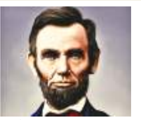
16वें राष्ट्रपति अब्राहम लिंकन.

वाशिंगटन। अमेरिका के 45वें राष्ट्रपति रहे डोनाल्ड ट्रंप पर शनिवार को हुए जानलेवा हमले से पहले भी इस देश में राष्ट्रपतियों, पूर्व राष्ट्रपतियों और प्रमुख दलों के राष्ट्रपति पद के उम्मीदवारों को निशाना बनाने की कई घटनाएं हो चुकी हैं। वर्ष 1776 से देश के राजनीतिक इतिहास में हत्या और हत्या के प्रयासों की कुछ ऐसी ही घटनाएं इस प्रकार हैं : अमेरिका के 16वें राष्ट्रपति अब्राहम लिंकन : अब्राहम लिंकन अमेरिका के पहले राष्ट्रपति थे, जिनकी जॉन वॉट्स बूथ ने 14 अप्रैल 1865 की गोली मार कर हत्या कर दी थी। घटना के दौरान वह अपनी पत्नी मेरी टॉड लिंकन के साथ वाशिंगटन के फोर्ड थियेटर में 'अवर अमेरिकन कनिंग' नाटक देख रहे थे। अमेरिका के 20वें राष्ट्रपति एस्स राफोर्ड : मारफील्ड देश के दूसरे राष्ट्रपति थे जिनकी कार्यभार संभालने के छह महीने बाद हत्या