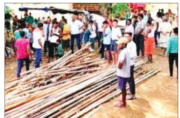
पुल निर्माण स्थल पर विरोध-प्रदर्शन करते ग्रामीण.

प्रखंड क्षेत्र अंतर्गत राजा घटहूआ के मेहता टोला के ग्रामीणों ने रिविदार को आक्रोश व्यक्त किया. जहां घटहूआ कला गांव स्थित पंचायत सचिवालय के समीप पंडी नदी में निर्माण हो रहे पुल के संवेदक के विरोध प्रदर्शन किया. उक्त टोले के ग्रामीणों ने कहा कि मरीज को चारपाई पर लेटाकर मुख्य सड़क पर लाना पड़ रहा है. साथ ही घटहूआ कला गांव में ही बाइकों को खड़ा करना पड़ रहा है. ग्रामीणों ने बताया कि घटहूआ कला गांव स्थित माध्यमिक विद्यालय में अध्ययनरत बच्चों को स्कूल में जाने