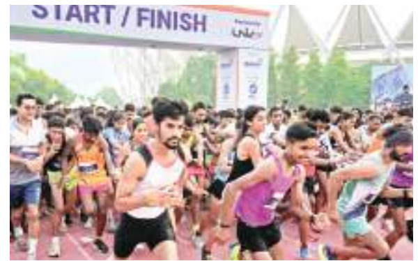
मैराथन में भाग लेते प्रतिभागी.