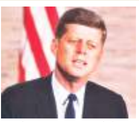
35वें राष्ट्रपति जॉन एफ केनेडी.

कर दी गयी थी। वह दो जुलाई 1881 को वाशिंगटन में एक ट्रेन स्टेशन की ओर जा रहे थे तभी चार्ल्स गिटेऊ ने उन्हें गोली मार दी थी। अमेरिका के 25वें राष्ट्रपति विलियम मैकिनले : मैकिनले को छह सितंबर 1901 में न्यूयॉर्क के बफेलो में तब गोली मारी गई थी जब वह भाषण देने के बाद लोगों से हाथ मिला रहे थे। एक व्यक्ति ने नजदीक से उनकी छाती में दो गोली मारी। मैकिनले की 14 सितंबर 1901 में मौत हो गयी थी। उनके बाद उपराष्ट्रपति थियोडोर रूजवेल्ट देश