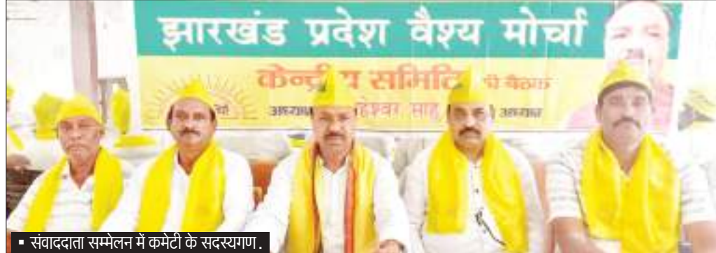
संवाददाता सम्मेलन में कमेटी के सदस्यगण