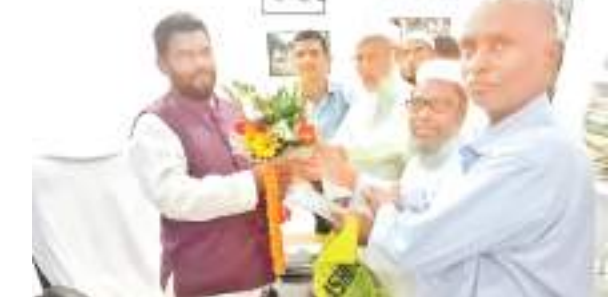
शिक्षा मंत्री को गुलदस्ता देते प्रतिनिधिमंडल के सदस्य