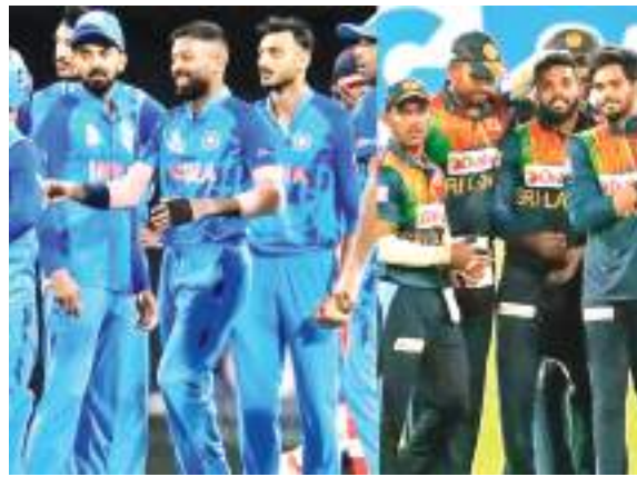
हैं। ऐसे में भारतीय क्रिकेट कंट्रोल बोर्ड ने पूर्व ओपनर गौतम गंभीर को नया हेड कोच बनाया है। अब गंभीर इस श्रीलंका दौरे से ही अपनी कोचिंग का आगाज करेंगे, हालांकि अभी तक

जिंबाब्वे दौरे के बाद टीम इंडिया श्रीलंका दौरे पर जाएगी। जिंबाब्वे में टीम इंडिया 5 मैचों की टी20 सीरीज खेल रही है। इसके बाद उसे श्रीलंका दौरे पर जाना है, जहां तीन मैचों की टी20 और फिर तीन मैचों की वनडे सीरीज खेलनी है। इन दोनों ही सीरीज का शेंड्यूल जारी कर दिया गया है। पिछले ही महीने रोहित शर्मा की कप्तानी में भारतीय टीम ने टी20 वर्ल्ड कप खिताब जीता है। इस टूर्नामेंट के बाद ही वतीर कोच राहुल द्रविड़ का कार्यकाल खत्म हो गया