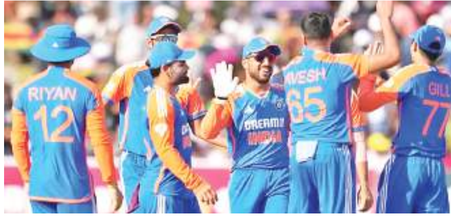
प्रतिभा की बानगी पेश की। भारत के पास अब इस प्रारूप में विराट

दिग्गजों के संन्यास के बाद भारतीय टीम में जगह बनाने की कोशिश में हैं। इनमें वॉशिंगटन सुंदर और अभिषेक शर्मा शामिल हैं। टी20 क्रिकेट से रविंद्र जडेजा के संन्यास के बाद वॉशिंगटन की नजरें स्पिन हरफनमौला के रूप में टीम में जगह पक्की करने पर लगी है। जिंबाब्वे के खिलाफ उन्होंने 4.5 की इकॉनॉमी रेट से छह विकेट लिये। श्रीलंका दौरे के लिए संफेद गेंद की टीम चुनते समय उनके नाम पर विचार जरूर होगा। उपयोगी स्पिन गेंदबाज होने के साथ वह निचले क्रम के अच्छे बल्लेबाज भी हैं। वहीं अभिषेक ने दूसरे टी20 में 47 गेंद में शतक लगाकर अपनी