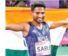
मुझे लगता था कि ओलंपिक पदक विजेता कुछ अनूठे और कठिन तरीके से तैयारी करते हैं लेकिन पिछले दो साल के मेरे अनुभव ने मेरा आत्मविश्वास बढ़ाया है। साबले इस महीने की शुरुआत में पेरिस डायमंड लीग में छठे स्थान पर रहे और उन्होंने

भारत के 3000 मीटर के शीर्ष स्टीपलचुस खिलाड़ी अविनाश साबले ओलंपिक में सिर्फ एक प्रतिभागी बनकर नहीं जाना चाहते और उन्हें यकीन है कि वह पेरिस में पदक जीत सकते हैं। हाल ही में अपना राष्ट्रीय रिकॉर्ड तोड़ने वाले 29 वर्ष के साबले टोक्यो ओलंपिक 2021 में फाइनल में जगह नहीं बना सके थे। उन्होंने कहा, मैं सिर्फ भाग लेने नहीं जा रहा हूँ, मेरा विश्वास है कि मैं पदक जीत सकता हूँ। मेरा फोकस लक्ष्य पर है और सब कुछ ठीक रहा तो मैं पदक जीत सकता हूँ।