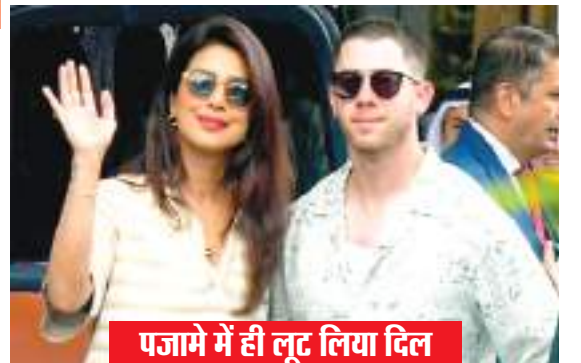
पजामे में ही लूट लिया दिल