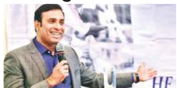
ने बीसीसीआई द्वारा एक्स पर डाले गए वीडियो में कहा, दक्षिण अफ्रीका को आखिरी पांच ओवर में 30 रन चाहिए थे। उसके बाद से जुझारूपन, दृढ़ता और आत्मविश्वास दिखाकर

महान बल्लेबाज वीवीएस लक्ष्मण ने हार की कगार पर पहुंचकर टी20 विश्व कप में खिताबी जीत दर्ज करने वाली भारतीय क्रिकेट टीम के जुझारूपन की तारीफ की। करते हुए कहा कि खिलाड़ियों और पूर्व मुख्य कोच राहुल द्रविड़ का जश्न मनाने का अंदाज साबित करता है कि इस जीत के उनके लिये क्या मायने थे। भारत ने दक्षिण अफ्रीका को 29 नज्द को बारबरादस्त में खेले गए फाइनल में सात रन से हराकर 11 साल में पहली बार आईसीसी खिताब जीता। लक्ष्मण