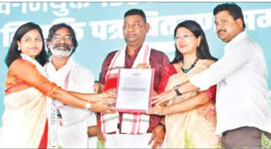
पीजीटी शिक्षकों के नियुक्ति पत्र बांटते सीएम हेमंत सोरेन, मंत्री सत्यानंद भोक्ता, रास सांसद महुआ माजी व अन्य.

इतनी गहरी साजिश रांची कि मुझे 5 महिने जेल में रहना पड़ा : हेमंत ने कहा कि 2019 में पूर्ण बहुमत के साथ हमारी सरकार बनी। सरकार ने काम-काज संभाला भी नहीं था कि कोरोना आ गया। हालात इतने खराब थे कि सड़क पर ही मं अपने बच्चों को जन्म देने को विवश हो गयीं। राज्य में स्वास्थ्य एवं चिकित्सा व्यवस्था की हाहात बहुत ही खराब थी। इसके बाद भी हमारी सरकार ने अफरा-तफरी करने नहीं दिया। न केवल लोगों को लाया गया बल्कि उनके लिए जीवन और जीविका दोनों का ख्याल रखा। झारखंड पूरे देश में इकलौता राज्य बना जिसमें उस दौर में आंखमोचन सपनाई दूसरे प्रदेशों में की। कोरोना खत्म होते