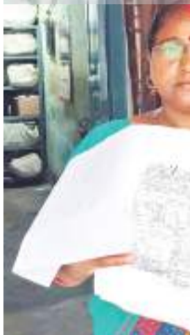
भेजा गया। अब कहां जाएं, समझ में नहीं आ रहा है। सबलपुर से आने

जाने में अब तक हजारों रुपये फूंक चुके हैं।