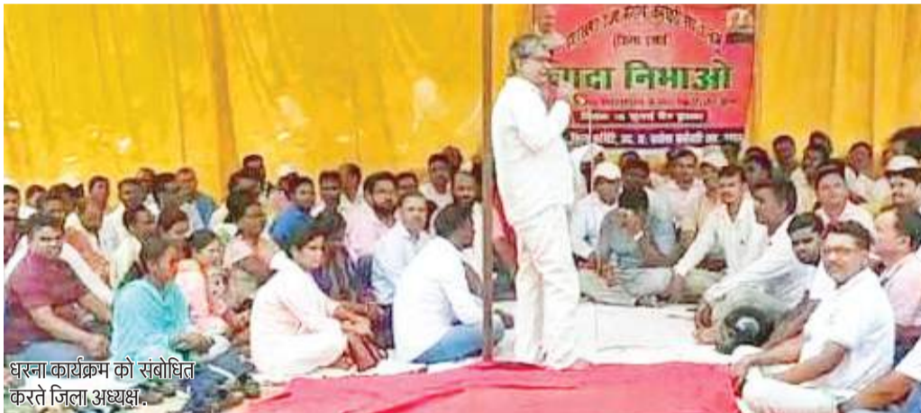
धरना कार्यक्रम को संबोधित करते जिला अध्यक्ष।