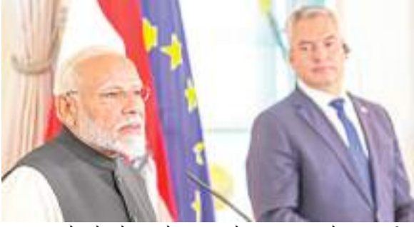
प्रधानमंत्री नरेंद्र मोदी के साथ के ऑस्ट्रिया के चांसलर कार्ल नेहमर, प्रे