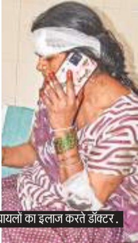
घायलों का इलाज करते डॉक्टर.