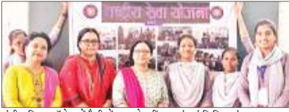
रांची महिला कॉलेज में रैली में भाग ले रही छात्राएं एवं शिक्षिकाएं।