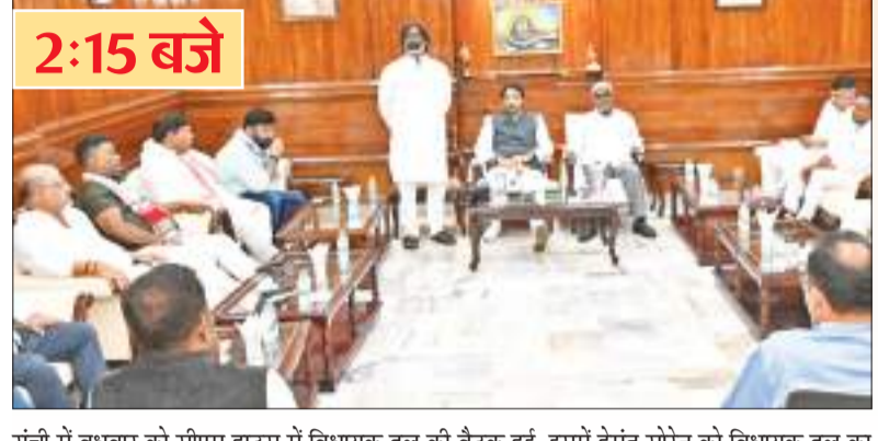
रांची में बुधवार को सीएम हाउस में विधायक दल की बैठक हुई. इसमें हेमंत सोरेन को विधायक दल का नेता चुना गया. इस बैठक में झामुमो, कांग्रेस व राजद के विधायक मौजूद थे.