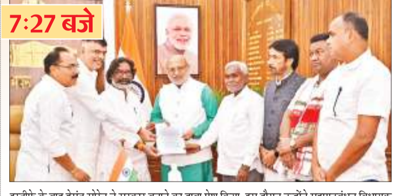
इस्तीफे के बाद हेमंत सोरेन ने सरकार बनाने का दावा पेश किया. इस दौरान उन्होंने महागठबंधन विधायक दल के 44 विधायकों का समर्थन पर राज्यपाल सीपी राधाकृष्णन को सौंपा.