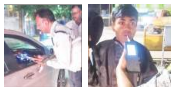
राजधानी में मंगलवार देर रात जांच करते पुलिस पदाधिकारी व जवान।

एसएसपी चंदन सिन्हा के निर्देश पर राजधानी रांची में ड्रंक एंड ड्राइव और एंटी क्राइम चेकिंग अभियान चलाया गया। बीते दो जुलाई की देर रात सभी थाना क्षेत्रों के विभिन्न स्थानों में सड़क सुरक्षा और अपराध नियंत्रण के लिए यह अभियान चलाया गया। इस अभियान का मुख्य उद्देश्य सड़क दुर्घटनाओं को रोकना, नागरिकों की सुरक्षा सुनिश्चित करना और अपराधियों पर लगातार कसना था। विभिन्न स्थानों पर नाकेबंदी की गई : अभियान के तहत जिले के सभी थाना क्षेत्रों में पुलिस टीमों द्वारा विभिन्न स्थानों पर नाकेबंदी कर सड़क वाहनों की जांच की गई। चेकिंग के दौरान ड्रंक एंड ड्राइव के मामलों पर विशेष ध्यान दिया गया। विान चालकों को ब्रेथ एनालाइजर से चेक किया गया और शराब पीकर