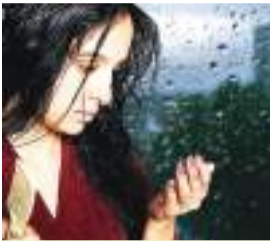
होम्योपैथी तथा बायोकेमिक दवाओं से निदान

■ बालों की समस्याएँ इस मौसम में काफी नमी होती है। इस कारण सर की त्वचा आँखली हो जाती है। इस मौसम में बालों को देखभाल की आवश्यकता अधिक होती है। मौसम के उतार-चढ़ाव से बालों में नमी बनी रहती है और ऐसी स्थिति में धीरे-धीरे बाल कमजोर हो जाते हैं और टूटने लगते हैं। गर्मी के कारण पसीना और गंदगी का जमाव बालों के रोम छिद्रों को बंद कर देता है। नमी के कारण बालों में फंगल इंफेक्शन बढ़ जाता है। उसकी प्राकृतिक नमी खत्म हो जाती है, जिससे स्केल्यर पर रुसी भी जम जाती है। बारिश के मौसम में बाल कई बार गीले रह जाते हैं जिससे