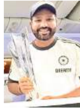
पोस्ट करते हुए लिखा, घर आ रहे हैं। विमान में भारतीय टीम, उसका सहयोगी स्टाफ, खिलाड़ियों के

टी20 विश्व कप जीतने वाली भारतीय क्रिकेट टीम श्रेणी चार के तूफान के कारण तीन दिन यहां फंसे रहने के बाद अंततः बुधवार को ग्रांटली एडम्स अंतरराष्ट्रीय हवाई अड्डे से विशेष विमान के जरिए दिल्ली के लिए रवाना हो गयी। एयर इंडिया के विशेष विमान एआईसी24 डब्ल्यूसी (एयर इंडिया चैंपियंस 24 विश्व कप) ने स्थानीय समयानुसार सुबह लगभग चार बजकर 50 मिनट पर उड़ान भरी और गुरुवार को भारतीय समयानुसार सुबह लगभग छह बजकर 20 मिनट पर दिल्ली पहुंचेगा। भारतीय कप्तान रोहित शर्मा ने विमान के उड़ान भरने से पहले ट्रॉफी के साथ तस्वीर इंस्टाग्राम पर