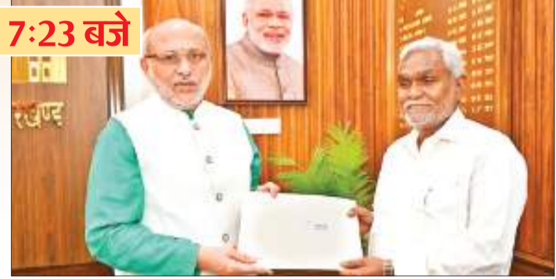
मुख्यमंत्री चंपाई सोरेन ने बुधवार शाम 7.23 बजे राज्यपाल को अपना इस्तीफा सौंपा.