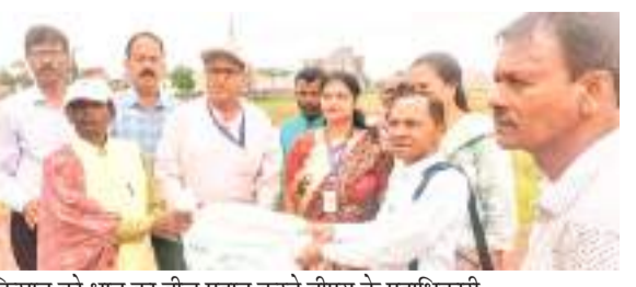
किसान को धान का बीज प्रदान करते बीएयू के पदाधिकारी।