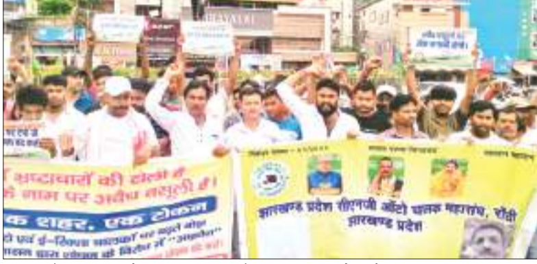
हाथों पर बैनर-तख्तियां लेकर अल्बर्ट एक्का चौक पर प्रदर्शन करते ऑटो व ई-रिक्शा चालक।