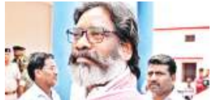
प्रवीण कुमार। रांची

हेमंत सोरेन 38 साल की उम्र में पहली बार झारखंड के मुख्यमंत्री बने। हेमंत सोरेन ने 2003 में छात्र राजनीति में कदम रखा था। अपने राजनीतिक सफर के दौरान उन्हें दुमका और बरहेट विधानसभा में असाधारण कार्य करने को लेकर 2019 में चैंपियंस ऑफ चेंज अवार्ड से सम्मानित भी किया गया। यह अवार्ड 20 जनवरी 2020 को विज्ञान भवन, नई दिल्ली में तत्कालीन राष्ट्रपति प्रणब मुखर्जी ने दी थी। झारखंड की राजनीति का एक अमिट लकीर के रूप में विरासत में मिली राजनीति को सही साबित किया। झारखंड आंदोलन के अग्रणी शिबू सोरेन की दूसरी संतान के रूप में हेमंत का जन्म 10 अगस्त 1975 को हुआ था। अपने बड़े भाई दुर्गा सोरेन की मृत्यु के बाद अपनी उच्च शिक्षा बीच में ही छोड़ छात्र जीवन से राजनीति में उतर आए थे। 2019 विधानसभा में झामुमो की बड़ी जीत हासिल करने के बाद महागठबंधन के साथ मिलकर राज्य की सत्ता संभाली। कोरोना काल में अपने कार्यों से पूरे देश को प्रभावित किया। प्रवासी मजदूरों को लेकर किए गये कामों से उनकी एक अलग पहचान पूरे देश में बनी जो शायद देश के अन्य राज्यों के मुख्यमंत्री को नहीं बन सकी। बहुमत की सरकार रहने के बाद भी 2022 में कांग्रेस के तीन विधायकों इरफान अंसारी, नमन विक्सल कोनगाड़ी और राजेश कच्छप के पास सीमा मिलना से सरकार डगमगाने लगी, जिसे हेमंत सोरेन ने अपनी सूझबूझ के साथ संभाला। इसके 2023 में जमीन घोचाले में उनका नाम आने के बाद 31 जनवरी 2024 को इंडी द्वारा उन्हें गिरफ्तार किया गया।