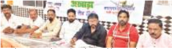
सेंट्रल मुहर्रम कमेटी की बैठक में हिस्सा लेते अखाड़ों के खलीफा।

नजर आ जाने के बाद मुहर्रम से संबंधित तमाम कार्यक्रम पूर्व की तरह प्रत्येक अखाड़े व इमामबाड़े में आयोजित किए जायेंगे इस वर्ष चंद्र मुहर्रम को सफल बनाने के लिये प्रत्येक अखाड़ा धारियों के लिए गाईड लाईन भी जारी कर दिया जायेगा।